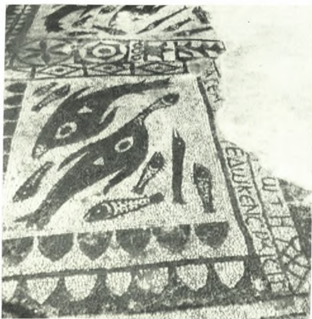
β. Ψηφιδωτὸν διάχωρον μετὰ παραστάσεως ἰχθύων καὶ ἐπιγραφῆς τῆς βασιλικῆς Ὀλοῦντος. 24/04/2024 06:55:49 EEST - 13.59.104.97