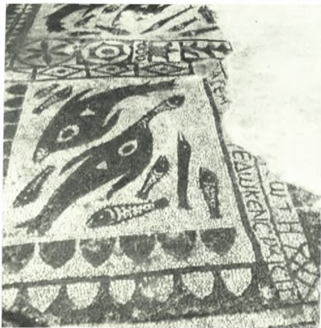
β. Ψηφιδωτὸν διάχωρον μετὰ παραστάσεως ἰχθύων καὶ ἐπιγραφῆς τῆς βασιλικῆς Ὀλοῦντος. Institutional Repository - Library & Information Centre - University of Thessaly 18/05/2024 05:11:57 EEST - 18.116.47.245