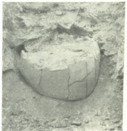
δ. Ταφή ἐντὸς πίθου.