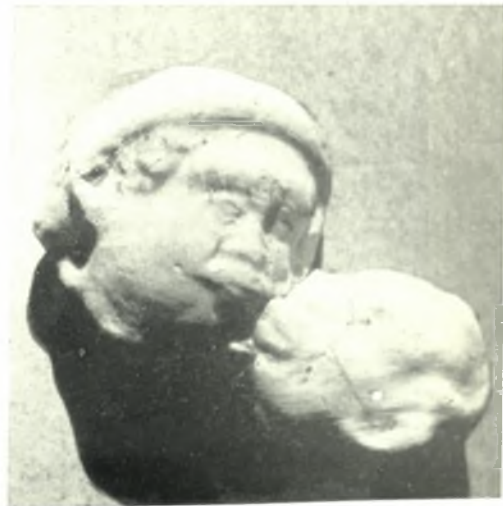
ε. Κεφαλαί πηλίνου συμπλέγματος.