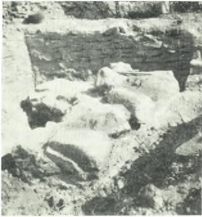
α. Ταφικόν κατασκευάσμα.