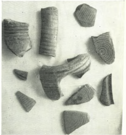
β. Ὀστρακα ἐκ τοῦ ταφικοῦ κατασκευάσματος (α).