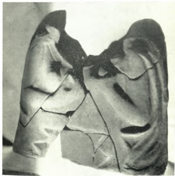
δ. Πηλίνη προτομή.