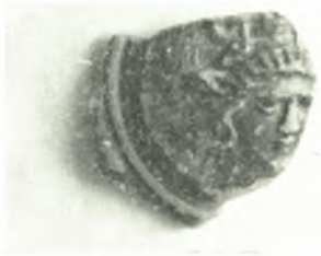
α. Κεφαλή πηλίνου ειδωλίου. β. Τμήμα μικκύλης άσπίδος.