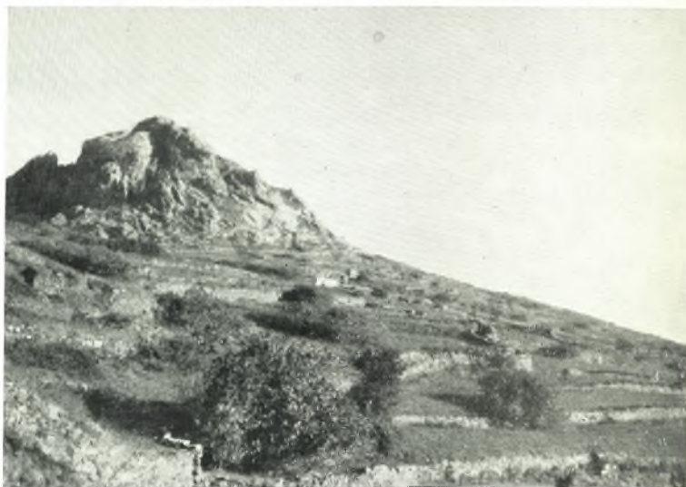
α. Ἡ περιοχή τῆς ἀρχαίας πόλεως.