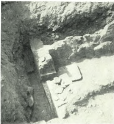
γ. Δωμάτιον οἰκίας.