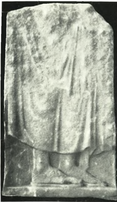
β. Τὸ κατώτερον μέρος ἐπιτύμβιου στήλης ἐκ τῆς περιοχῆς «Βαρδαλάκου».