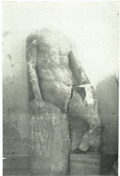
γ. Ἐπιτύμβιον ἀνάγλυφον ἐκ Κάμπου Τήνου.