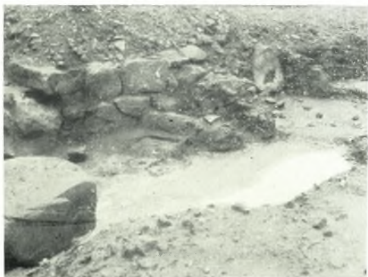
β. Τμήμα τοῦ τείχους (ΝΔ.) μὲ τοιχάρια καὶ ἑσχάραν πρὸ αὐτοῦ.