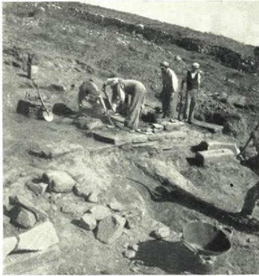
α. Ταφικὸν κτίσμα εἰς περιοχὴν «Βαρδαλάκου».