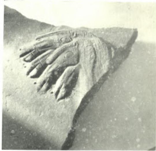
γ. Τεμάχιον άναγλύφου άμφορέως