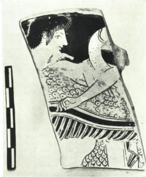
α. Ὅστρακον ἐξ ἐρυθρομόρφου κύλικος μετὰ παραστάσεως τοῦ Ἰακίνθου.