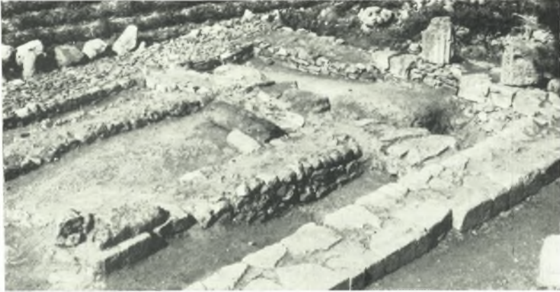
α. Γενική ἄποψις τοῦ ναοῦ τῆς Ἀρτέμιδος ἐκ ΝΑ.