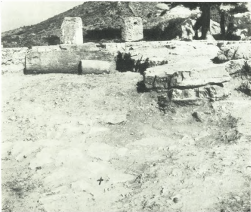
β. Πλακόστρωτον ἐκ παλαιότερου κτίσματος ἐντὸς τοῦ ναοῦ. Ἡ ἀκριβὴς θέσις σημειοῦται διὰ σταυροῦ.