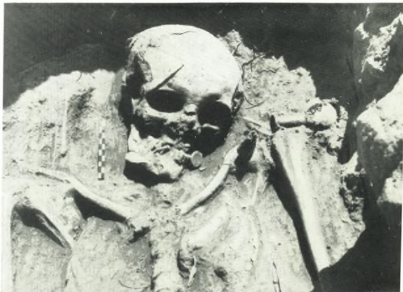
α. Τὸ ἄνω μέρος τοῦ σκελετοῦ ἐκ τάφου παρὰ τὴν ἱερὰν οἰκίαν. Παρὰ τὸ στόμα τοῦ νεκροῦ διακρίνεται ὁ ὀβολὸς τοῦ Χάρωνος.