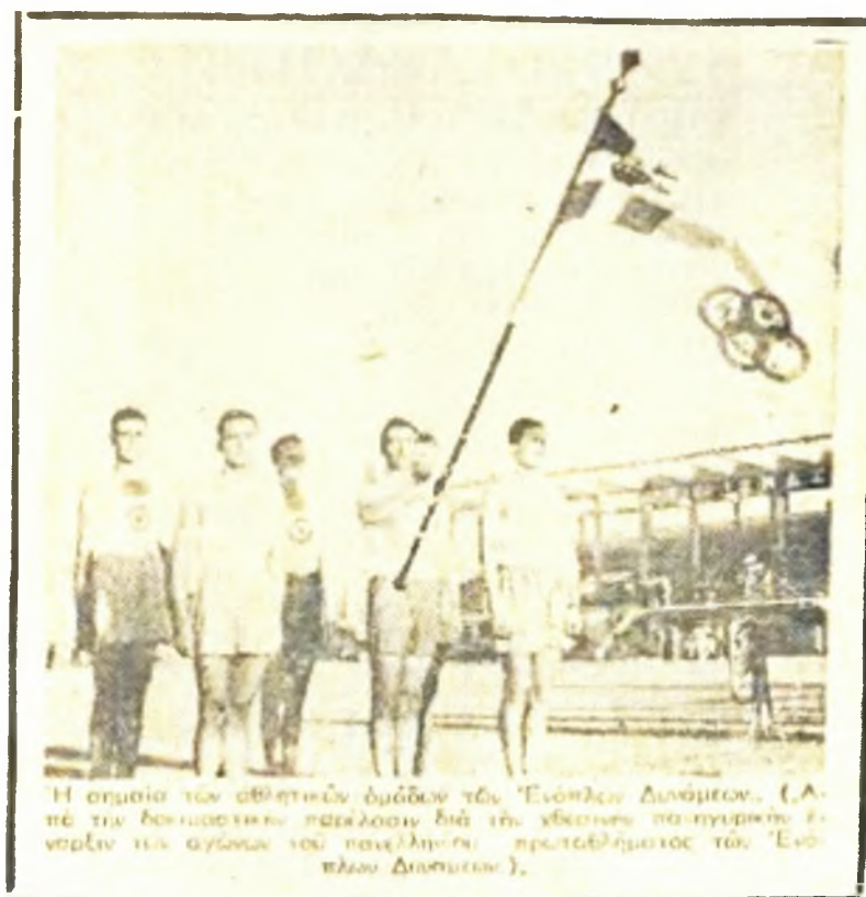
Εικόνα 3. «ΑΘΛΗΤΙΚΗ ΗΧΩ», 2 Αυγούστου 1948, Πρώτη εμφάνιση σημαίας Α.Σ.Ε.Α.Ε.Δ. στο Α΄ Πανελλήνιο Πρωτάθλημα Ενόπλων Δυνάμεων.