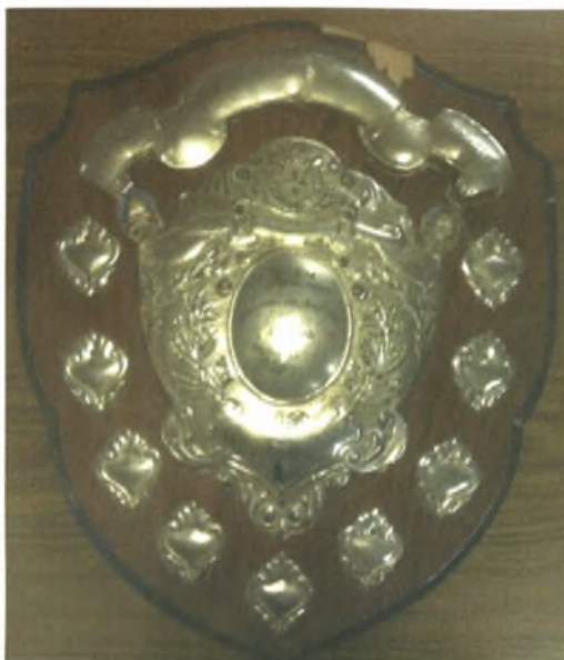
Εικόνα 17. Αναμνηστική πλακέτα από τον αγώνα ποδοσφαίρου στη Βαγδάτη μεταξύ Ε.Δ. Ελλάδας και Ε.Δ. Ιράκ. το 1962 για το πρωτάθλημα C.I.S.M.