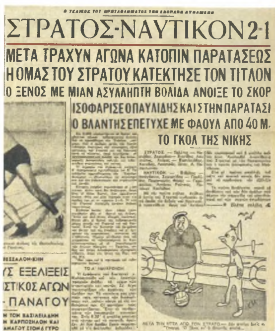
Εικόνα 5. «ΑΘΛΗΤΙΚΗ ΗΧΩ», 22 Αυγούστου 1949. Γελοιογραφία του Κώστα Μητρόπουλου εμπνευσμένη από το Πρωταθλήματος Ποδοσφαίρου Ε.Δ.