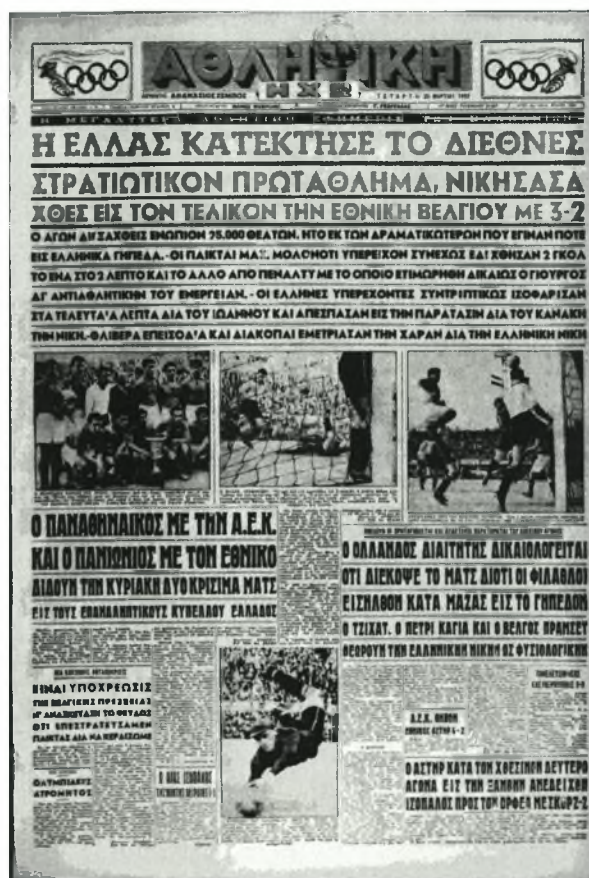
Εικόνα 10. «ΑΘΛΗΤΙΚΗ ΗΧΩ», 26 Μαρτίου 1952, Η κατάκτηση του πρωταθλήματος C.I.S.M. από την Εθνική Ε.Δ.