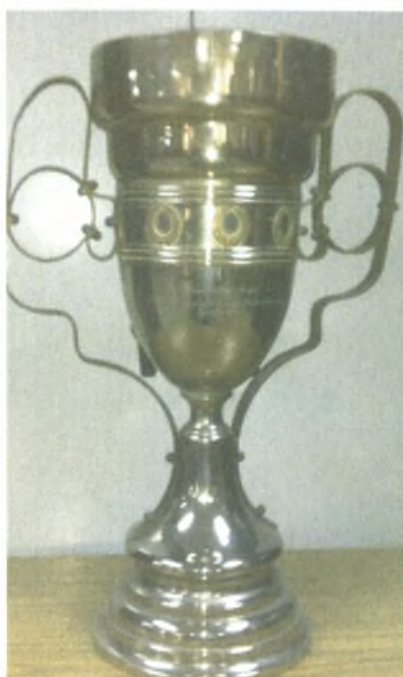
Εικόνα 15. Το τρόπαιο της πολυνίκους ομάδας της Α.Σ.Α.Ε.Δ. από το Στρατιωτικό Βαλκανικό Πρωτάθλημα Στίβου στα Σκόπια 3- 4 Σεπ 1955.