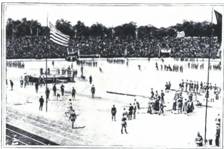
Demonstration of new equipment group games by American soldiers