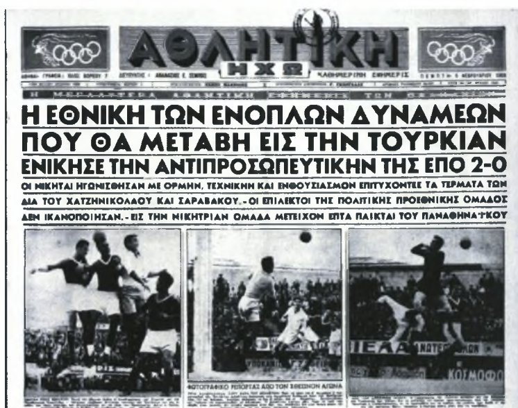
Εικόνα 11. «ΑΘΛΗΤΙΚΗ ΗΧΩ», 5 Φεβρουαρίου 1953. Πρωτοσέλιδο άρθρο φιλικού αγώνα της Εθνικής Ε.Δ.