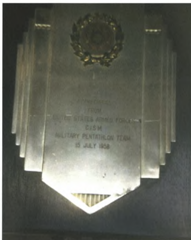
Εικόνα 16. Αναμνηστική Πλακέτα των Ε.Δ. των Η.Π.Α. προς την ομάδα Στρατιωτικού Πεντάθλου των ελληνικών Ε.Δ. 1958 (Πηγή: Α.Σ.Α.Ε.Δ.)