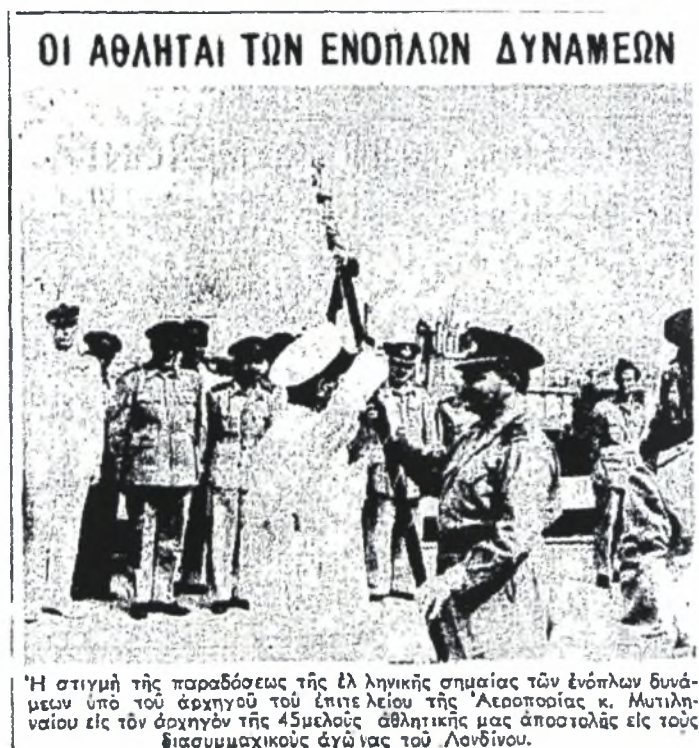
Εικόνα 2. «ΕΜΠΡΟΣ», 10 Σεπτεμβρίου 1947. Ο αρχηγός της ελληνικής αποστολής στους Διασυμμαχικούς Αγώνες του Λονδίνου του 1947, Σμηναγός Νικόλαος Γρηγοριάδης, παραλαμβάνει την σημαία των ελληνικών Ε.Δ.