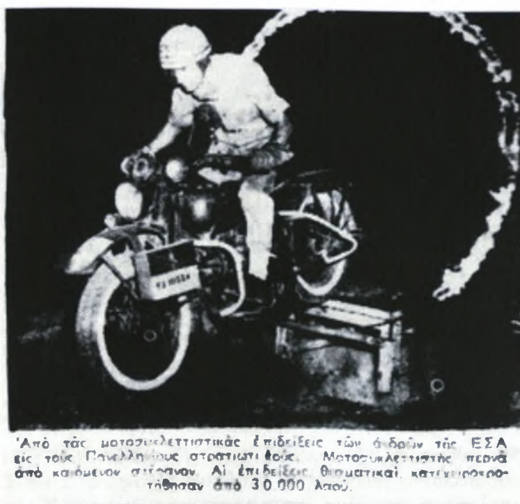
Εικόνα 7. «ΑΘΛΗΤΙΚΗ ΗΧΩ», 11 Ιουλίου 1950. Επίδειξη μοτοσυκλετιστῶν τῆς Ε.Σ.Α. ἐπ' ευκαιρίας τοῦ Γ' Πανελληνίου Πρωταθλήματος Ε.Δ.