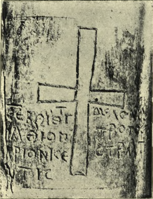
Εἰκ. 2. Ἡ ἐπὶ τοῦ κίονος ἐπιγραφὴ,

Κατὰ ταῦτα εἶναι ἀδύνατον νὰ γνωρίζωμεν, ἂν ἐπὶ τῆς θέσεως τῆς Μαρωνίνας ὑπῆρχεν ἄλλη παλαιότερα βυζαντινὴ ἐκκλησία ἢ ἂν, ὅπερ τὸ πιθανώτερον, ὁ κίων μετεφέρθη ἄλλοθεν ἐκεῖ κατὰ τὴν οἰκοδομὴν τῆς. Καὶ ἤδη ἔλθωμεν εἰς τὴν ἐπὶ τούτου ἐπιγραφὴν (εἰκ. 2).