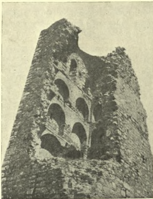
Εἰκ. 2. Ἀποψις τοῦ ἐσωτερικοῦ τῶν ὀρόφων τοῦ πύργου.

Ἐκαστος ὄροφος διαιρεῖται εἰς δύο ἄνισα τμήματα: ἓν στενὸν κατὰ μῆκος τῆς νοτίας παρεῖας τοῦ πύργου καὶ ἓν τετράγωνον. (εἰκ. 3). Τὸ στενὸν ἐχρησίμευεν ὡς προθάλαμος καὶ ὡς κλιμακοστάσιον τῆς κατὰ τὴν ΝΑ γωνίαν ἐκτισμένης ἑλικοειδοῦς κλίμακος 1 , δι' ἧς ἐπεκοινώνουν πρὸς ἀλλήλους οἱ ὄροφοι. Τὸ ὑπόλοιπον τετράγωνον ἦτο ὁ θάλαμος, ὅστις κάτω ἐχρησίμευεν ὡς ἀπο-