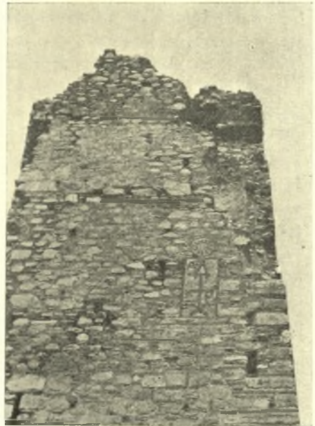
Εἰκ. 4. Ἡ φέρουσα τὸ πλίνθινον συμπίλημα πλευρὰ τοῦ πύργου.