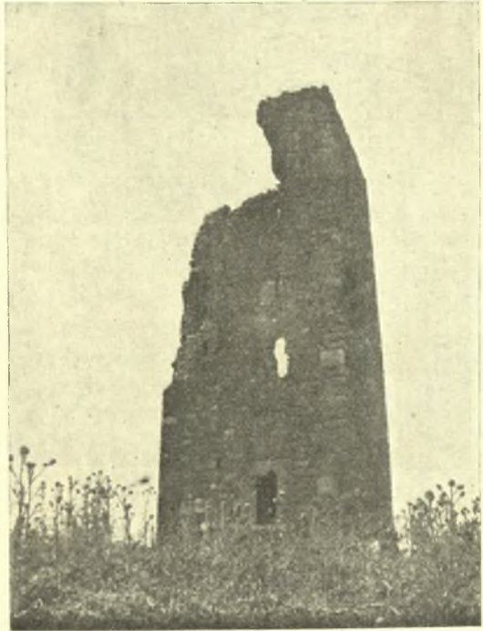
Εἰκ. 1. Ἡ πρόσοψις τοῦ πύργου.

Ἐν τῷ πύργῳ ἔχει ἐν κατόψει σχῆμα ὀρθογώνιον (εἰκ. 3), περιελάμβανε δ' ἐσωτερικῶς ὀρόφους χωριζομένους διὰ ξυλίνων πατωμάτων, ὧν σήμερον σώζονται μόνον τὰ ἐντετειχισμένα ἄκρα τῶν ξυλίνων δοκῶν (εἰκ. 2). Ἡ εἴσοδος εὐρίσκεται ἐπὶ τῆς νοτίας πλευρᾶς τοῦ κτηρίου καὶ εἰς ἱκανὸν ὕψος ἀπὸ τοῦ ἐδάφους, ἦτο δὲ προσιτὴ διὰ κινητῆς ξυλίνης κλίμακος. Μεγάλοι λίθοι εἰλημμένοι προφανῶς ἐξ ἀρχαίων κτηρίων, σχηματίζουσι τὸ πλαίσιον αὐτῆς. Ὑπεράνω τοῦ ἀνοίγματος τῆς εἰσόδου ὑπάρχει ὀρθογώνιος βάθυσσις μετὰ πλινθίνου τοξωτοῦ ὑπερθύρου, ἣτις πιθανώτατα προωρίζετο νὰ φέρῃ τὴν εἰκόνα τοῦ προστάτου ἁγίου τοῦ