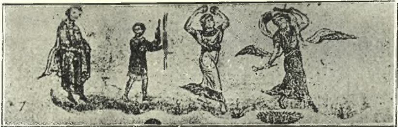
Εἰκ. 8. Χορεύτριαὶ κατὰ γαμήλιον πομπήν. Ἐκ τοῦ χ. τοῦ Ὀππιανοῦ Γ. ἢ ΙΑ'. αἰῶνος. (S c h l u m b e r g e r, Basile II le tueur de Bulgares σ. 149).

Ὅχι μόνον δ' ἐκίνουν τοὺς πόδας οἱ χορευταὶ 8 , ἀλλὰ καὶ πολλάκις ἀναπηδῶντες ἐκτύπον δι' αὐτῶν τὸ ἔδαφος. Τοιαύτας κινήσεις χαρακτη-