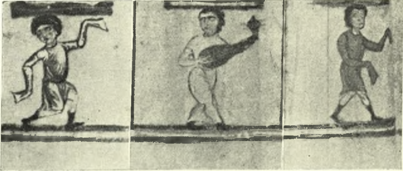
Εἰκ. 14. Χορευταὶ μαζρὰς φέροντας χειρίδας και μουσικὸς. Ἐκ χ. Εὐαγγελίου 450 (φ. 3β) τῆς ἐν Βενετίᾳ Μαρκιανῆς βιβλιοθήκης. (Α. Ξυγγοπούλου, Σαλώμη, Ἐπειτ. Ἐταιρ. Βυζ. Σπουδ. 1Β'. 272).

Περὶ τοῦ κατὰ τὸν χορὸν ψόφου τοῦ κυμβάλου ὁμίλησεν ὁ Λουκία-