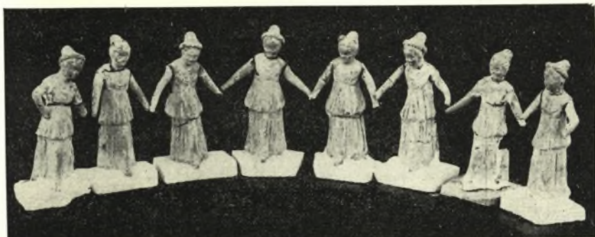
Εἰκ. 2. Τὰ ἐν τῇ τάφῳ τῆς Δημητριάδος εὑρεθέντα εἰδώλια τὰ παριστῶντα συρτὸν χορόν.

Ἐντῶς τὸ πρῶτον, ὅπερ κάμνουσιν οἱ τὸν συρτὸν χορεύοντες εἶναι νὰ λάβωσιν ἀπὸ τῶν δακτύλων τὰς χεῖρας ἀλλήλων. Τὸ σχῆμα βεβαίως