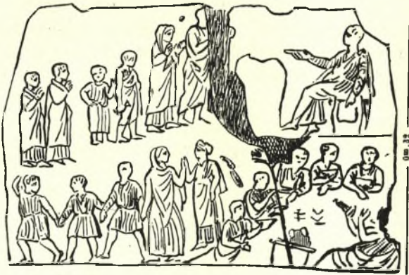
Εἰκ. 1. Κύκλιος χορὸς ἐπὶ Κυπριακῆς ἀναθηματικῆς εἰκόνας τοῦ Α'. π. Χ. αἰῶνος.

νος 1 . Ὄντως, ἄν καὶ στερούμεθα παλαιότερας τοῦ ὀνόματος μνείας, ἔχομεν ἐν τούτοις παραστάσεις τοῦ χοροῦ αὐτοῦ, αἵτινες παλαιότερον αὐτὸν πιστοποιοῦσιν. Ἡ ὑπ' ἀριθμ. 1 παρατιθεμένη εἰκὼν ἢ σαφῶς δεικνύουσα χορευόντας συρτόν, ἐλήφθη ἐξ ἀναθηματικῆς εἰκόνας τῆς Α'. π. Χ. ἑκατονταετηρίδος, ἐν Κύπρῳ εὐρεθείσης 2 καὶ ἡ ὑπ' ἀριθ. 2, ἡ ὁποία ἐπ' ἴσης συρτόν χορὸν παριστᾷ συνεκροτήθη ἐξ εἰδωλίων εὐρεθέντων ἐν τάφῳ τῆς Δημητριάδος κατὰ τὰς ἀνασκαφὰς τοῦ συναδέλφου κ. Ἀρβανιτοπούλου καὶ ἀποκειμένων νῦν ἐν τῷ ἀρχαιολογικῷ μουσεῖῳ τοῦ Βόλου. Ἐν μεταγενεστέροις χρόνοις (περὶ τὸ 390) παρᾶστασιν ἐπ' ἴσης τοῦ χοροῦ τούτου, ὅστις σήμερον εἶναι πάγκοινος, εὐρίσκομεν εἰς τὴν βάσιν τοῦ ὀβελί-