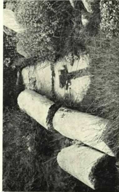
Εύβοια: α. Χαλκίς. Ή στέγη τοῦ μεσαιῶν κλίτους τῆς Ἁγ. Παρασκευῆς, β. Πισσῶνας. Ψηφιδωτὸν δάπεδον, γ. Πισσῶνας. Ὁ πύργος τοῦ Μόστρα, δ. Βατώντας. Ἐρείπια τῆς παλαιοχριστιανικῆς βασιλικῆς τῆς Ἁγ. Παρασκευῆς