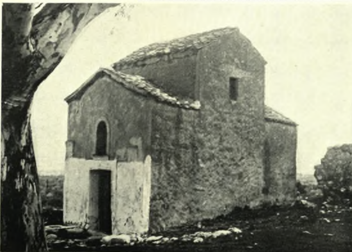
Εύβοια. Βάθεια: α. Ὁ ναὸς τῆς Παναγίτσας ἀπὸ ΝΔ., β. Παλαιοχριστιανικὸν κιονόκρανον, γ. Ὁ σταυρεπίστεγος ναὸς τῆς Μεταμορφώσεως εἰς θέσιν Παλαιοχώρια, δ. Ὁ σταυρεπίστεγος ναὸς τῆς Κοιμήσεως τῆς Θεοτόκου εἰς θέσιν Παλαιοχώρια