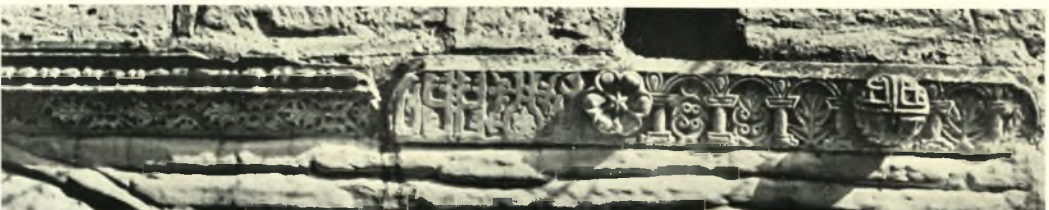
Εύβοια. Πολιτικά: α. Πύργος, β. Ό ναός της Περιβλέπτου, γ. Ναός Περιβλέπτου. Έντοιχισμένα γλυπτά