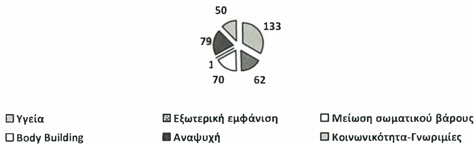
Σχήμα 2. Σημαντικότεροι λόγοι άσκησης.

Όπως φαίνεται και από τον πίνακα παραπάνω ο σημαντικότερος λόγος που οι Δημότες συμμετέχουν σε προγράμματα άσκησης είναι η διατήρηση και η βελτίωση της υγείας (N=133, 70%), η αναψυχή (N=79, 41,6%) και ακολουθεί η μείωση του σωματικού βάρους (N=70, 36.8%). Να αναφερθεί ότι κανένας από τους συμμετέχοντες δεν ασκείται για λόγους σωματικής και μυϊκής διάπλασης. Σημειώθηκε μόνο μία απάντηση από όλο το δείγμα, η οποία να οφείλεται πιθανώς σε λανθασμένη κατανόηση της ερώτησης.