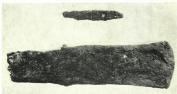
Νέα Ἀγχιάλος: α. Ὀστρακα γεωμετρικά, β. Τμήμα πρωτογεωμετρικοῦ ἀμφορέως, γ. Σκεῦος χαλκουργικοῦ ἐργαστηρίου, δ. Σιδηροῦς μονόστομος πέλεκυς καὶ σιδηρᾶ αἰχμή