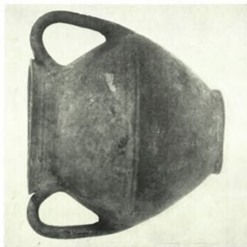
Νέα Ἀγχιάλος: α, δ, ε, ζ'. Κεραμεικὴ μακεδονικὴ πρωΐμου ἐποχῆς σιδήρου, β - γ. Γεωμετρικὰ ἀγγεία