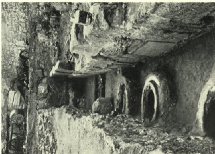
Εύβοια. Χαλκίς: α. Τὰ τείχη Α και Β και τὰ στόμια τῶν πύθων εἰς τὸ μεταξὺ τῶν κενόν, β. Ἀρχαῖον φάνωμα χρησιμοποτηθὲν ὡς οἰκοδομικὸν ὑλικὸν εἰς τὸ τείχος Α