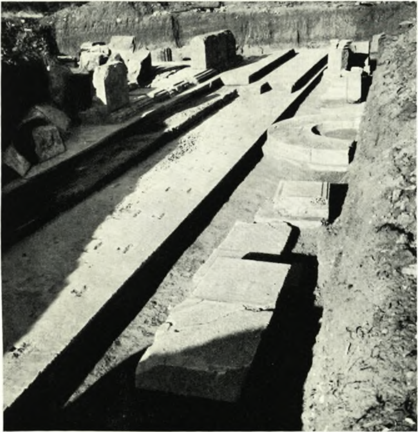
Ἀποψις τῆς κρηπίδος τοῦ ναοῦ μετὰ τοῦ ἀναστηλωθέντος κυματοφόρου τοιχοβάτου καὶ τῶν ἐπ' αὐτοῦ ὀρθοστατῶν τοῦ σηκοῦ.