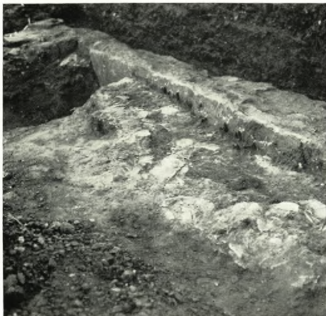
α. Τὰ καταπεσόντα ἐπὶ τοῦ δαπέδου κονιάματα τοῦ ἐν πίνακι 92α κτίσματος.