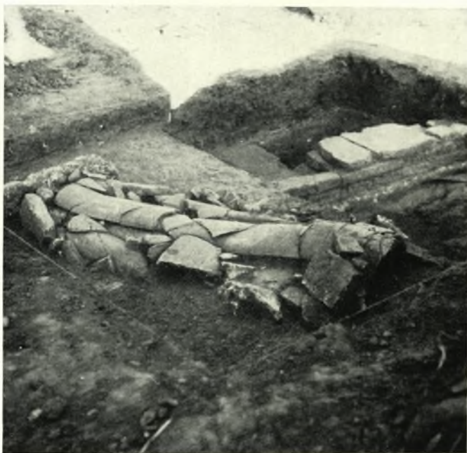
α. Κεραμοσκεπής τάφος υπεράνω του ἐν πίνακι 93β ὕδαταγωγού.