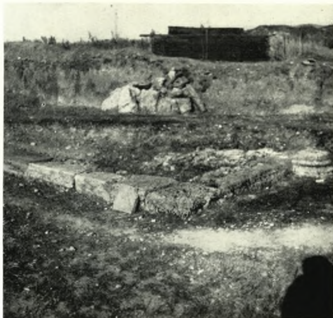
α. Τμήμα του ὀρθογωνίου πρὸ τῆς δυτικῆς παρόδου τοῦ θεάτρου τῆς Ἡλίδος κτίσματος.