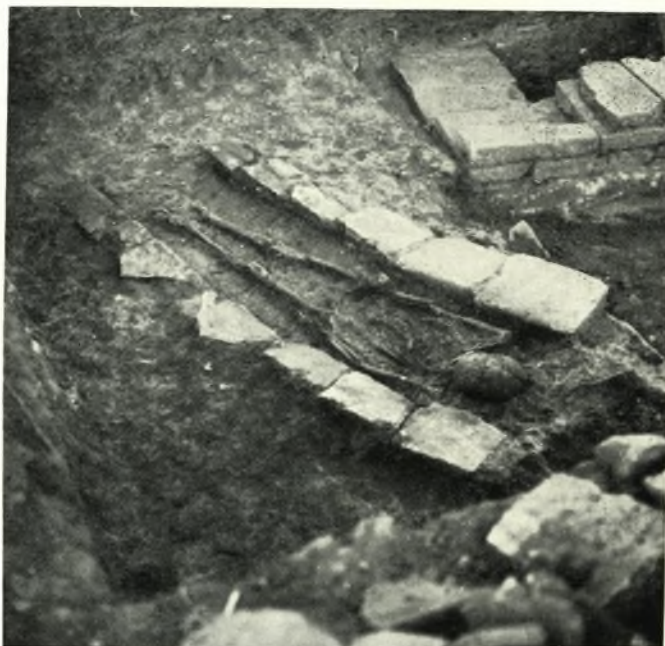
β. Ὁ ἐν πίνακι 93α τάφος μετὰ τὴν ἀποκάλυψιν αὐτοῦ.