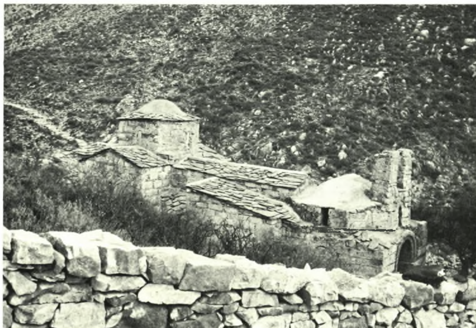
Μάνη : α - β. "Αη - Στράτηγος "Ανω Μπουλαριών πρό και μετά τας έργασίας