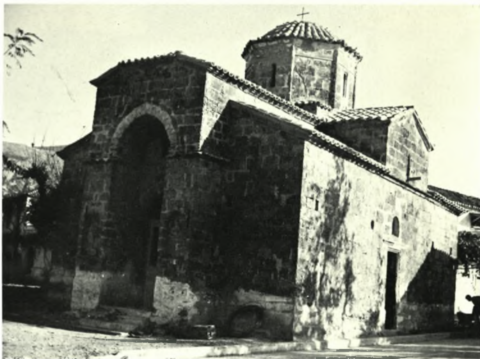
Μάνη : α - β. "Άγιοι Θεόδωροι Κάμπου Άβιας πρὸ και μετὰ τὰς ἐργασίας