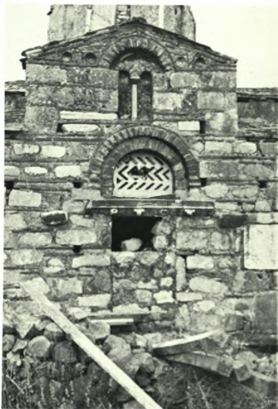
Μάνη. Ἅγιος Ἰωάννης Κέριας : α - β. Λεπτομέρειαι μετὰ τὰς ἐργασίας