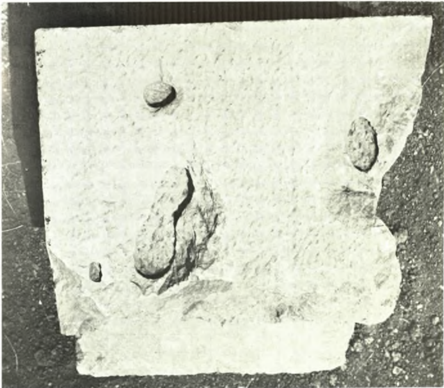
α. Έπιγραφή βάθρου τιμητικού άνδριάντος τής πόλεως Δελφών εν Έρετρία. β. Ή άνω όψις του βάθρου