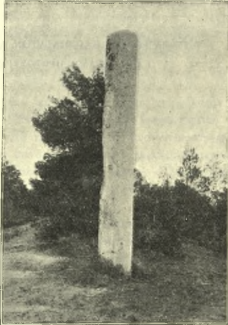
Εἰκ. 1. Τὸ κίονιον τοῦ Νεοφύτου.

Παρά την ὁδὸν τῶν Μεσογείων καὶ εἰς ὃ σημεῖον ἄλλοτε διεσταυροῦτο αὕτη πρὸς δρομίσκον κατερχόμενον ἐκ τῆς κατὰ τὸ βόρειον ἄκρον τοῦ Ὑμητ-