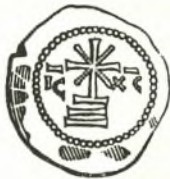
Νόμισμα Ἀλεξ. Κομνηνοῦ.