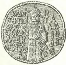
Σφραγὶς Κωνστ. Παλαιολόγου.

Ἄλλως ἔχει τὸ ζήτημα διὰ τοὺς μετέπειτα Παλαιολόγους, τοὺς εἰς Ἰταλίαν δῆλα δὴ μετοικήσαντας εὐθὺς ἀμέσως μετὰ τὴν ἄλωσιν. Οὕτως εἰς τὴν σφραγίδα Ἀνδρέου τοῦ Παλαιολόγου, υἱοῦ τοῦ Δεσπότη Θωμᾶ, ἐν ἀντιθέσει πρὸς τὰς σφραγίδας τῶν θειῶν του, τοῦ τελευταίου αὐτοκράτορος Κωνσταντίνου καὶ τοῦ Δημητρίου Παλαιολόγου, Δεσπότη τοῦ Μυστραῖ, ἔξ ὧν ἡ μὲν πρώτη αὐτὸν τοῦτον τὸν μεγαλομάρτυρα αὐτοκράτορα ἀπεικονίζει μὲ σχετικὴν ἐπιγραφὴν, ἡ δ' ἑτέρα ἐν μέσῳ ἔχει τὸν δικέφαλον αἰετὸν καὶ κύκλω σχετικὴν ἐπιγραφὴν ὡς ἐκ τῶν ἀναδημοσιευομένων ἐνταῦθα ἀπεικονίσεων ἐμφαίνεται 2 εἰς