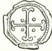
Νόμισμα Ἀνδρῶν Β' Παλαιολόγου.