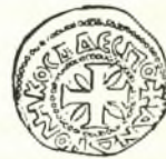
Νόμισμα Ἀνδρονίκου Β'.