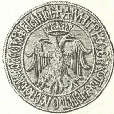
Σφραγὶς Δημ. Παλαιολόγου.

τὴν σφραγίδα, λέγω, τοῦ Ἀνδρέου Παλαιολόγου, ἐν ἀντιθέσει πρὸς τὰς ὡς ἄνω σφραγίδας, ὁ δικέφαλος αἰετὸς εὐρίσκεται ἐντὸς θυρεοῦ, καθ' ὅλους τοὺς ἐραλδικοὺς κανόνας, μὲ τὸ βασιλικὸν (Δεσποτικὸν) στέμμα εἰς τὴν ἀρμόζουσαν θέσιν. 3