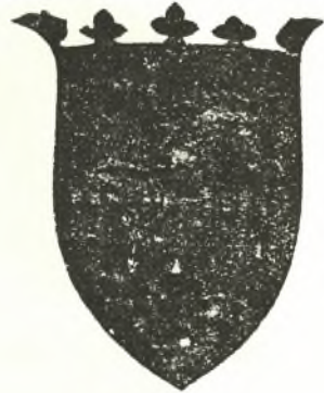
Θυρεὸς τοῦ Ἰακώβου de Morellis.