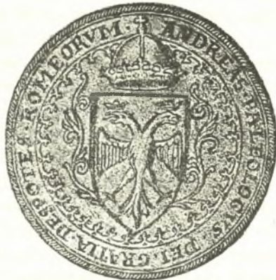
Σφραγὶς Ἀνδρέου Παλαιολόγου.

Μετὰ τὸν Vulson, πολὺ βραδύτερον, κατὰ τὰ ἔτη 1844 καὶ 1846 ὁ σοφὸς