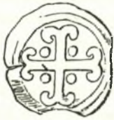
Νόμισμα Ἀνδρ. Κορνηνοῦ.

Ὡς πρὸς τὸ τρίτον τέλος ἐπιχείρημα τοῦ Λάμπρου, τοῦ οἰκοσήμου δῆλα δὴ τῶν Ἀτσαϊῶλων, παρατηρῶ ὅτι εἶναι ἐντελῶς σφαιραρὰ ἡ γνώμη αὐτῆ τοῦ Ἀθηναίου νομισματολόγου. Εἶναι γνωστὸν πᾶσι τοῖς περὶ τὰ Ἑραλδικὰ