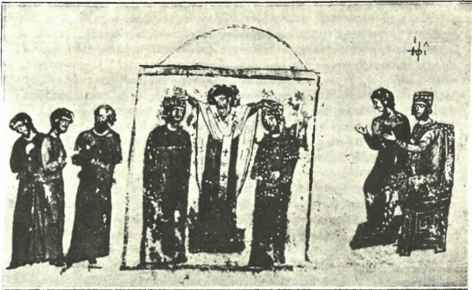
Εικ. 5. Ὁ Πατριάρχης πρὸ τοῦ ἱεροῦ βήματος τελεῖ τὸ στεφάνωμα.