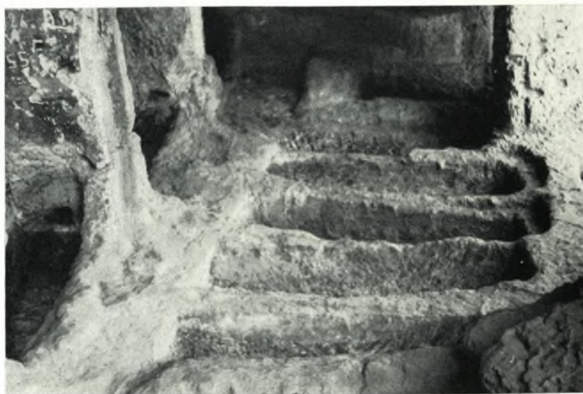
β. Λαζκοειδεῖς τάφοι ἐντὸς τοῦ διαγματοειδοῦς διαδρόμου (ἀπὸ Ν.)