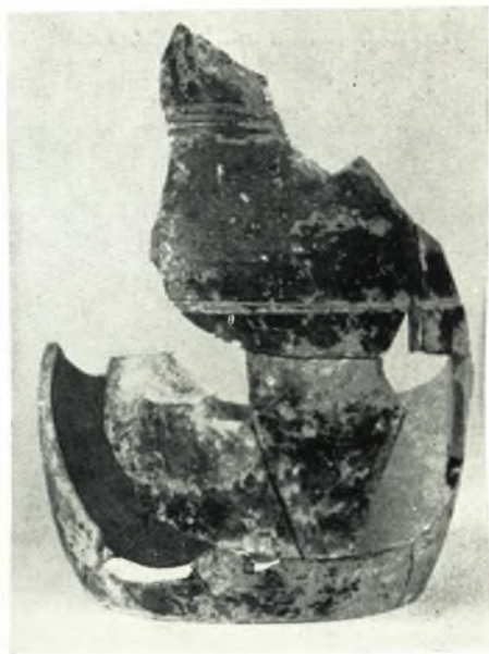
β. Προχοῖδες ἐφραλομέναι.