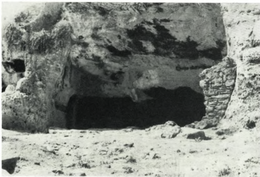
β. Τοιχοποιία βυζαντινῶν χρόνων (δεξιὰ) ἔμπροσθεν τοῦ σπηλαιώδους κοιλώματος.