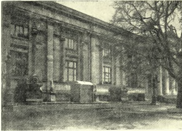
Εἰκ. 5. Βασιλικαὶ σαρκοφάγοι πρὸ τοῦ ἀρχαιολογικοῦ μουσείου Κων πόλεως. (J. Ebersolt, Mission archéologique de Constantinople pl. XII.)