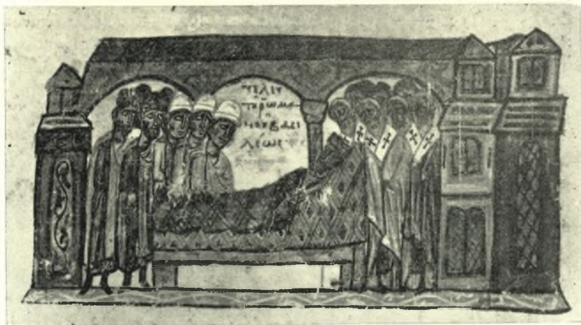
Εἰκ. 3. Ρωμαῖος ὁ Β' ἐπὶ τῆς νεκρικῆς του κλίνης. Ἐκ τοῦ χειρογράφου τοῦ Σκυλλίτου. (Hautes études).

ναῖκες ἐξέλυον 1 καὶ τὰς παρειὰς διὰ τῶν ὀνύχων ἤμυσσον 2 καὶ ἐπὶ τοῦ ἐδάφους ἐρρίπτοντο ἢ ἐκάθηντο 3 πενθικὴν φοροῦντες στολὴν καὶ συνεχῶς τὸν ἀποθανόντα ἀνακαλοῦμενοι 4 .