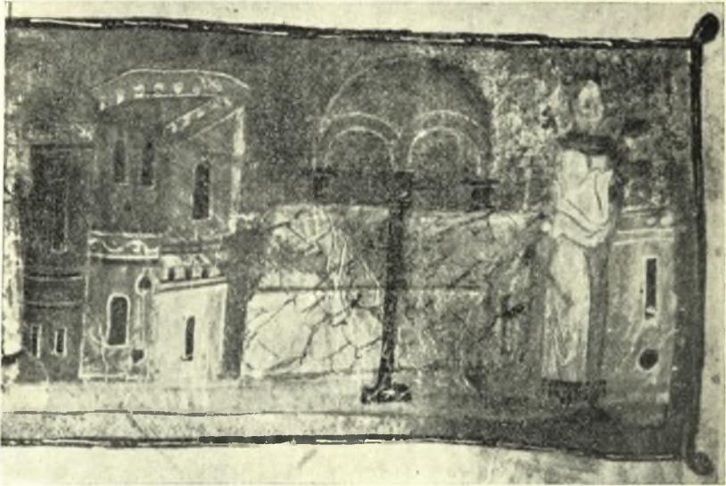
Εἰκ. 8. Βασιλικὸς τάφος μετὰ κιβωρίου.

σιλείς και στρατηγοί και δυνάσται... τάφους λαμπρούς ᾠκοδόμησαν 1 ». Δὲν ὑπάρχει δ' ὄντως ἀμφιβολία ὅτι θὰ ἦσαν πολυτελεῶς κεκοσμημένοι οἱ τάφοι τῶν Βυζαντινῶν βασιλέων τῶν πανταχοῦ τὴν πολυτέλειαν ἐπιδιωκόντων· σχετικαὶ πράγματι πληροφοροῖα ὑπάρχουσιν. Οὕτως, ὅταν