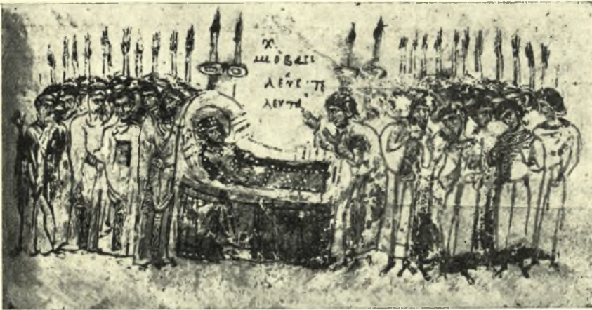
Εἰκ. 4. Ἡ πρόθεσις Μιχαὴλ τοῦ Β'.

Κατὰ τὸν Ψευδευσέβιον, περὶ τὸ σκίνωμα τοῦ ἐν τῇ αἰθούσῃ τῶν ιθ'. ἀκκουβίτων τοποθετηθέντος Μ. Κωνσταντίνου ἦναπτον φῶτα ἐπὶ χρυσοῦν σκευῶν θαυμαστὸν παρέχοντα θέαμα 4 , κατ' ἄλλας δὲ μαρτυρίας περὶ τὴν νεκρικὴν βασιλικὴν κλίνην ἐγένετο πάννουχος δαδουχία, ἦτοι πάννουχον ἄναμμα λαμπάδων συνοδευόμενον ὑπὸ ὄλονυκτίου ὕμνωδίας τῶν κληρικῶν 5 . (Εἰκ. 4.)