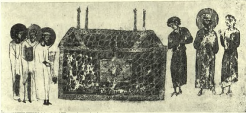
Εἰκ. 9. Ἡ λάρναξ Μαρίας, θυγατρὸς τοῦ Θεοφίλου.

Πλὴν δὲ τῶν πολυτίμων μεταλλίνων κοσμημάτων, ὑπῆρχον καὶ διάφοροι ἐπὶ τοῦ καλύμματος καὶ τῶν πλευρῶν τῶν λαρνάκων παραστάσεις,