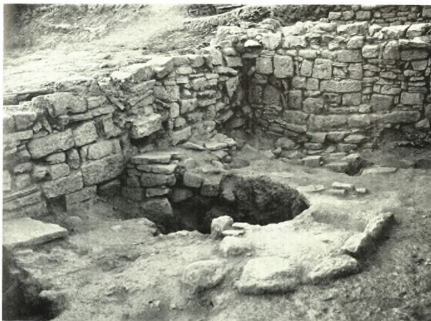
Scavi di Festos: a. Vani LXXV - LXXVI. Veduta generale da Sud-Est, b. Vano AA. Interno da Sud: la buca, un vasetto in situ presso il muro Orest