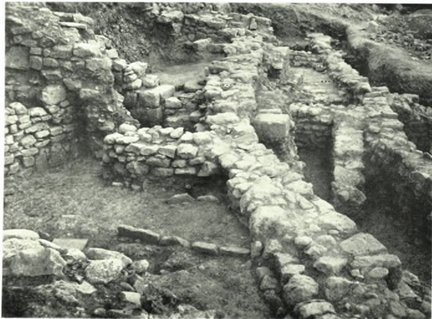
Scavi di Festos: a. Villaggio geometrico, b. Xalara Nord. Veduta da SO. In primo piano il vano A