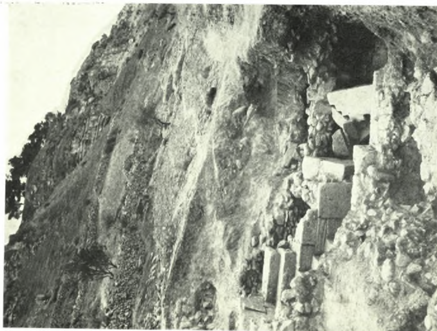
Xalara Sud: Veduta generale del scavo, b. La gradinata