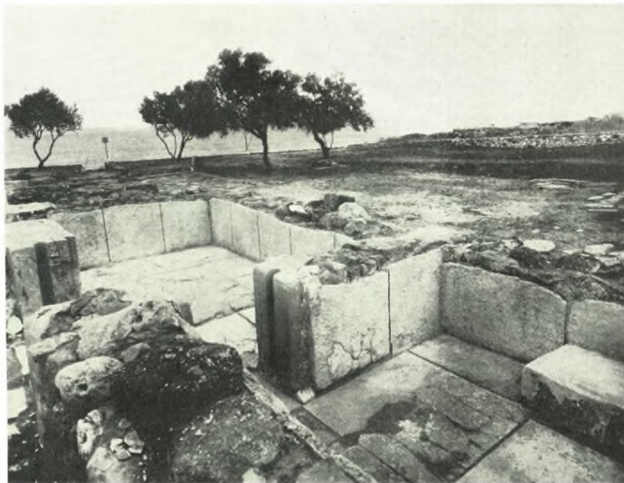
α-β. Ἀποκατάστασις Νίρου (1960)