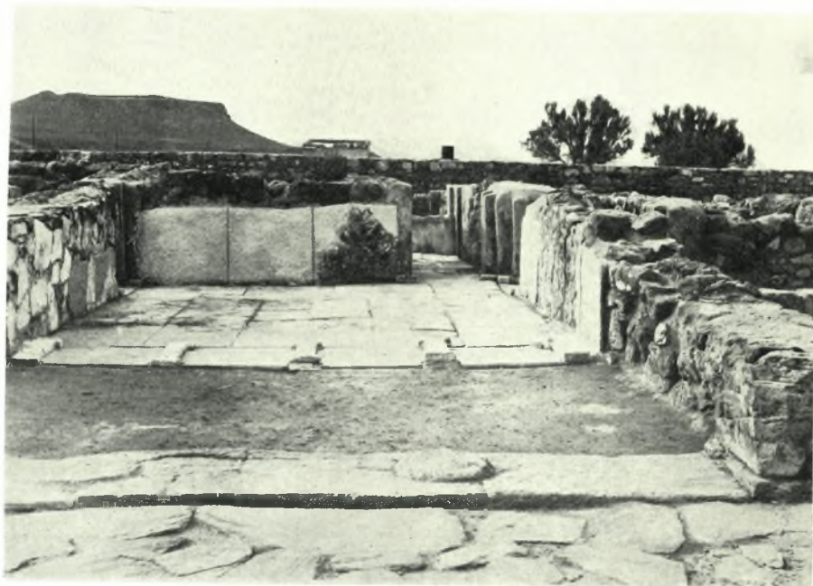
α-β. Ἀποκατάστασις Νίρου (1960)