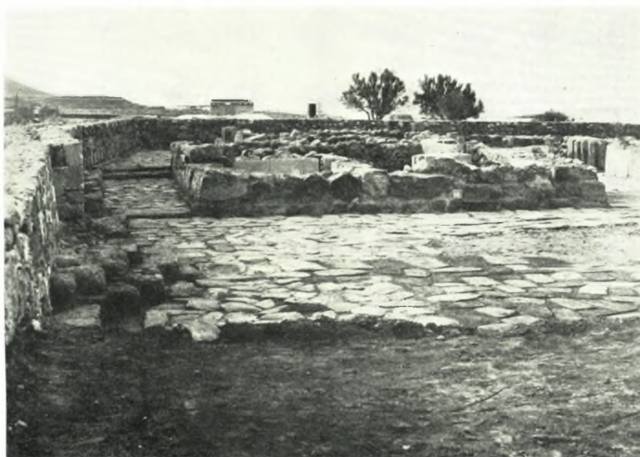
α. Ἐποκατάστασις Κνωσοῦ (1960), β. Ἐποκατάστασις Νέρου (1960)