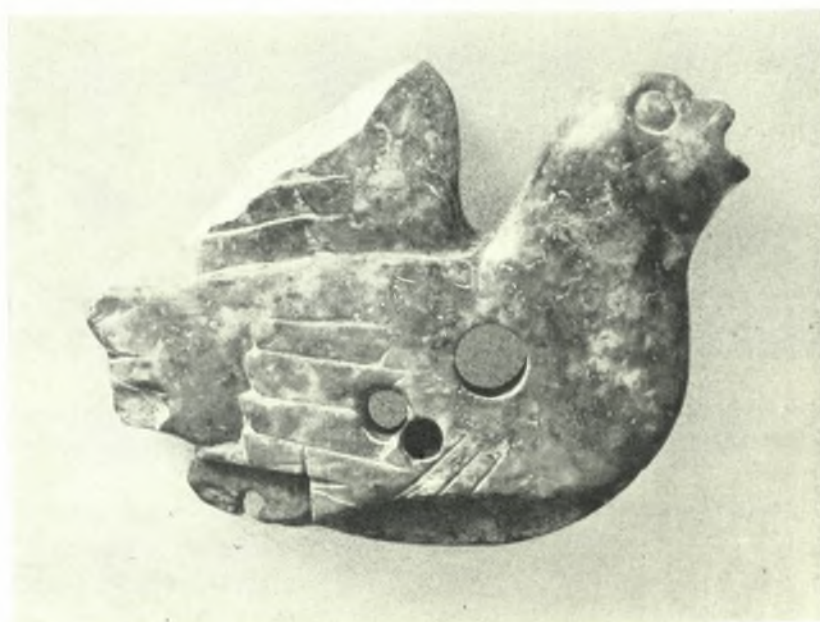
Excavations at Knossos: a. Debris of ivory worker's shop. Late Minoan II, b. Ivory in the form of a bird (dove?)