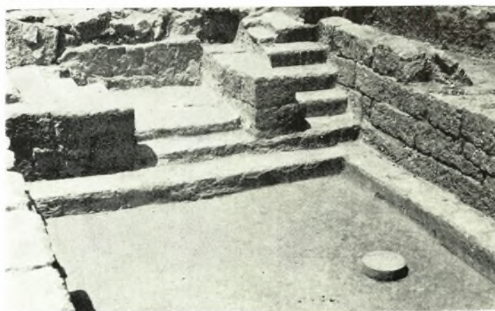
α-σ. Fouilles Françaises a Mallia