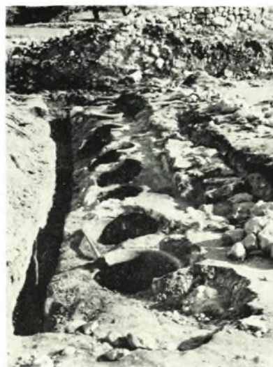
α-β. Προτομή Δήμητρος - Ίσιδος και ἀγαλμάτιον Ἀφροδίτης ἐξ Ἀγίας Γαλήνης, γ. Οἱ τάφοι Ι και ΙΒ εἰς θέσιν Παπούρα Λεβήνος, δ. Ρωμ. πίθοι ἐκ Πέρι