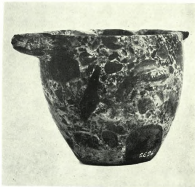
α. Προανακτορική κεραμική εκ τού τάφου Η εις θέσιν Γεροκάμπου Λεβήνος, β. Λίθινον ΠΜ άγγείον εκ Λιθινών Σητείας