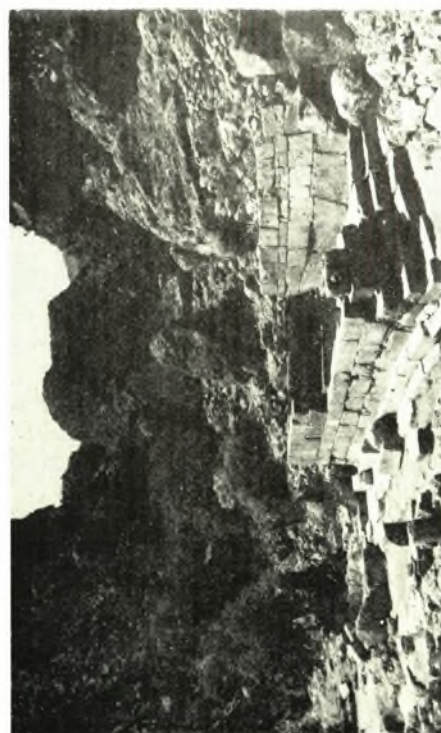
α. ΥΜ ΙΙΙ νεκροταφείον Μάσ, αλή Χανίων. Αί κόγχαι Α, Β, Γ του τάφου 2 (έλλημιστικόν), β-γ. Ανά- σκαφαι Άσκληρηπιού Λισού: Λουτήρ καθιστός, δ νάος του Άσκληρηπιού έκ ΝΑ, δ. Α. πλευρά νάου Άσκληρηπιού και είσοδος προς την πηγήν του ύδατος