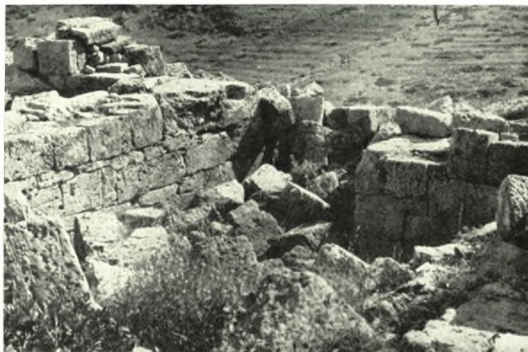
α. Πήλινον πλακίδιον μετὰ παραστάσεως Ἀπόλλωνος κιθαρωδοῦ ἐκ τοῦ σπηλαίου Ἀρκούδας Ἀκρωτηρίου Χανίων, β. Χαλκοῦν εἰδώλιον Ἡρακλέους (Μουσεῖον Χανίων), γ. Χαλκῆ ἐκ Βρυσῶν Κυδωνίας, δ. ΥΜ ΙΙΙ β τάφος Σταυρωμένου Ρεθύμνης, ε. Διπλοῦς νῶς εἰς Μ. Καστρί Φαλασσάρνης ΣΤΥΛ. ΑΛΕΞΙΟΥ