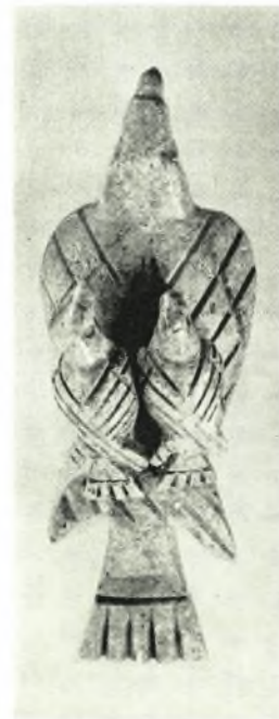
Excavations at Knossos: a. Child burial, b. Stone covering pit in bedrock with child burial below, c. Terrace wall (B) from West, with earlier terrace wall (A) behind, to right of man, d. Ivory in the form of a bird