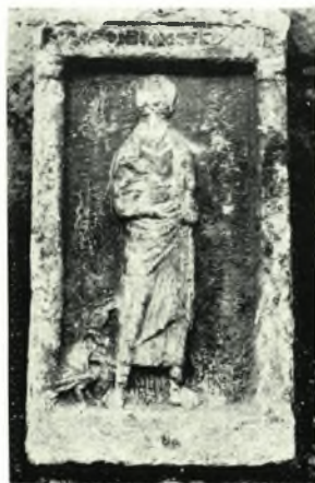
α. Λεβητοειδές κιονόκρανον πρό ναΐσκου Ἁγ. Μηνᾶ ( Λαμία ), β. Τοιχογραφία ναΐσκου Προφ. Ἡλία ( Ἄνω Τιθορέα - Βελίτσα ), γ - ε. Ἐπιγραφή Ἁγ. Ἀθανασίου, κιονόκρανον ἐκ τοῦ Ἁγ. Ἀθανασίου καὶ ἄνω τμήμα μαρμ. στήλης, ζ-ζ. Μαρμ. στήλαι ἐκ τῶν ἐρείπιων τοῦ Ἀββᾶ Ζωσιμᾶ ( Ἄνω Τιθορέα-Βελίτσα )