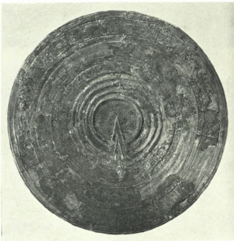
Μουσείον Δελφῶν: α. Πηλίνη προτομή γυναικός, ἐκ τοῦ ἀποθέτου εἰς τὴν αὐλὴν τοῦ Μουσείου, β. Χαλκίνη ἀσπίς