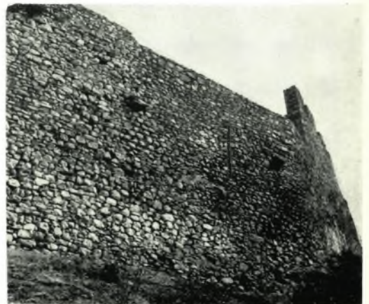
α. Γλυπτά πρό τοῦ ναοῦ τῆς Ἀγ. Δεσποίνης ( Λαμία ), β. Ἐπιγραφή Ἀθηνᾶς Ἰλιάδος ( Ἀχινός ), γ. Τμῆμα παλαιοχρ. θωρακίου χρησιμοποιηθὲν ὡς οἰκοδ. ὑλικόν εἰς μεταγενεστέρας προσθήκας, δ. Ν. πλευρὰ τείχους Φρουρίου πρό καὶ μετὰ τὴν ἀποκατάστασιν ( Λαμία )