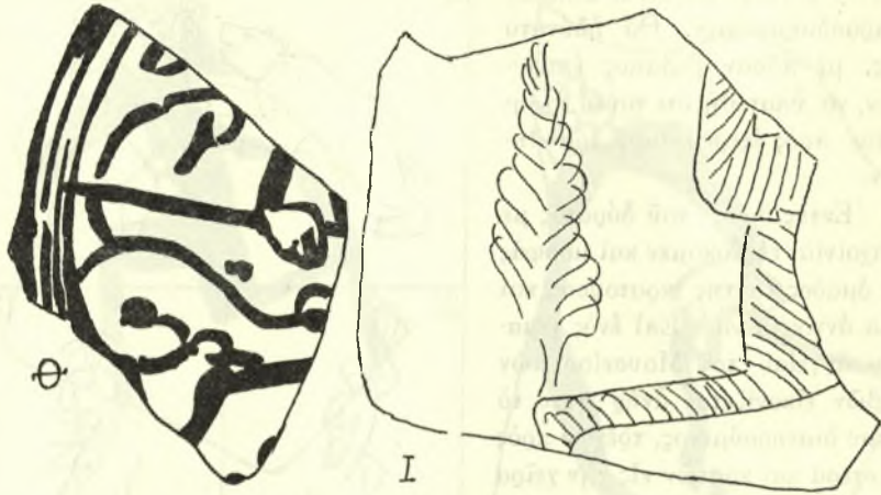
Εἰκ. 4. Θ Μουσείον Θηβῶν. Ι Μουσείον κοσμητικῶν τεχνῶν Ἀθηνῶν (ἐκ Θηβῶν).

Τὴν ἐρμηνείαν τοῦ σχοινίου εἰς τὰ ὑπατικά δίπτυχα ἔδωκεν ἤδη ὁ Delbrück, ἀποδείξας ὅτι τοῦτο δὲν εἶναι ἄλλο ἀπὸ τὸν ριπτόμενον βρόχον (lasso), μὲ τὸν ὁποῖον οἱ κυνηγοὶ τοῦ Ἴπποδρόμου συνελάμβανον τὰ θηρία 2 .