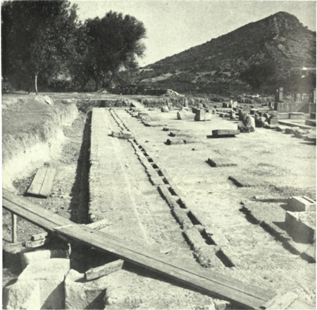
Βραυρών: Τὸ βόρειον μέρος τοῦ στωϊκοῦ συγκροτήματος. Ἡ λεγομένη παραστάς