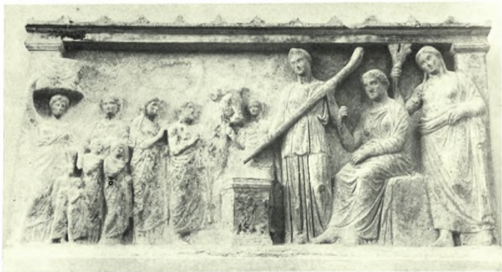
Βραυρών: α. Ἀνάγλυφον με παράστασιν προσκυνητῶν προσελθόντων εἰς τὸν βωμὸν τῆς Ἀρτέμιδος, παρὰ τὸν ὅποιον ἵσταται ἡ θεά, β. Ἀνάγλυφον με παράστασιν προσκυνητῶν προσελθόντων εἰς τὸν βωμὸν τῆς Ἀρτέμιδος, παρὰ τὸν ὅποιον ἡ Ἄρτεμις, ἡ Λητώ καὶ ὁ Ἀπόλλων