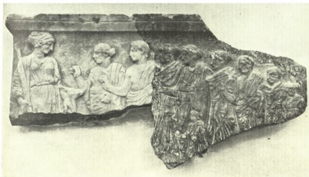
Βραυρών: α. Ἀνάγλυφον με παράστασιν προσκυνητῶν προσελθόντων εἰς τὸ ἱερόν τῆς Ἀρτέμιδος. Ἀριστερά καθμένη ἡ θεά, β. Τμήμα ἀναγλύφου με παράστασιν προσκυνητῶν προσελθόντων εἰς τὸ ἱερόν τῆς θεάς. Ἀριστερά ἡ θεά προσδεχομένη τοὺς προσκυνητάς