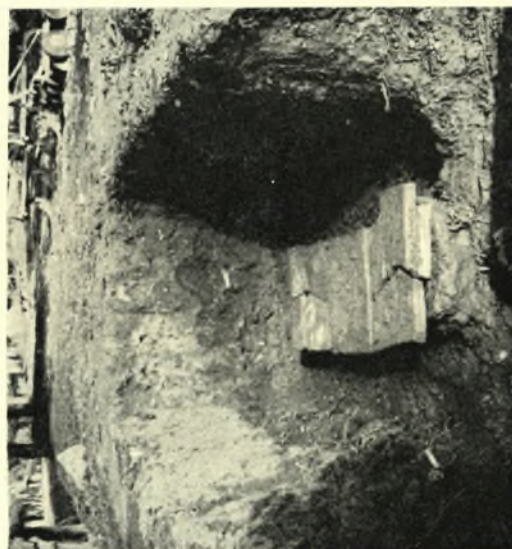
Σπάρτη. Άνασκαφή οικοπέδου Βερβιτσιώτη: α - β. Τμήματα του ψηφιδωτού δαπέδου του κεντρικού κλίτους, γ. Ρωμαϊκός, κεραμοσκεπής τάφος Α. της άψιδος του κοσμικού κτίσματος