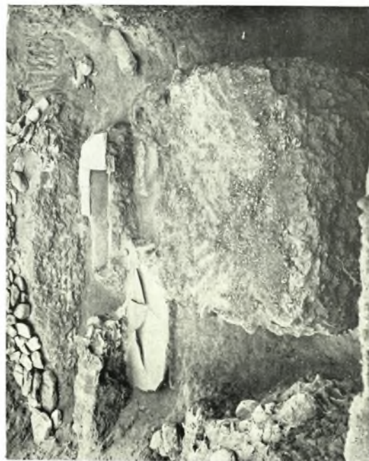
Σπάρτη: α. Μία ακόμη εικών τοῦ χώρου ἀπὸ τὴν ΝΑ πλευρᾶν. Ὁ παιδικὸς τάφος δεξιᾶ, β. Ὁ χώρος ἀπὸ Δ μετὸν κλίβανον εἰς τὸ πρῶτον ἐπίπεδον καὶ τοὺς τάφους εἰς τὸ βάθος. γ. Εἰκὼν μετὰ τὴν ἀνασκαφὴν ὄλων τῶν τάφων καὶ πρὸ τῆς τοποθετήσεως τῶν πλακῶν εἰς τὴν θέσιν των καὶ τῆς ἐπικαλύψεως τοῦ χώρου