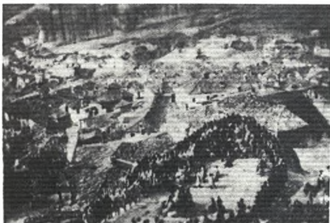
Θέση “ Σημαίνει ο Θεός” ,1928

Ένα μικρό άπλωμα κάτω ακριβώς από τον Άγιο Νικόλαο και το κοιμητήρι. Εκεί γινόταν ο πρώτος σταθμός των χωριανών στις μεγάλες γιορτές μετά τη Θεία Λειτουργία και εκεί σηνόταν ο πρώτος χορός με τα παραδοσιακά τραγούδια. Στις 4 το απόγευμα, εσήμανε η καμπάνα και ο κόσμος προσέρχονταν στην εκκλησία κι έπειτα με την απόλυση της εκκλησίας κατέβαιναν στη θέση “Σημαίν’ ο Θεός” , όπου γινότανε μεγάλος χορός. Ντυμένοι όλοι με τα γιορτινά τους πιάνονταν στο χορό και έλεγαν πρώτα και πάντοτε σ’αυτή τη θέση “ Σημαίν’ ο Θεός, σημαίν’ η γη Γιαννεέεε, σημαίνουν τα ουράνια νάεεε ”