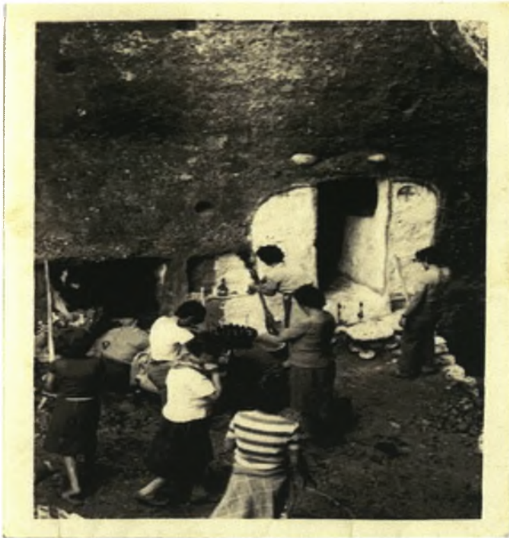
Φωτο 8: Το Εκκλησάκι του Αγίου Πνεύματος