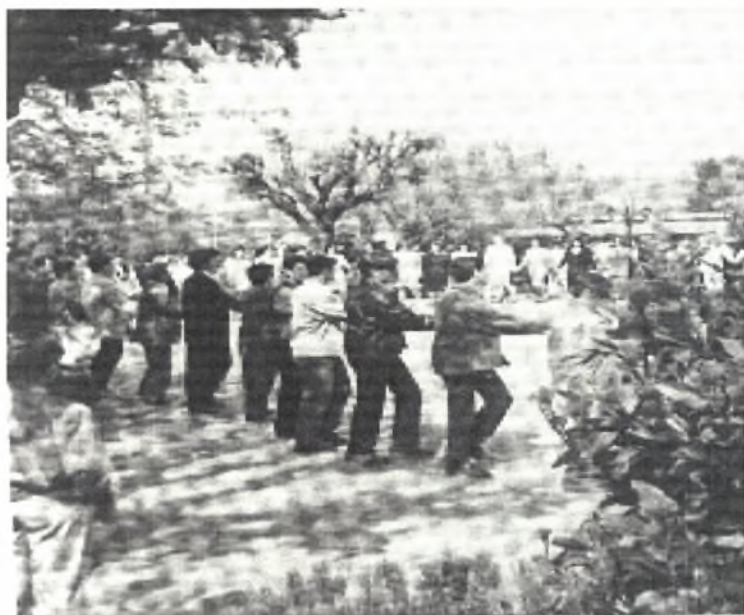
Φωτο 11: Πασχαλινός χορός στην πλατεία του Αγίου Αθανασίου

Ο συγκεκριμένος χορός αποτελείται από έξι χορευτικές κινήσεις. Τα πρώτα τρία βήματα γίνονται προς τη φορά του κύκλου και τα άλλα τρία βήματα επιτόπου με το μέτωπο στραμμένο στο κέντρο του κύκλου.