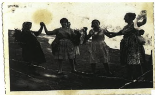
Φωτο 9:

Κυρίαρχη θέση στο στίχο των τραγουδιών αυτών έχει το φυσικό στοιχείο, αφού γίνεται αναφορά σε ποτάμια, σε βουνά, στη γη, στον ουρανό. Σε ένα από τα τραγούδια του Πάσχα γίνεται λόγος για ένα από τα μοναστήρια,