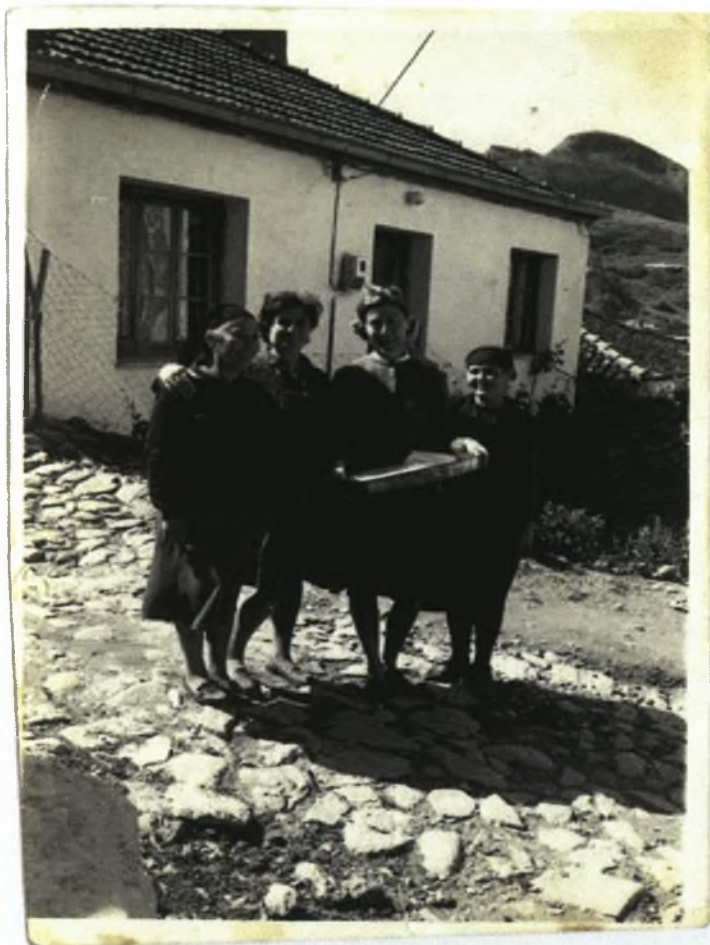
Φώτο 10: