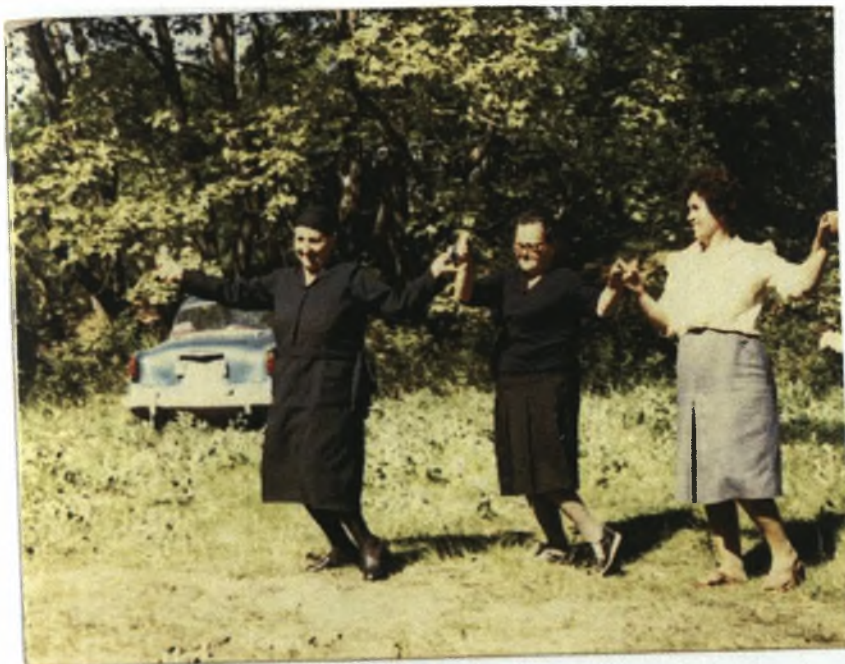
Φώτο 4: Αρχείο Αρχόντως Κολιού

Συνεπώς, κατανοούμε ότι οι άνθρωποι βρίσκονταν σε μία συνεχή επαφή με τα Πασχαλιόγιορτα, τα οποία πλέον σήμερα τα συναντούμε μόνο κατά τις ημέρες του Πάσχα. Το συμπέρασμα που ανάγουμε είναι ότι οι άνθρωποι του χωριού στις δεκαετίες 1920-30, αλλά προφανώς και παλιότερα εφόσον τότε ήδη προϋπήρχαν στίχοι τραγουδιών σύμφωνα πάντα με την παραπάνω μαρτυρία είχαν ως ενδιαφέρον και διασκέδαση τη δημιουργία στίχων. Όταν συγκεντρώνονταν παρέες-παρέες δημιουργούσαν στίχους κι αυτό μαρτυρούν τα άπειρα δημοτικά τραγούδια που διασώζονται μέχρι και σήμερα στην ελληνική παράδοση και στο ίδιο το χωριό για το οποίο γίνεται λόγος, «το Καστράκι».