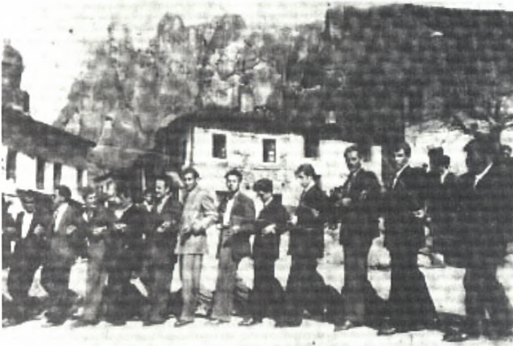
Φώτο 13: Πασχαλινός χορός στο Μεσοχώρι (παλιά πλατεία του χωριού)