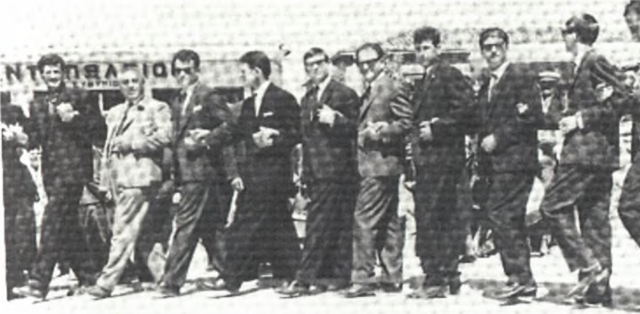
Φώτο 12: Πασχαλιόγιορτα στο Καστράκι

Οι στίχοι των τραγουδιών που ακολουθούν είναι σε μέτρο ιαμβικό δεκαπεντασύλλαβο και έχουν ίδια ρυθμική αγωγή.