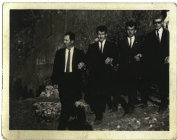
Φώτο 14:Χορός στο εκκλησάκι του Αγίου Γεωργίου

Λέλε Γιάννη μου λέλε αγάπη μου Δασκάλι μ' που 'ναι το παιδί (iiii) βρε που 'ναι κι ο Γιαννάκης Λέλε Γιάννη μου λέλε αγάπη μου Ο Γιάννακης δε φάνηκε (iiii) καν δυο καν τρεις ημέρες Λέλε Γιάννη μου λέλε αγάπη μου Βιτσιά βαρύ τ' αλόγου του (iiii) στη μάνα του πηγαίνει Λέλε Γιάννη μου λέλε αγάπη μου Μανά μου που 'ναι το παιδί (iiii) βρε που 'ναι κι ο Γιαννάκης Λέλε Γιάννη μου λέλε αγάπη μου Ο Γιάννακης ελάλησε (iiii) που μέσα από τον τέντζερ' Λέλε Γιάννη μου λέλε αγάπη μου Αν είσαι Τούρκος φάγε με (iiii) Ρωμιός κρατσάνισέ με Λέλε Γιάννη μου λέλε αγάπη μου Κι αν είσαι ο πατέρας μου (iiii) σκύψε και φίλησέ με Λέλε Γιάννη μου λέλε αγάπη μου Τότε την παίρνει απ'τα μαλλιά (iiii) και στο σωρό την πιάνει Λέλε Γιάννη μου λέλε αγάπη μου Άλεσε μύλε μ' άλεσε της κούρβας το τομάρι Λέλε Γιάννη μου λέλε αγάπη μου Φκιάσει τ' αλεύρι κόκκινο και την πασπάλη μαύρη Λέλε Γιάννη μου λέλε αγάπη μου Τ' αλεύρ' να τρώγουν τα σκυλιά και την πασπάλη τα γρούνια Λέλε Γιάννη μου λέλε αγάπη μου