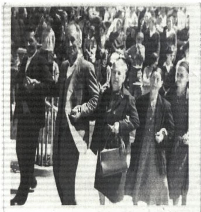
Πασχαλινός χορός στην πλατεία του Αγίου Αθανασίου Φώτο 5: