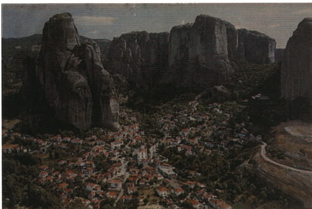
Φωτο 1: Πανοραμική άποψη του χωριού Καστράκι.

Τέλος θα ήθελα να προσθέσω ότι η εργασία με βοήθησε να ανακαλύψω στοιχεία για το αντικείμενο της μελέτης μου που δεν γνώριζα πριν και να μάθω και άλλα επιπλέον στοιχεία που αφορούν τα ήθη, έθιμα και την ιστορία του τόπου μου με τον οποίο είμαι συναισθηματικά δεμένη και να ευχαριστήσω τους καθηγητές μου και τους συγχωριανούς μου για την πολύτιμη βοήθειά τους.