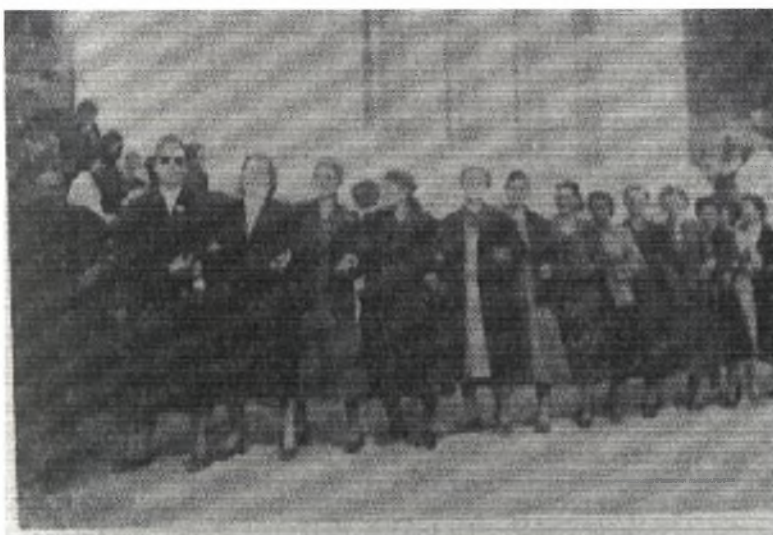
Φωτο 6: Χορός γυναικών στον Αϊ-Θανάση κατά τον εορτασμό του Αγίου Γεωργίου

Άλλοι πάλι ντόπιοι, θέλουν την παράδοση ως εξής: Την ίδια εκείνη περίοδο της Τουρκοκρατίας, ένας ντόπιος ξυλοκόπος έκοβε ξύλα με τον μικρό του γιο και ένα απ' αυτά έπεσε και χτύπησε το παιδί στο κεφάλι. Εκείνη τη στιγμή έτυχε να περνάει από 'κει μια Τουρκάλα, η οποία βλέποντας το πληγωμένο παιδί, έβγαλε τον φερετζέ της και έδεσε μ' αυτόν το κεφάλι του παιδιού, ενώ ο πατέρας προσευχόταν στον Άγιο για τη σωτηρία του. Όταν τελικά το παιδί έγινε καλά, άφησαν το μαντίλι που το έσωσε με την βοήθεια του Αγίου, σαν αφιέρωμα στην εκκλησία, και από τότε κρατάει το έθιμο.