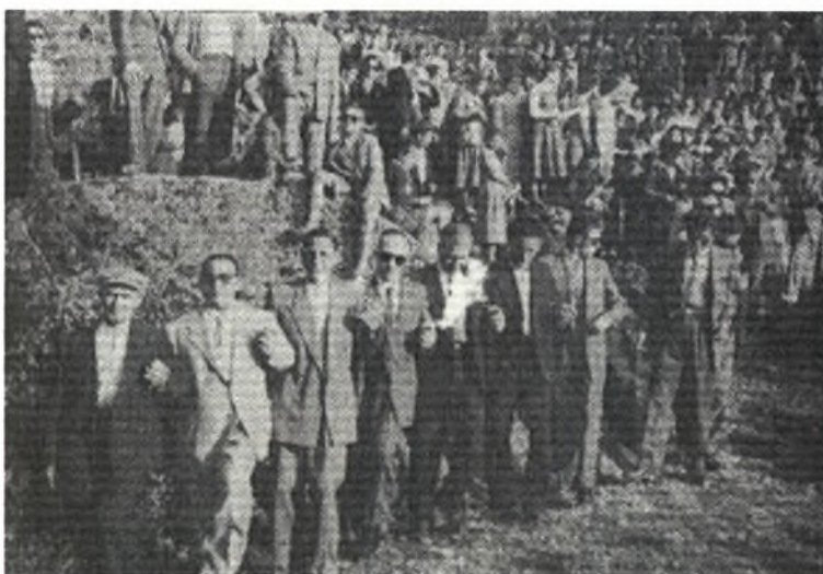
Θέση “ Σημαίνει ο Θεός ” ,1956