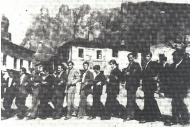
Φωτο 15: Πασχαλινός χορός στο μεσοχώρι, Αρχείο Φανής Τσάρα

Παλαιότερα, ο χορός ξεκινούσε από την τοποθεσία «Σημαίνει ο θεός» και κατέληγε πάντα στο μεσοχώρι (τοπωνύμιο που το χρησιμοποιούμε και σήμερα), το παλιό κέντρο του χωριού. Πρόκειται για μια διαδικασία που δεν βρέθηκε λογική εξήγηση απλά έτσι το βίωσαν από τις προηγούμενες γενεές και συνεχίστηκε μέχρι τις μέρες μας.