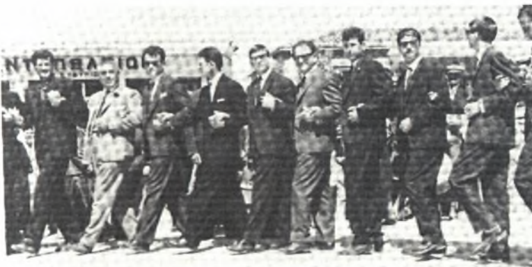
Φώτο 16: Πασχαλινός χορός στην πλατεία του χωριού

Σήμερα, ο χορός γίνεται στο σημερινό κέντρο του χωριού, δηλαδή την πλατεία του χωριού, η οποία βρίσκεται δίπλα στην εκκλησία του Πέτρου και Παύλου.