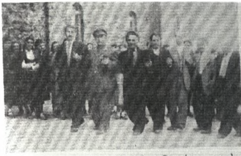
Φωτο 7: Χορός ανδρών στον Αϊ-Θανάση κατά τον εορτασμό του Αγίου Γεωργίου