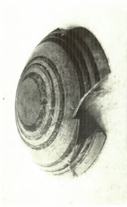
Ρόδος: α-δ. Μυκηναϊκά ἀγγεία ἐκ Κοσκινού