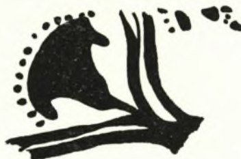
Σχ ε δ. 7. Ἄνθος παπύρου ἐπὶ τοῦ σκύφου ἀρ. 16

14 (440Z) (Πί ν. 64 ε δεξιά). Πυξίδος κυλινδρικής («ἀλαβάστρου») τεμάχιον. Πηλὸς μελοκάστανος, ἐπιφάνεια ὁμοιόχρωμος βεβλαμμένη μάλιστα κάτω. Διακόσμησις διὰ καστανοῦ, ἐν μέρει ἐξιτήλου, τριγῶνων πεπληρωμένων δικτυωτοῦ ἐπὶ τῶν ὤμων.