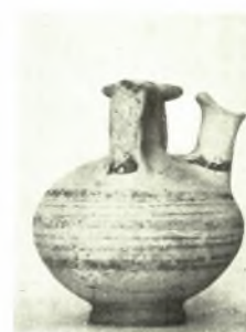
Ρόδος: α-ζ. Ἴαγγεῖα ἐκ τῆς Μυκηναϊκῆς ἀκροπόλεως τοῦ Ἴ�ρχαγγέλου