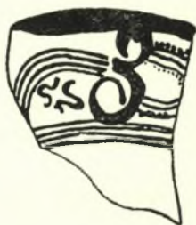
Σχεδ. 2. Τεμάχιον κύλικος ἐκ Μυκηνῶν

2 (243). Ὑψίπους κύλιξ πλήρης, τῆς ὁποίας συνεκολλήθησαν δύο τεμάχια κατὰ τὴν βάσιν. Πηλὸς ἀνοικτοκάστανος, ἐπιφάνεια μελόχρους. Διακόσμησις δι' ἐρυθρωποῦ, ἐξιτήλου τὸ πλεῖστον κατὰ τὸ ἄνω μέρος τῆς ἐτέρας τῶν πλευρᾶς, τριῶν «μυκηναϊκῶν» ἀνθέων ἐφ' ἑκατέρας τῶν ὄψεων.