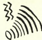
Σχεδ. 5. Κόσμημα τεμαχίου ἀρ. 13

10 (253ζ). Μάχαιρα ὄρειχαλκίνη πλήρης (κατὰ τὸ μεταλλικὸν αὐτῆς μέρος). Ἐπὶ τῆς λαβῆς τρεῖς ἦλοι στερεώσεως ἐξέχοντες ἀμφοτέρωθεν.