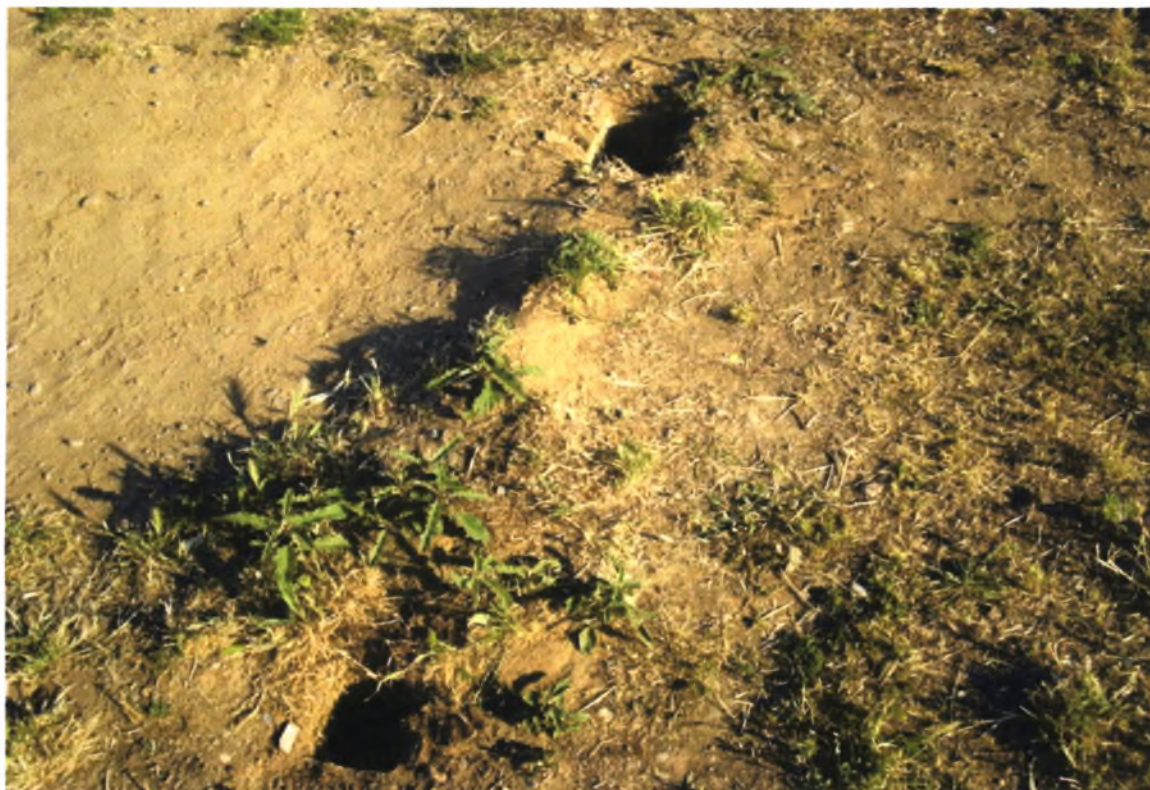
Πολιτιστικό Άλσος Α. Βαλαχί-Ν.Ιωνία