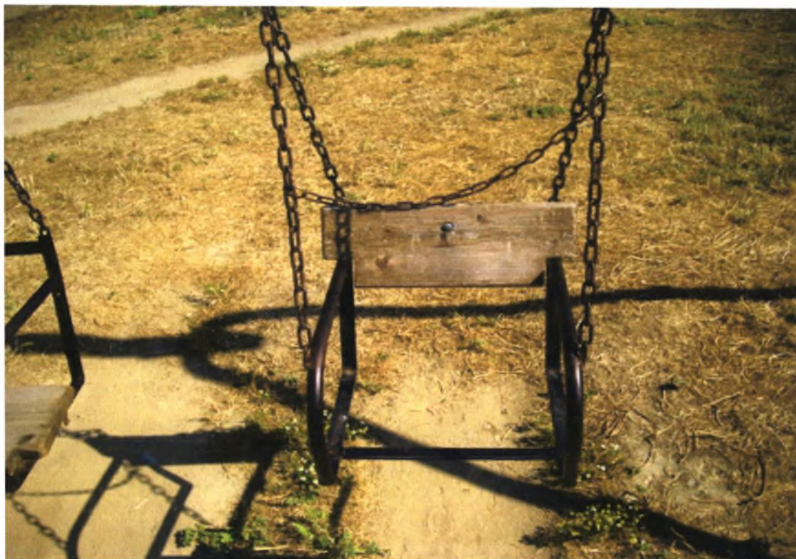
Πλατεία 3 ης Αυγούστου 1922 -Ν.Ιωνία