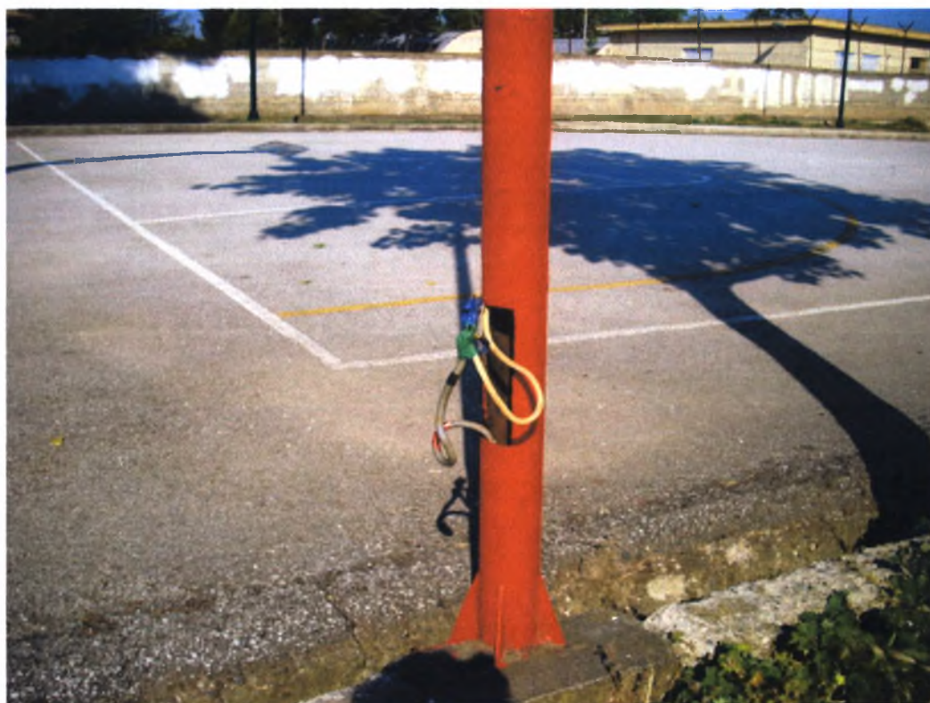
Πολιτιστικό Άλσος Α. Βαλαχή-Ν.Ιωνία