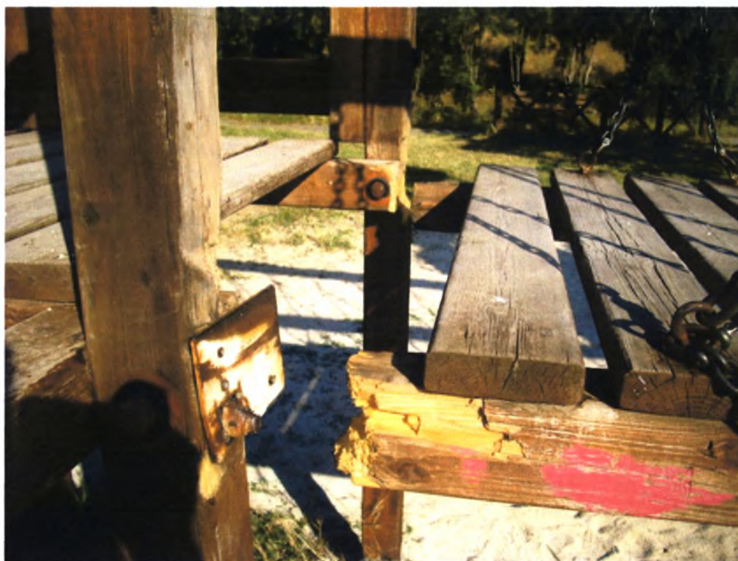
Πολιτιστικό Άλσος Α. Βαλαχί-Ν.Ιωνία