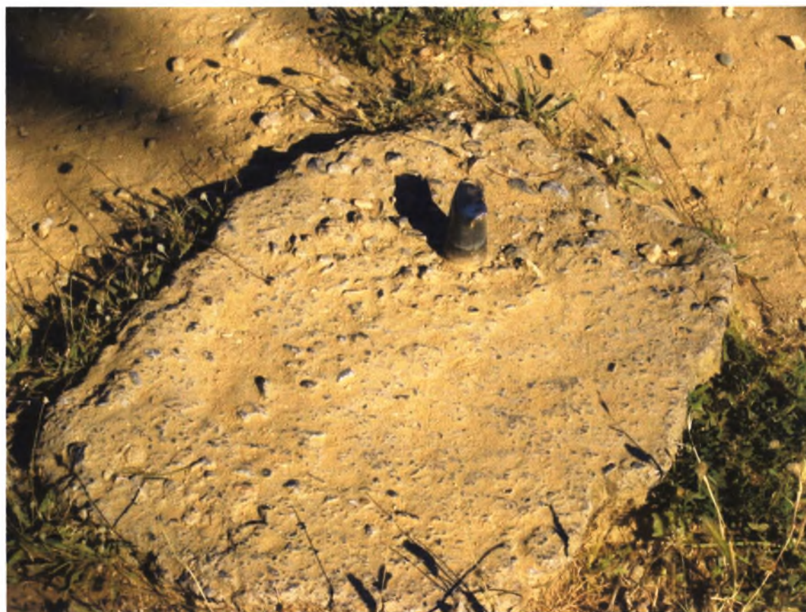
Πολιτιστικό Άλσος Α. Βαλαχή-Ν.Ιωνία