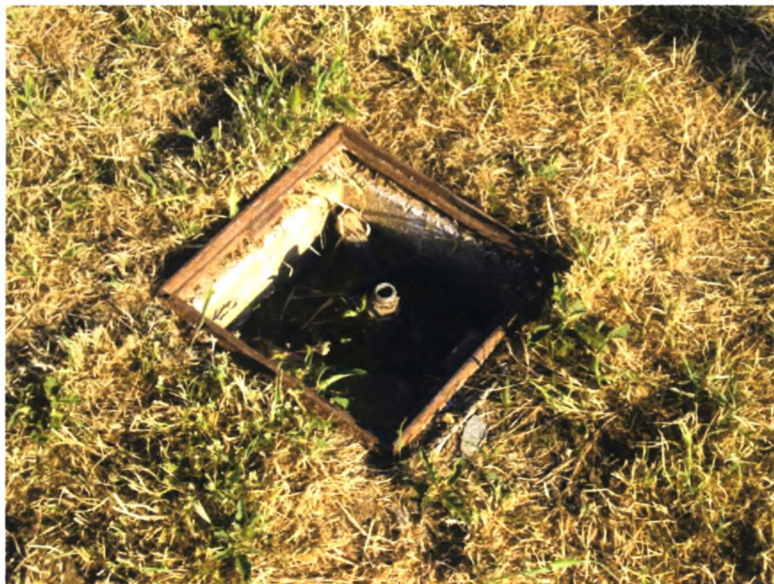
Πολιτιστικό Άλσος Α. Βαλαχί-Ν.Ιωνία