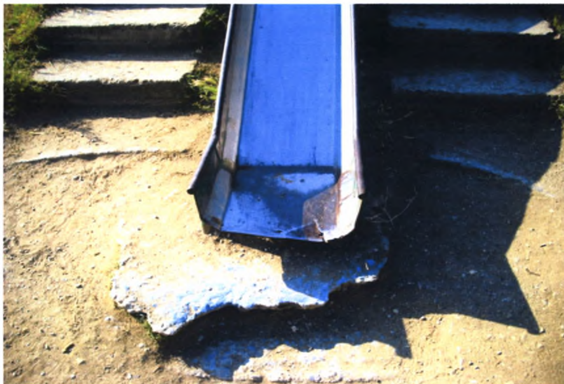
Πολιτιστικό Άλσος Α. Βαλαχί-Ν.Ιωνία