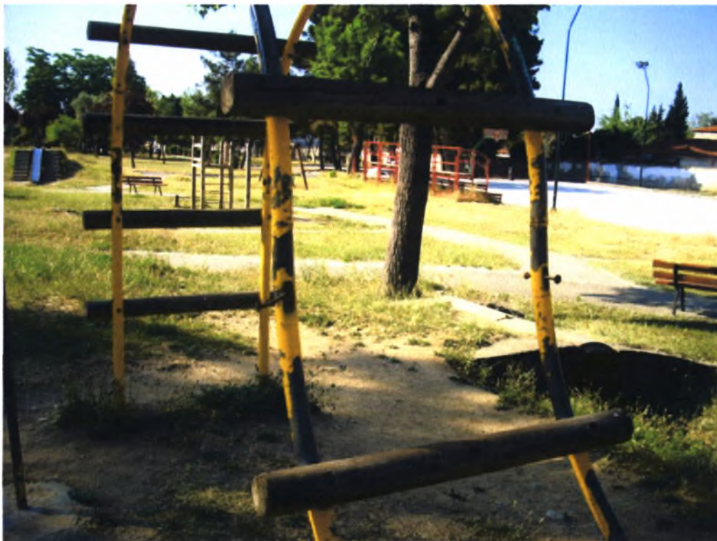
Πολιτιστικό Άλσος Α. Βαλαχί-Ν.Ιωνία