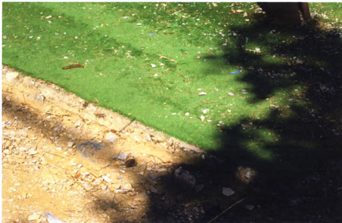
Πάρκο Αγ. Δημητρίου-Βόλος