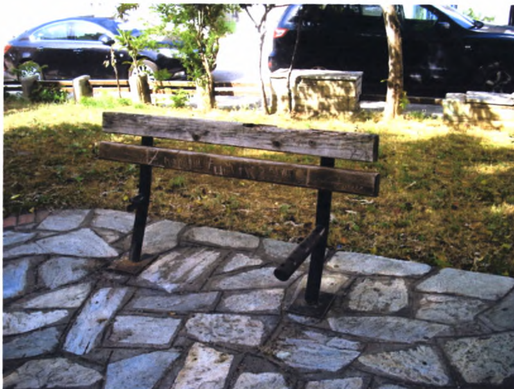
Πλατεία Οικ Πατρ.Δημητρίο-Ν.Ιωνία