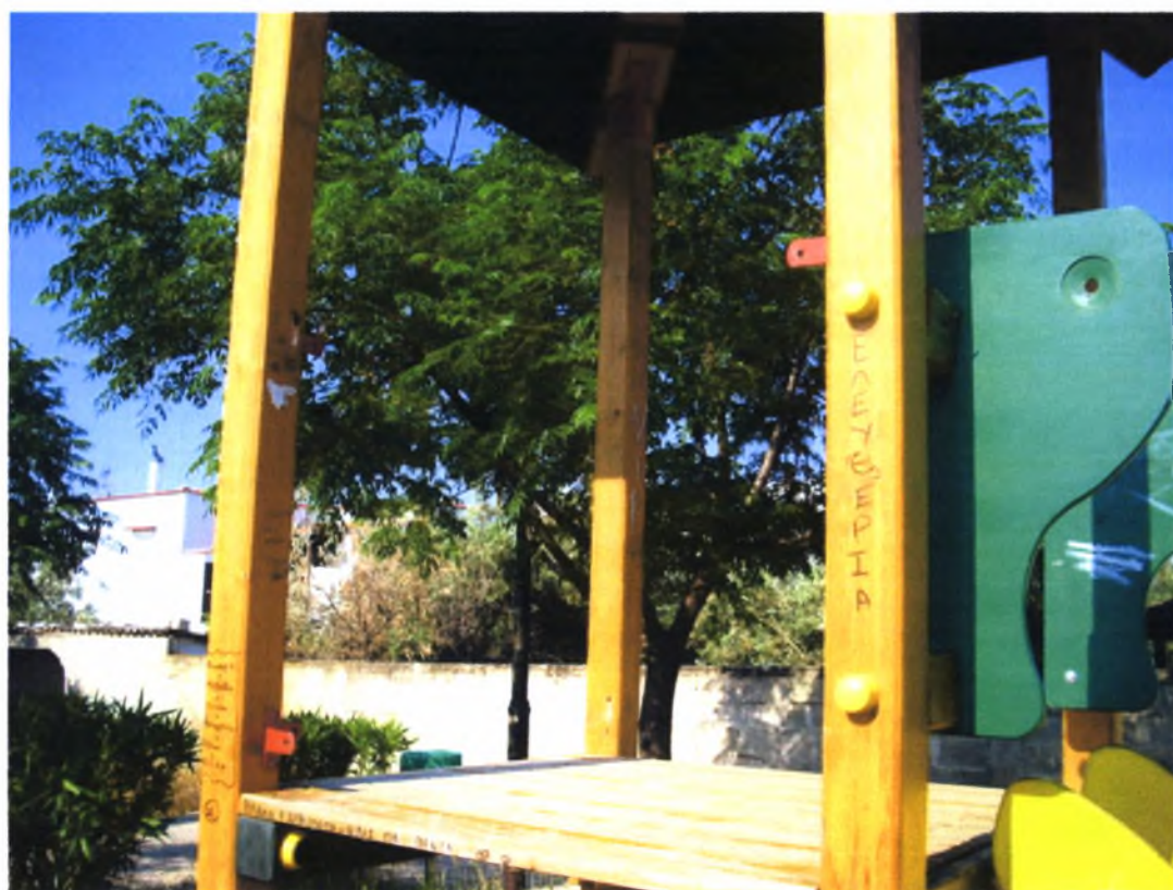
Πλατεία Ιωνικού Παν/μίου Σμύρνης -Ν.Ιωνία