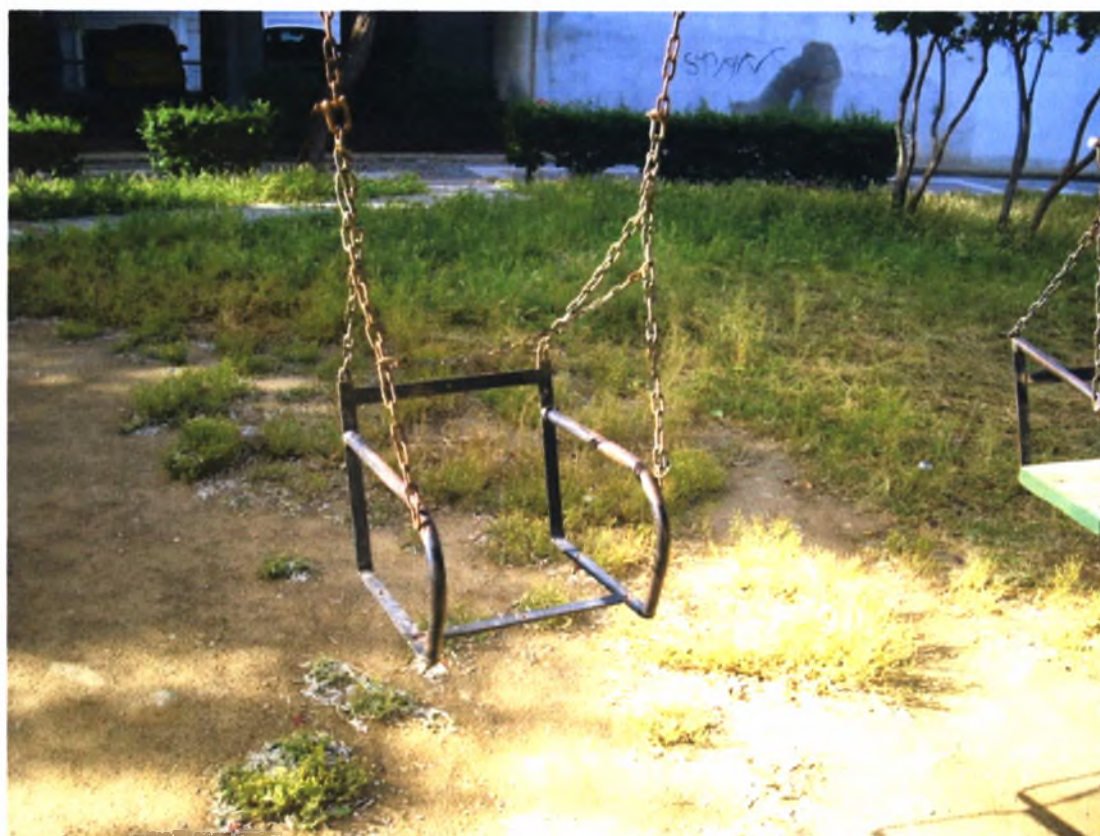
Πλατεία Θρακών –Ν.Ιωνία