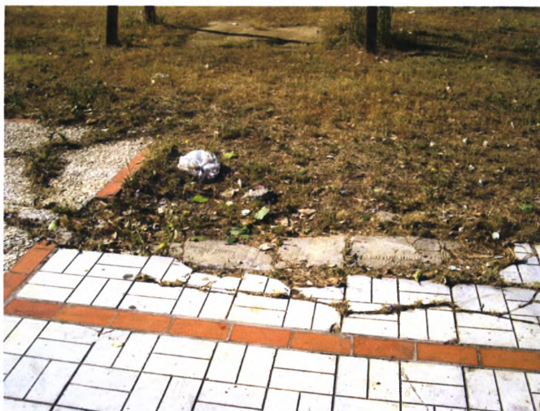
Ισιδώρου –Σεφέρη –Ν.Ιωνία