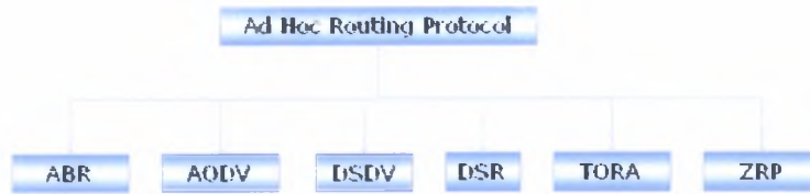
Figure 2: Πρωτόκολλα Δρομολόγησης

την διαδικασία λήψης αυτής της απόφασης, ο αποστολέας χρειάζεται πληροφορίες όπως το αν υπάρχει κάποιος χρήσιμος ενδιάμεσος ή ποιος είναι ο “καλύτερος” αν υπάρχουν πολλοί διαθέσιμοι ενδιάμεσοι. Αυτή την πληροφορία την συλλέγει καθόλη την διάρκεια ζωής του δικτύου, με την βοήθεια ενός πρωτοκόλλου δρομολόγησης.