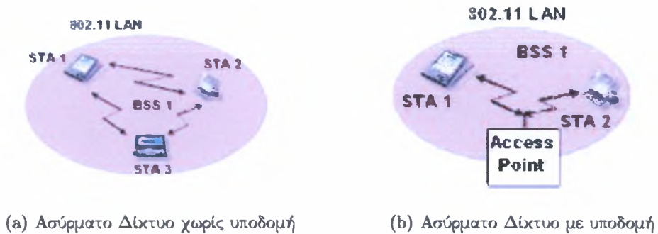
Figure 1: Παραδείγματα Ασύρματων Δικτύων

Στα ασύρματα δίκτυα οι κόμβοι χρησιμοποιούν ραδιο-σήματα για την επικοινωνία τους. Στην κλασική περίπτωση, κάθε κόμβος μπορεί να μεταδίδει ή να λαμβάνει σε μια χρονική στιγμή άλλα όχι και τα δύο συγχρόνως. Η επικοινωνία των κινητών κόμβων είναι εφικτή όταν οι κόμβοι βρίσκονται εντός μιας συγκεκριμένης περιοχής κάλυψης. Όλοι οι κόμβοι χρησιμοποιούν την ίδια συχνότητα για να μεταδώσουν και να παραλάβουν μηνύματα. Έτσι, μέσα στην περιοχή κάλυψης, χρησιμοποιείται ένα κανάλι μετάδοσης, καλύπτοντας όλο το εύρος ζώνης. Ένα χαρακτηριστικό της μετάδοσης των πακέτων στα ασύρματα δίκτυα είναι η έννοια της τοπικότητας. Όταν κάποιος σταθμός μεταδίδει σε κάποιον άλλο δεν είναι σίγουρο ότι οι υπόλοιποι σταθμοί του δικτύου θα το αντιληφθούν. Το ποιοι σταθμοί θα αντιληφθούν την μετάδοση εξαρτάται από την θέση στην οποία βρίσκονται, σε σχέση με τον αποστολέα του μηνύματος. Αυτοί που βρίσκονται στην περιοχή εμβέλειας του αποστολέα (είναι “ορατοί”) θα ακούσουν την μετάδοση, σε αντίθεση με όλους τους υπόλοιπους, που θα είναι σε θέση μόνο να επηρεάσουν αρνητικά την μετάδοση.