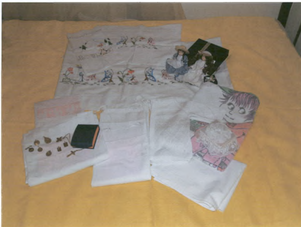
Η προίκα του μωρού: σεντονάκια, ρούχα, πετσέτες.

Τοποθετούν το κρεβατάκι του μωρού 2 , το οποίο είναι φτιαγμένο από ξύλο με διάφορα σκαλίσματα ή ζωγραφιές στο κεφαλάρι και στα πόδια, και στις πλαϊνές πλευρές με κάγκελα. Στρώνεται με ασπροκέντητα ή χρωματιστά σεντονάκια με παιδικές παραστάσεις. Τοποθετείται χαμηλό μαξιλαράκι στο οποί κερφισώνονται διάφορα φυλαχτά, γαλάζιες χάντρες και ματάκια τα οποία δωρίζουν οι γιαγιάδες ή άλλοι συγγενείς για να προφυλάγεται το μωρό από τη βασκανία. Κρεμούν πάνω από τη κούνια διάφορα αιωρούμενα παιχνίδια για να χαζεύει το μωρό. Γύρω-γύρω στο δωμάτιο υπάρχουν παιδικές παραστάσεις διάφορα λούτρινα αρκουδάκια και άλλα υφασμάτινα παιχνίδια. Σε κάποιο σημείο του δωματίου υπάρχει το μπανάκι του μωρού και η αλαξέρα. Τον τοίχο κρεμούν την εικόνα του Αγίου Στυλιανού, που θεωρείται προστάτης των παιδιών.