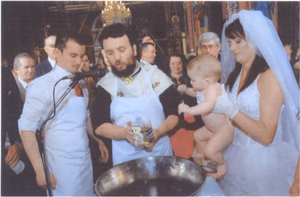
Μετά το γάμο του ζευγαριού, γίνεται η βάπτιση του μωρού. Η μητέρα-νύφη κρατάει στα χέρια το παιδί της.