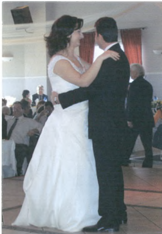
Οι νεόνυμφοι χορεύουν ένα βαλς, με τραγούδι που έχουν οι ίδιοι επιλέξει.