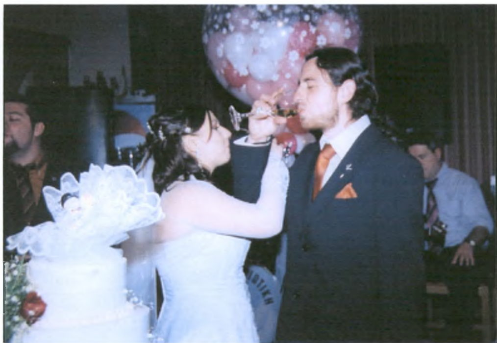
Το ζευγάρι πίνει σαμπάνια.