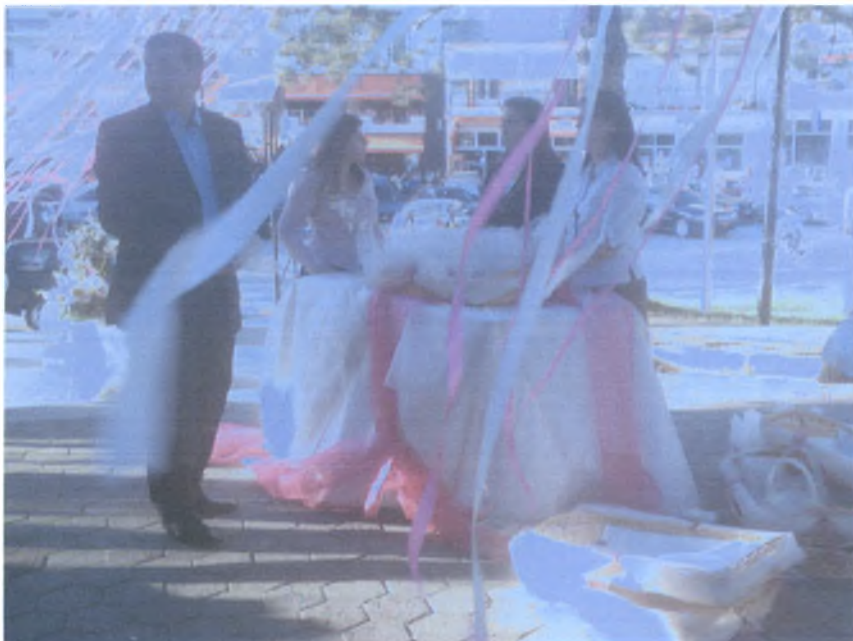
Μετά το μυστήριο του γάμου μοιράζονται οι μπομπονιέρες. Ο χώρος έξω από την εκκλησία μπορεί να στολιστεί με κορδέλες, ανάλογα με την επιθυμία του ζευγαριού.