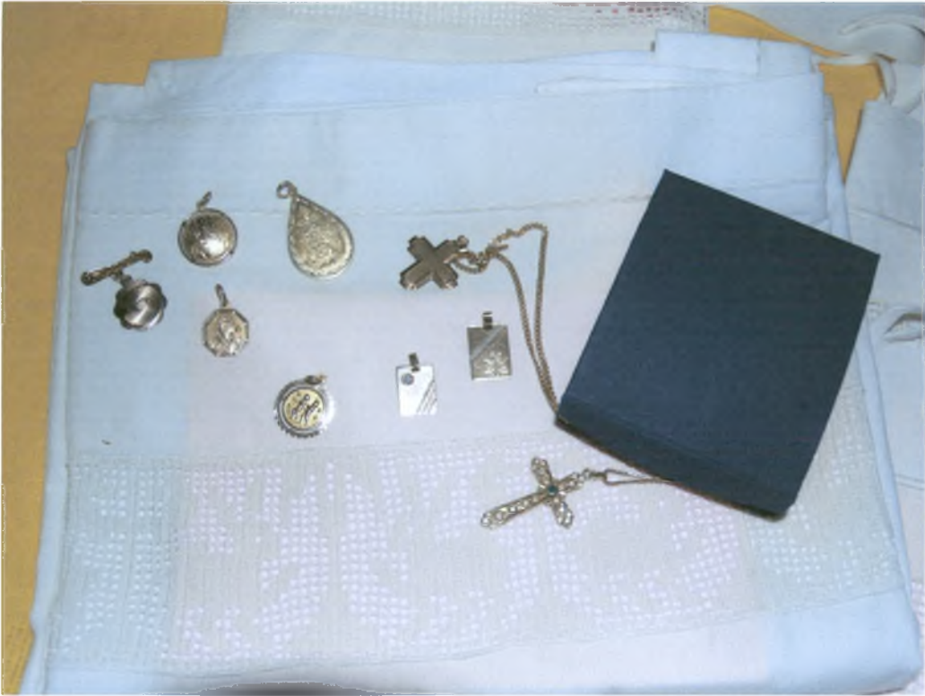
Σταυρουδάκια, και διάφορα φυλαχτά για το μωρό από τις γιαγιάδες και άλλους συγγενείς.