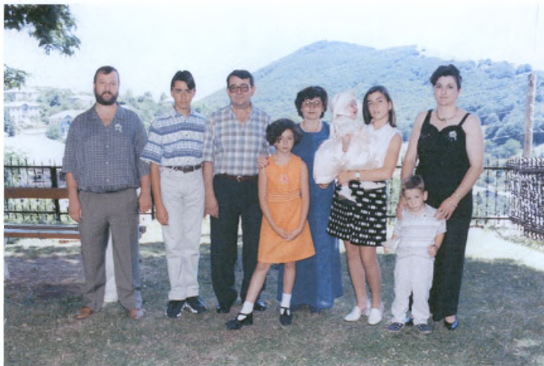
Μετά το μυστήριο της βάπτισης, η οικογένεια του μωρού και η οικογένεια του νουνού ή της νουνάς βγαίνουν αναμνηστικές φωτογραφίες.

Τρεις ημέρες μετά τη βάπτιση ο νουνός πηγαίνει στο σπίτι του μωρού και το κάνει μάνιο. Οι τρεις ημέρες συμβολίζουν την Ανάσταση του Χριστού. Ο νουνός φέρνει γλυκά και ένα δώρο στο παιδί συνήθως κάποιο ρούχο. Το νερό με το οποίο έπλυναν το νεοφώτιστο, το ρίχνει η μητέρα στα λουλούδια ή σε κάποιο μέρος όπου δεν θα πατήσει άνθρωπος ή κάποιο ζώο. Μετά το μάνιο του μωρού, η μητέρα κερνάει το νουνό πίτες που έχει φτιάξει η ίδια.