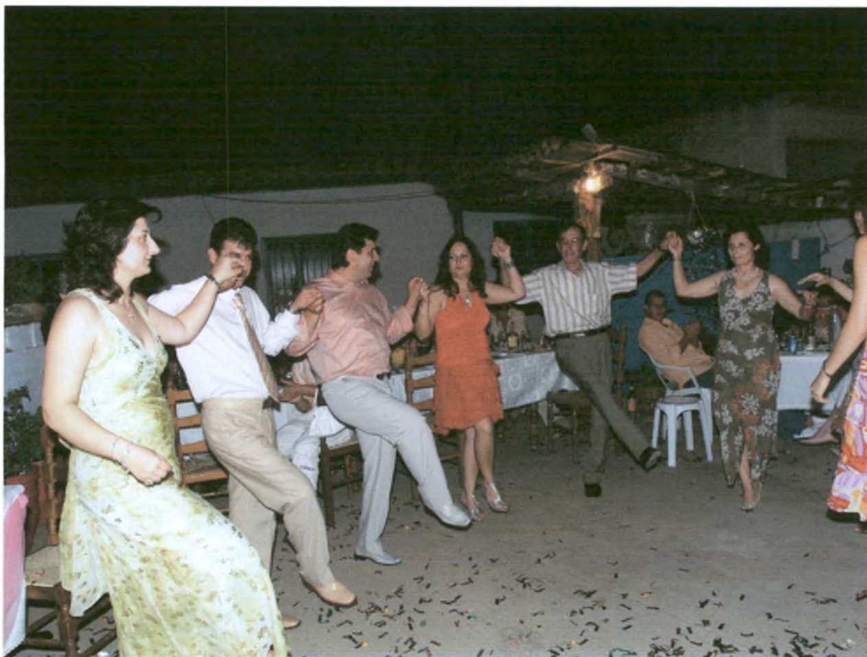
Το γλέντι έχει ανάψει. Πρώτη η νύφη σέρνει το χορό.

Το γλέντι συνεχίζεται μέχρι τις πρώτες πρωινές ώρες. Κατά την αποχώρηση της οικογένειας του γαμπρού, η μητέρα της νύφης δίνει στη μητέρα του γαμπρού ένα βάζο με γλυκό του κουταλιού, για να είναι γλυκιά η ζωή της με τη νύφη. Αυτό γίνεται επειδή παλιότερα το ζευγάρι έμενε συνήθως στο σπίτι των γονιών του γαμπρού.