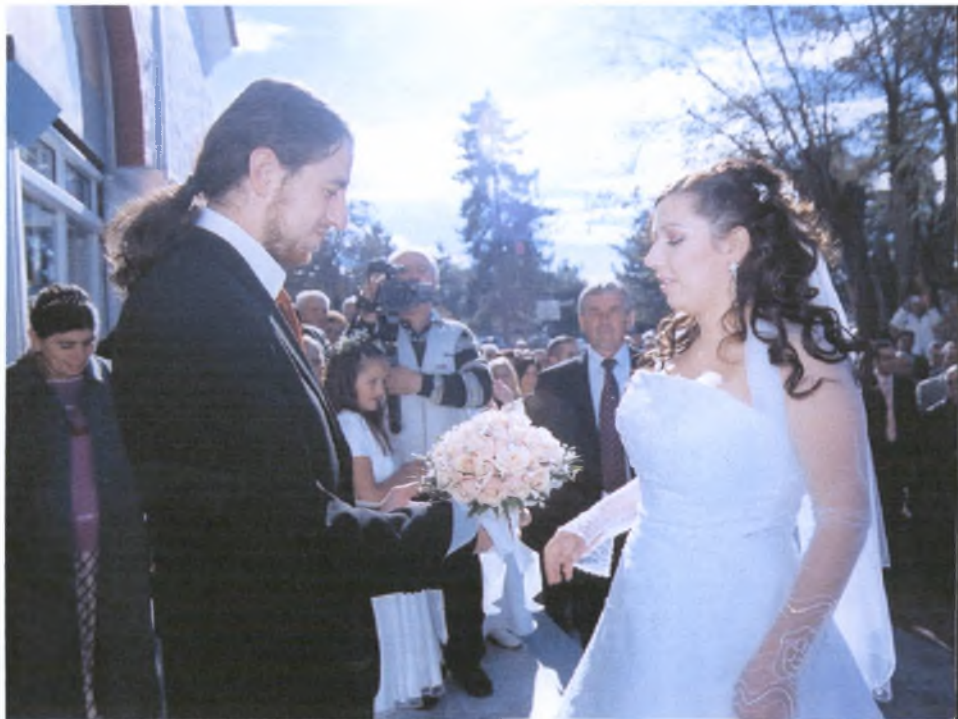
Ο γαμπρός υποδέχεται τη νύφη και της προσφέρει την ανθοδέσμη.