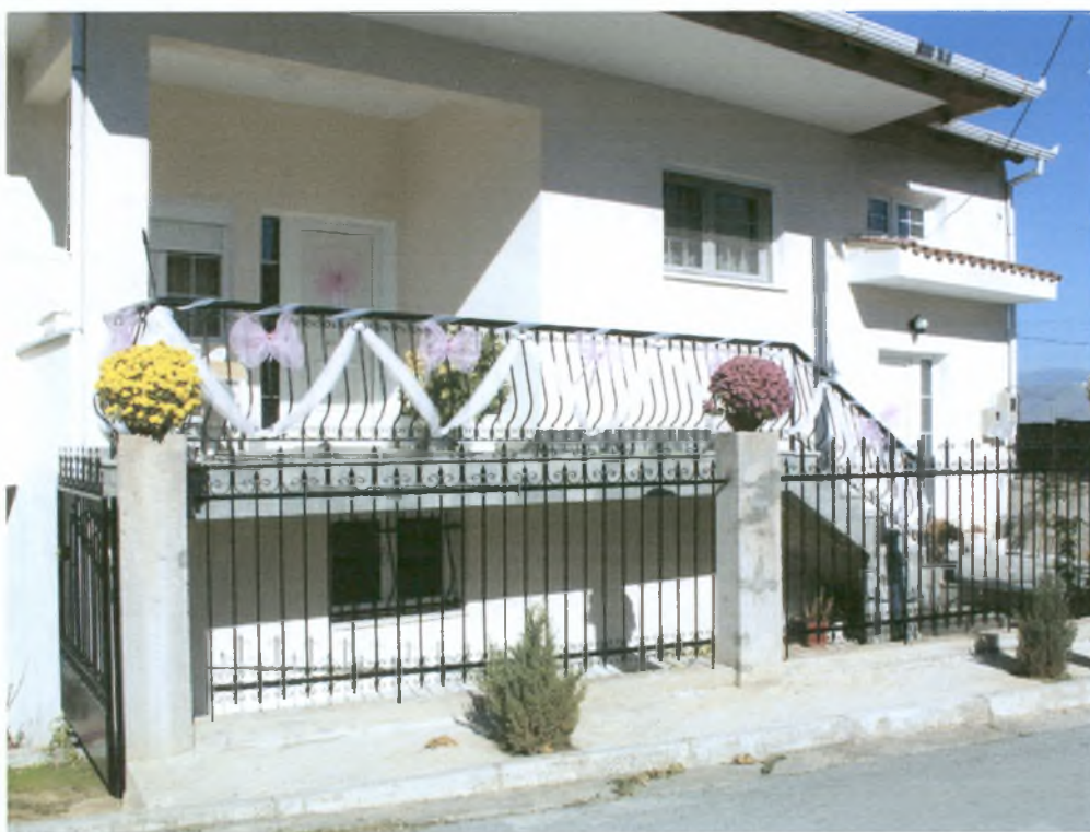
Το σπίτι τη νύφης, στολισμένο με ροζ και άσπρο τούλι.

Περίπου δύο μήνες πριν το γάμο, ξεκινούν οι ετοιμασίες. Η νύφη διαλέγει νυφικό και ο γαμπρός κοστούμι, επιλέγονται τα προσκλητήρια, οι μπομπονιέρες και γίνεται έκθεση της προίικας. Λίγες μέρες πριν το γάμο, οι δύο οικογένειες στολίζουν το εξωτερικό του σπιτιού τους με τούλι, για να φαίνεται ότι γίνεται γάμος. Υποχρέωση των μελλόνυμφων είναι να δημοσιεύσουν το γάμο τους σε κάποια εφημερίδα, συνήθως τοπική, πριν ή μετά την τέλεσή του. Στην αγγελία αυτή αναγράφονται τα ονόματα των μελλόνυμφων, το επάγγελμα με το οποίο ασχολείται ο καθένας, ο τόπος καταγωγής τους, καθώς και η ώρα και ο τόπος τέλεσης του γάμου. Σε περιπτώσεις που δε γίνεται δημοσίευση, τοιχοκολλάται ένα χαρτί έξω από την εκκλησία, το οποίο ανακοινώνει την τέλεση του γάμου. Στο χαρτί αυτό αναγράφονται τα ονόματα του ζευγαριού, καθώς και η ημερομηνία και η ώρα τέλεσης του μυστηρίου.