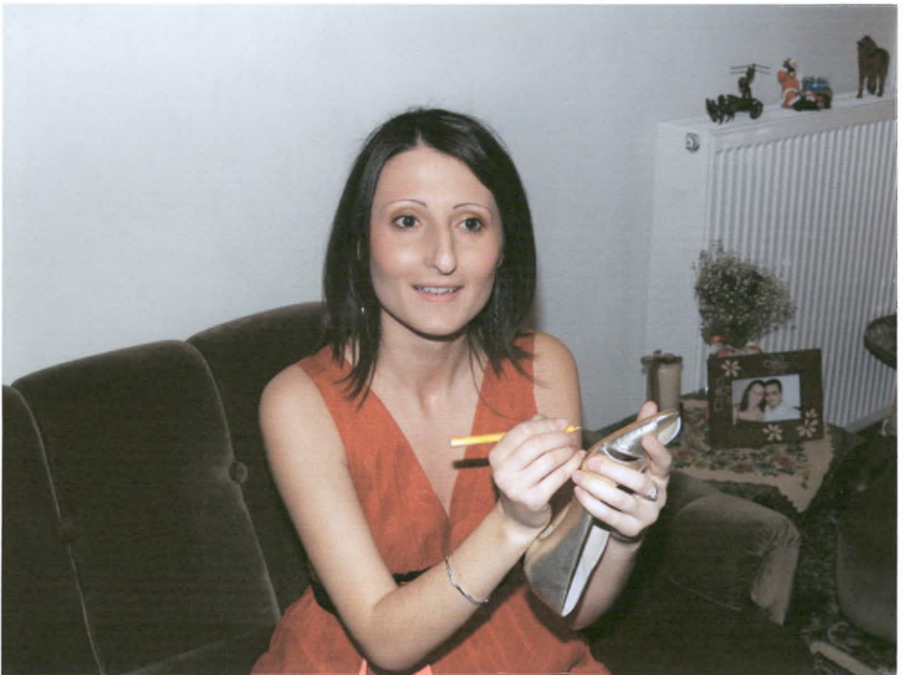
Μια κοπέλα γράφει κάτω από το παπούτσι της νύφης τα ονόματα των ανύπαντρων κοριτσιών.

Έπειτα, ο βλάμης φοράει τα παπούτσια στη νύφη. Η νύφη όμως, με το πρόσχημα ότι δεν της χωράνε, ζητάει από το βλάμη να βάλει μέσα χαρτονομίσματα. Οι φίλες της παζαρεύουν την τιμή. Τελικά, όταν οι τσέπες του βλάμη αδειάσουν, φοράει τα παπούτσια στη νύφη και ξεκινούν για την εκκλησία.