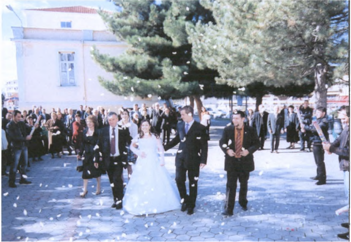
Η νύφη φτάνει στην εκκλησία συνοδευόμενη από τον πατέρα και τον αδερφό της.