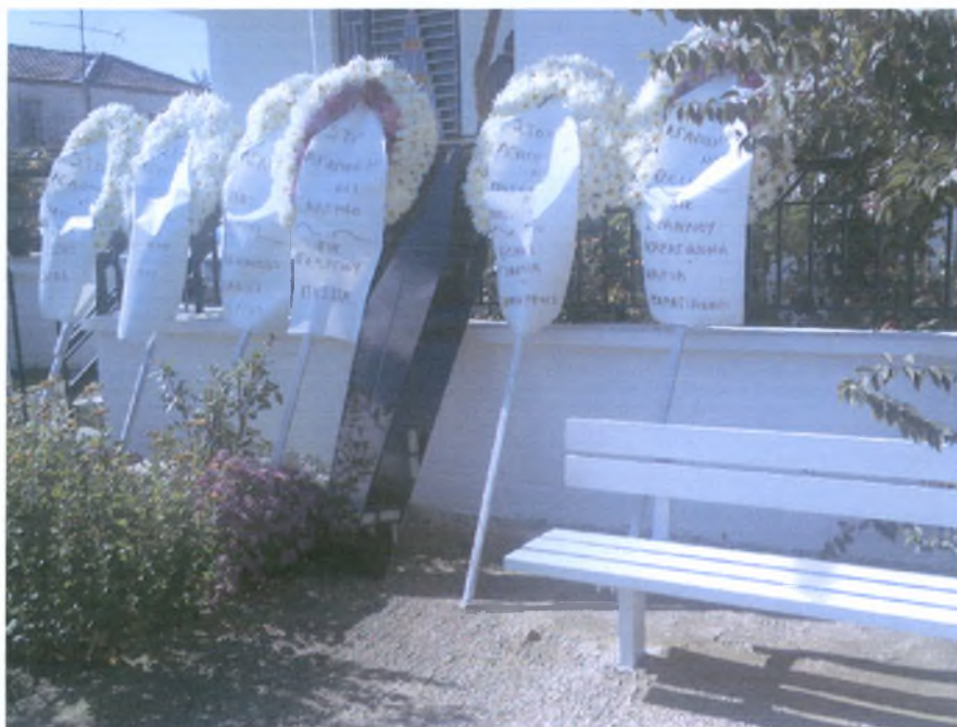
Έξω από το σπίτι τοποθετείται το καπάκι του φέρετρου και τα στεφάνια από τους συγγενείς και τους φίλους.

Καλωσορίζουμε τους συγγενείς στις χαρές, όχι στις λύπες. Λένε ότι είναι ευλογία να φιλήσει κάποιος το νεκρό στο πρόσωπο ή στα χέρια. Οι στενοί συγγενείς όλη τη νύχτα κάθονται να ξενυχτήσουν το νεκρό 12 . Στην είσοδο του σπιτιού ή του διαμερίσματος τοποθετείται το καπάκι του φέρετρου το οποίο έχει επάνω ένα σταυρό και τα αρχικά του ονόματος και του επώνυμου του νεκρού. Σε κάποιο σημείο του κρεμούν ένα άσπρο μαντήλι.