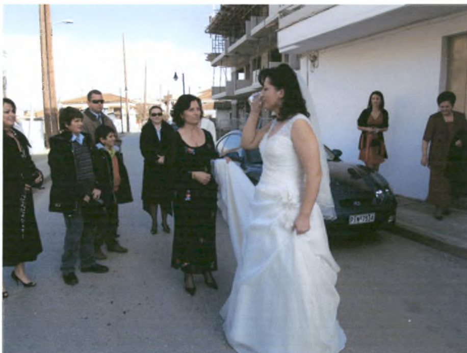
Η νύφη πίνει λευκό κρασί και ρίχνει το ποτήρι πίσω της για να σπάσει.