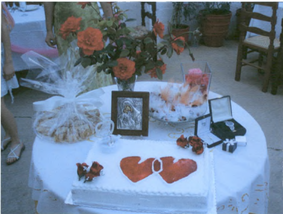
Σε ένα τραπέζι τοποθετούνται τα δώρα για το γαμπρό, η τούρτα και μια εικόνα για ευλογία του ζευγαριού. Επίσης τοποθετούνται λουλούδια και κεριά για διακόσμηση.