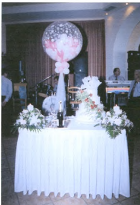
Το τραπέζι με την τούρτα και τη σαμπάνια.

Κάποια στιγμή, το ζευγάρι σηκώνεται από το τραπέζι και περνάει από όλους τους καλεσμένους για να τους ευχαριστήσει που παρευρέθηκαν στο γάμο.