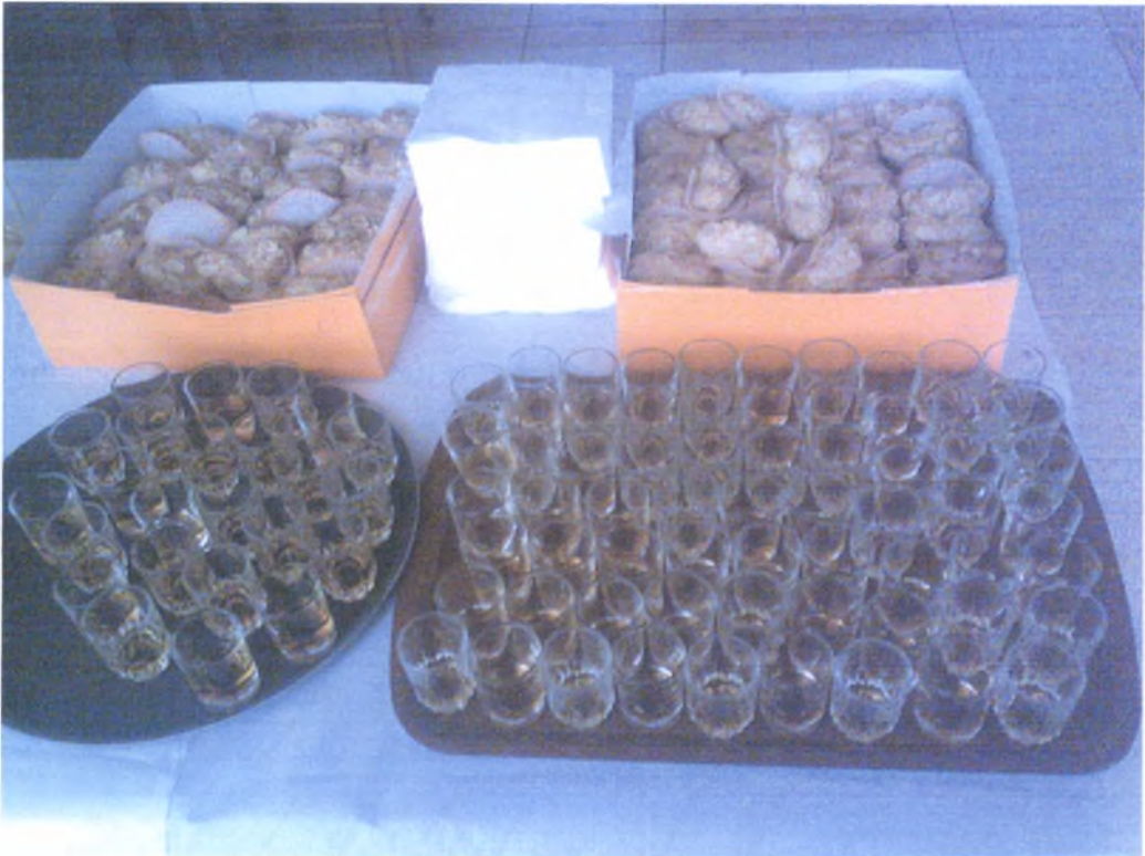
Στο μνημόσυνο προσφέρεται κονιάκ και κουλούρια.