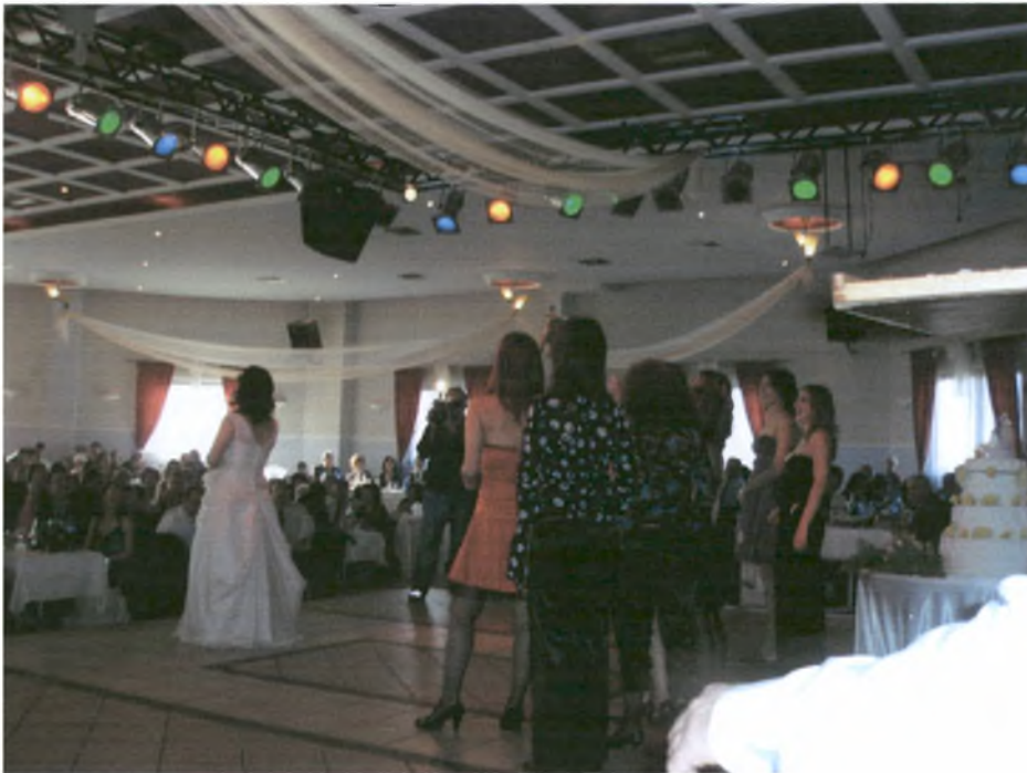
Οι ανύπαντρες κοπέλες ανεβαίνουν στη πίστα και η νύφη ρίχνει την ανθοδέσμη.