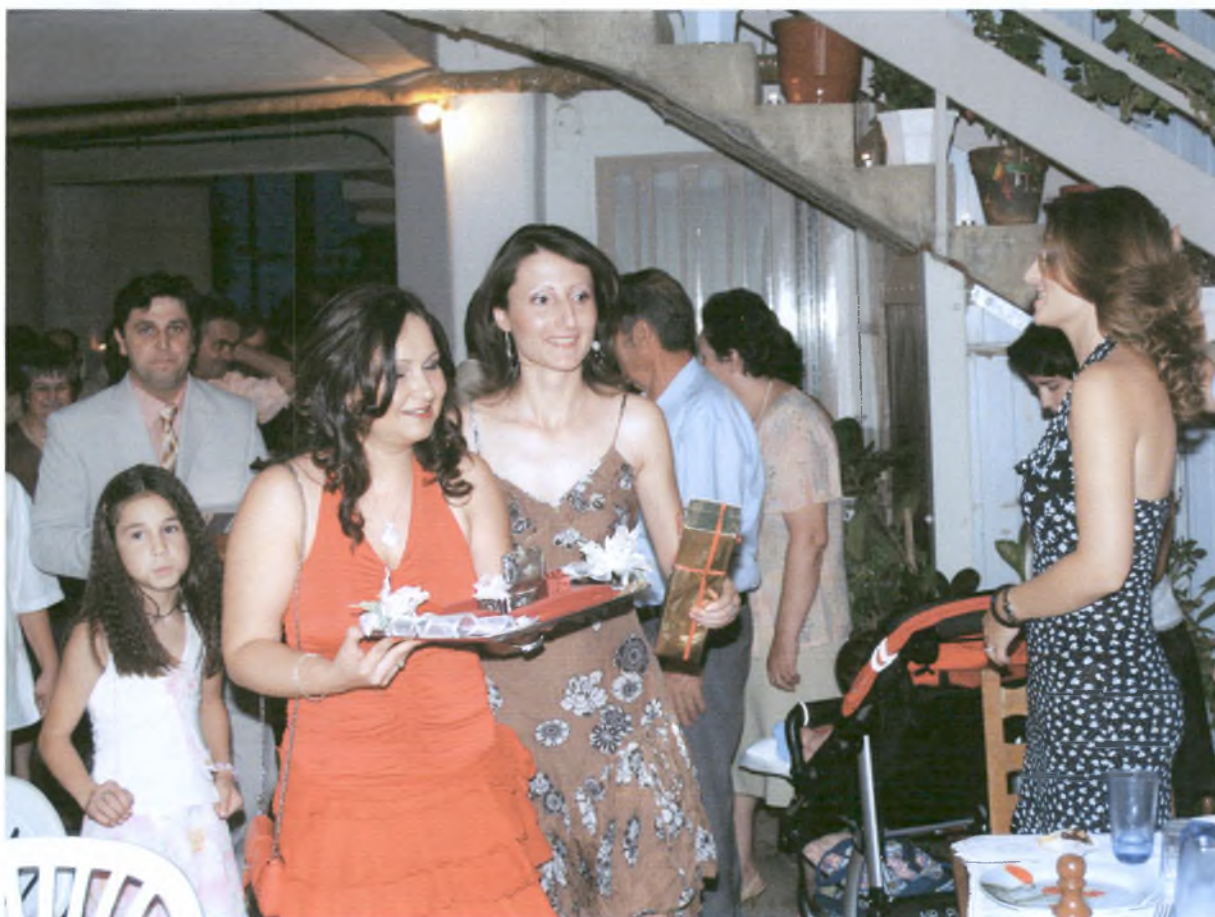
Μια αμφιθαλής ή νιόπαντρη κοπέλα κρατάει ένα δίσκο με τα δώρα για τη νύφη.

Όταν τελειώσουν οι ετοιμασίες, η οικογένεια της νύφης περιμένει το γαμπρό και την οικογένειά του. Ο γαμπρός έρχεται κρατώντας ανθοδέσμη, την οποία προσφέρει στη νύφη. Μια κοπέλα, συγγενής του γαμπρού, που ζουν και οι δύο γονείς της ή είναι νιόπαντρη, κρατάει έναν ασημένιο ή επάργυρο δίσκο, στον οποίο είναι τοποθετημένα τα δώρα για τη νύφη. Τα δώρα είναι, συνήθως, ένας σταυρός, ένα ρολόι, ένα σετ κολιέ και σκουλαρίκια και ένα δαχτυλίδι που προσφέρει ο γαμπρός στη νύφη. Στο δίσκο, μέσα σε κουφέτα και δεμένες με μια λευκή κορδέλα, που δηλώνει την ένωση του ζευγαριού, βρίσκονται οι βέρες. Ο δίσκος τοποθετείται πάνω στο τραπέζι με τα υπόλοιπα δώρα. Μια κοπέλα κερνάει κουφέτα και γλυκό- συνήθως εργολάβους- στους καλεσμένους. Ο καθένας παίρνει από δύο κουφέτα και εύχεται « Να ζήσουν και καλά στέφανα ». Λένε ότι αν οι ανύπαντροι βάλουν τα κουφέτα κάτω από το μαξιλάρι τους, θα δουν στο όνειρό τους αυτόν ή αυτή που θα παντρευτούν.