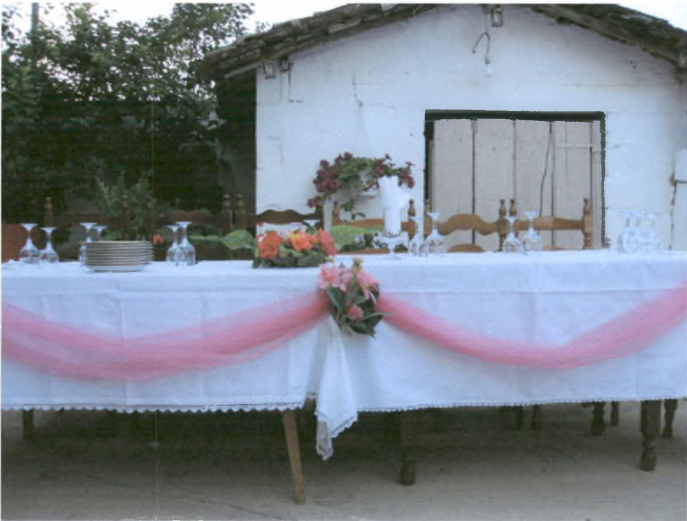
Τα τραπέζια στον αρραβώνα στολίζονται με τούλι, λουλούδια και κεριά.