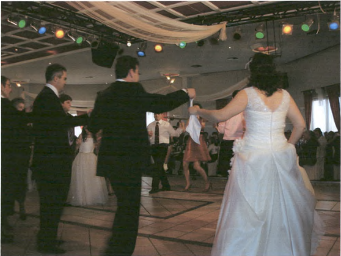
Το χορό σέρνει η νύφη

Μετά το γάμο, συνηθίζεται το ζευγάρι να πηγαίνει γαμήλιο ταξίδι. Το γαμήλιο ταξίδι δεν γίνεται πάντα αμέσως μετά το γάμο αλλά όταν έχουν και οι δύο χρόνο. Οι προορισμοί που επιλέγονται είναι συνήθως εξωτικοί, όπως για παράδειγμα η Χαβάη.