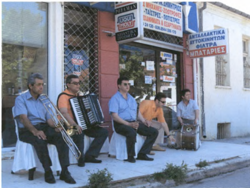
Τους καλεσμένους διασκεδάζει η ορχήστρα, που παίζει παραδοσιακά τραγούδια.