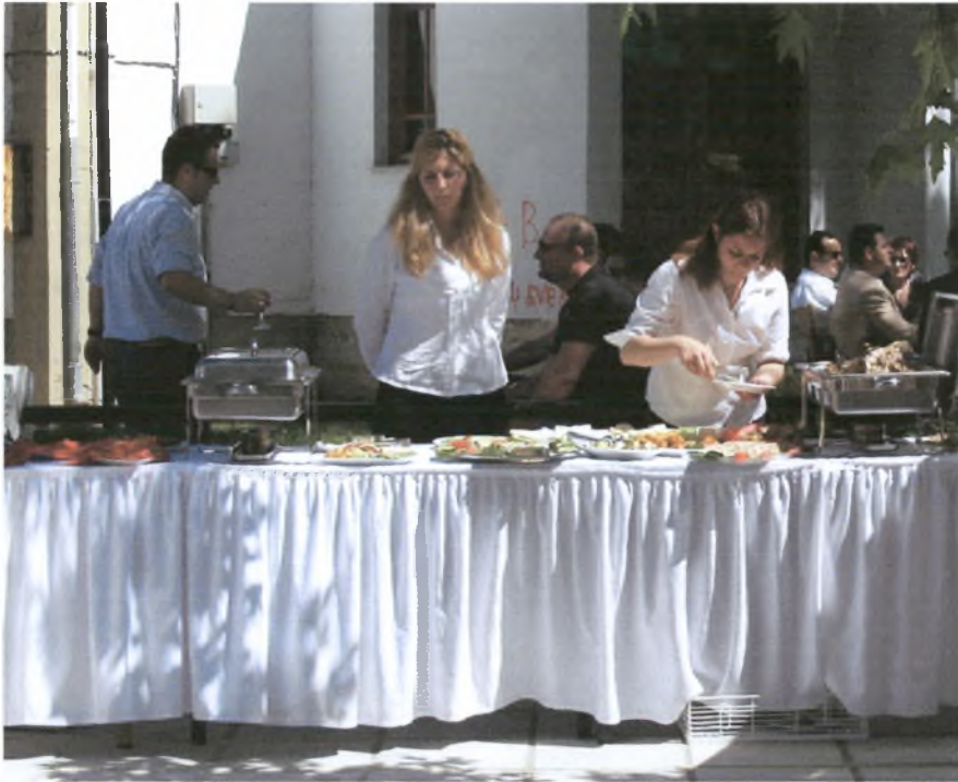
Το φαγητό για τους καλεσμένους του γαμπρού.