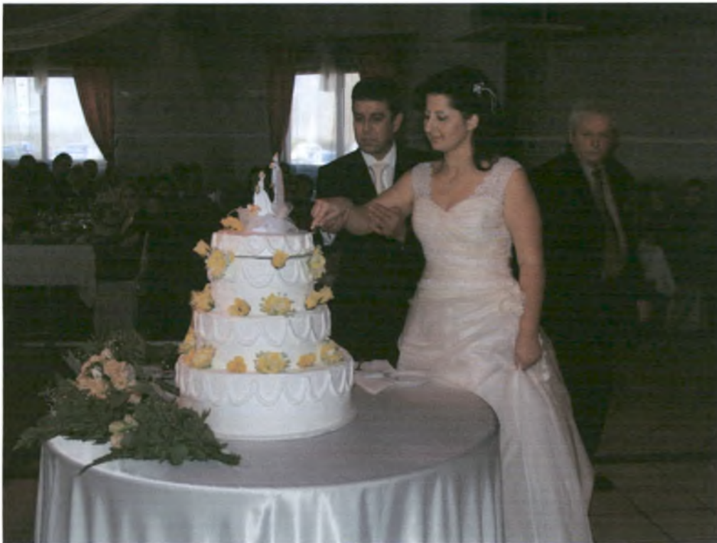
Οι νεόνυμφοι κόβουν μαζί ένα κομμάτι από την τούρτα.