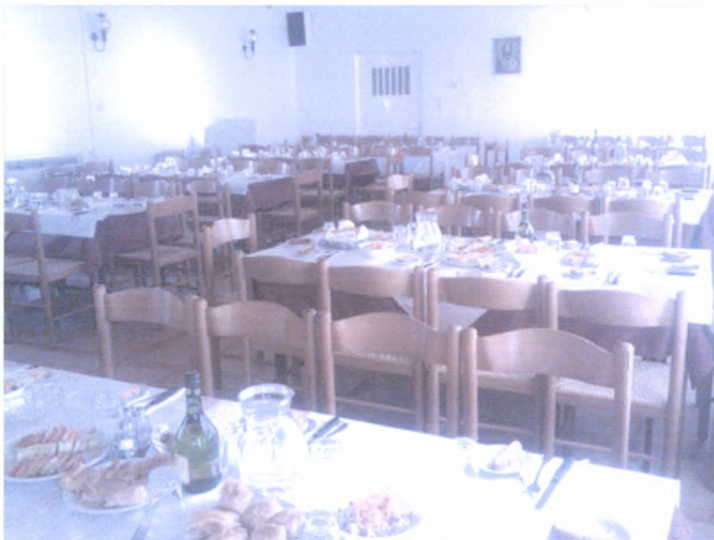
Η δεξίωση του μνημόσυνου γίνεται συνήθως στο πνευματικό κέντρο του ναού.

η γυναίκα παίρνει το δίσκο μετά στολισμένα κόλλυβα, τη λαμπάδα και τα πηγαίνει στην εκκλησία. Τοποθετούνται σ' ένα τραπέζι στο μεσαίο κλίτος της εκκλησίας, κοντά στην Ωραία Πύλη. Δίπλα από τα κόλλυβα τοποθετείται ένα βάζο με λουλούδια και η φωτογραφία του θανόντος στη μνήμη του οποίου γίνεται το μνημόσυνο. Στην είσοδο της εκκλησίας υπάρχει ένα τραπεζάκι κοντά στο παγκάρι όπου τοποθετούνται τα ψυχοκέρια. Κάθε ένας που εισέρχεται στην εκκλησία εκτός από το δικό του κερι ανάβει και το ψυχοκέρι το οποίο είναι πληρωμένο από την οικογένεια που κάνει το μνημόσυνο. Περίπου στις 8.30'ώρα φθάνουν στην εκκλησία οι συγγενείς οι οποίοι κάθονται στις καρέκλες των πρώτων σειρών κοντά στο σιτάρι. Είναι ντυμένοι στα μαύρα με ύφος πένθιμο. Συνηθίζεται να μεταλαμβάνουν εκείνη την ημέρα. Στο τέλος της λειτουργίας ψάλλεται το μνημόσυνο στο οποίο συμμετέχει όλο το εκκλησίασμα. Μετά δίνεται δεξίωση όπου προσφέρεται κονιάκ, καφές, σοκολατένια ελίτσα, παξιμάδι και διάφορες πίτες. Οι παρευρισκόμενοι συλλυπούνται τους συγγενείς και φεύγουν. Ακολουθεί το γεύμα με τον παπά, τους συγγενείς και όσους η οικογένεια είχε καλέσει να παρευρεθούν.