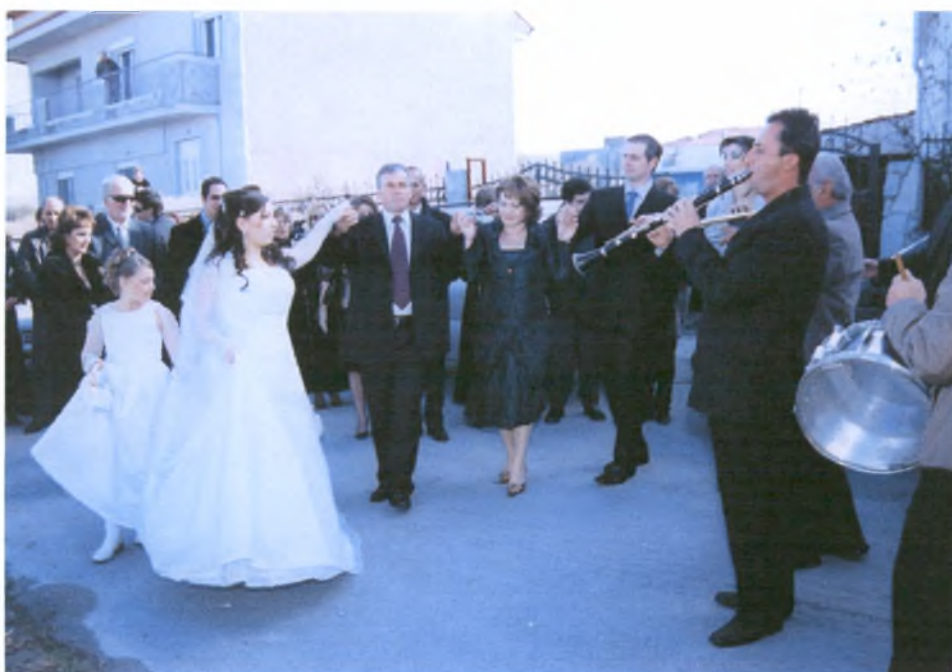
Η νύφη και η οικογένειά της χορεύουν έξω από το σπίτι έναν παραδοσιακό χορό, συνοδευόμενοι από τους μουσικούς.