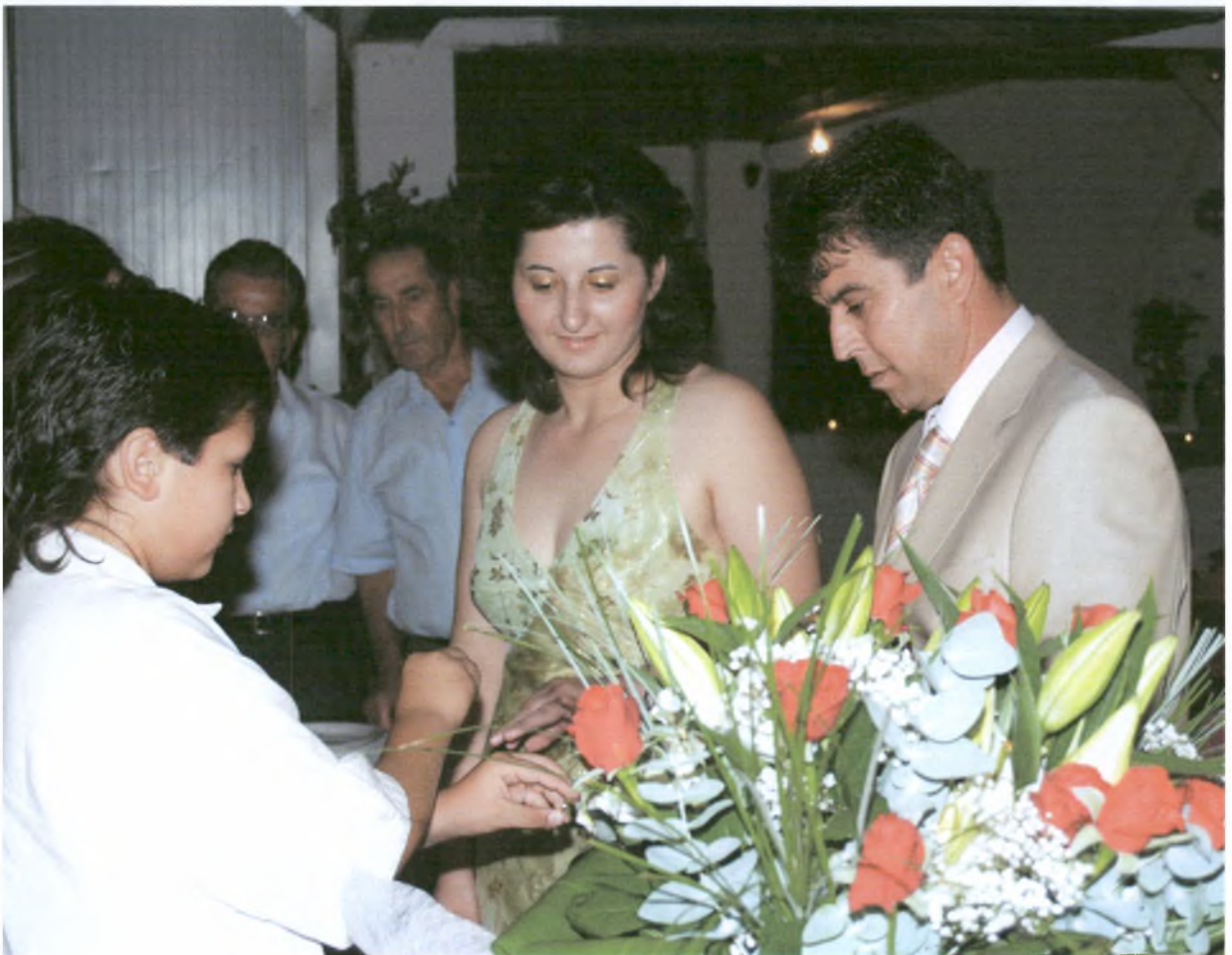
Ένα αγόρι περνάει τις βέρες στο ζευγάρι.

Έπειτα, ο κουμπάρος, ή ένα αγόρι, του οποίου οι γονείς ζουν και οι δύο, περνά τις βέρες στο ζευγάρι σταυρώνοντας τα χέρια του. Πολλές φορές τις βέρες περνάει παπάς, ο οποίος διαβάζει ευχές που λέγονται στην αρχή του μυστηρίου του γάμου. Αμέσως μετά, οι γονείς και τα αδέρφια του ζευγαριού προσφέρουν τα δώρα. Έπειτα το ζευγάρι κόβει ένα κομμάτι από την τούρτα και ταΐζει ο ένας τον άλλο. Οι καλεσμένοι εύχονται στο ζευγάρι λέγοντας « Να ζήσετε », και το « δωρίζουν », δίνουν δηλαδή χρήματα.