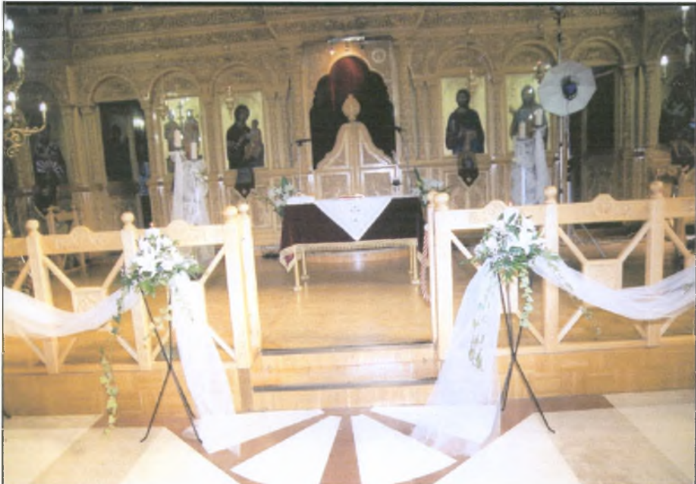
Η εκκλησία είναι στολισμένη με ανθοστήλες.