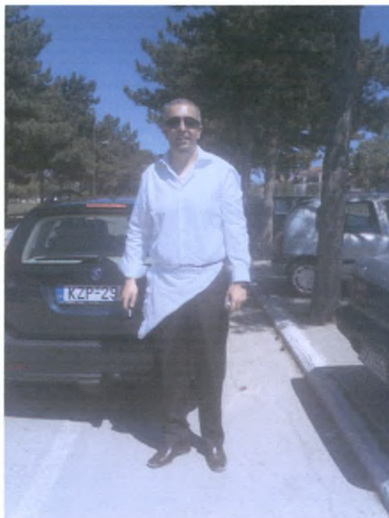
Οι φίλοι του γαμπρού φορούν μια λευκή ποδιά.

Ξεκινώντας για την εκκλησία έξω από το σπίτι, ο γαμπρός σπάει ένα ποτήρι ή ένα πιάτο γυάλινο, δείχνοντας έτσι ότι σπάει ο δεσμός με τους γονείς του. Επίσης, χορεύει με την οικογένειά του έναν παραδοσιακό χορό με ζωντανή μουσική από όργανα.