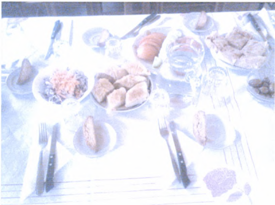
Σε κάθε τραπέζι υπάρχουν σαλάτες, παξιμάδια και διάφορες πίτες.