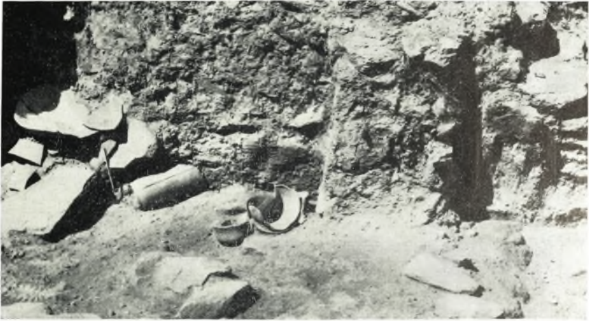
α. Ἀποψις τοῦ δυτικοῦ τμήματος τοῦ δωματίου 12. Διακρίνεται μία ἔσωτερικὴ ἀντηρὶς καὶ ἀγγεῖα ἐπὶ τοῦ δαπέδου.