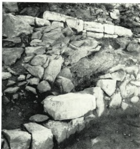
α. Πυραί παρὰ τὴν ὁδόν.