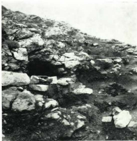
β. Ἀποψις τοῦ χώρου τῆς ἀνασκαφῆς Σελλάδας Θήρας.