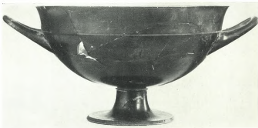
γ. Μελαμβαφής κύλιξ.