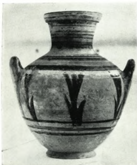
β. Κυπριακὸς ἀμφορεὺς.