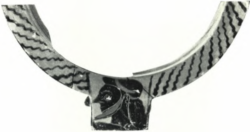
α. Χείλος μελανομόρφου κρατήρος.