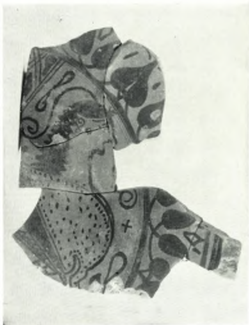
α. Τεμάχιον θηραϊκού πινακίου.