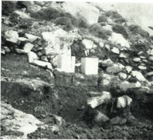
β. Ταφή καύσεως του 4ου αιώνας.