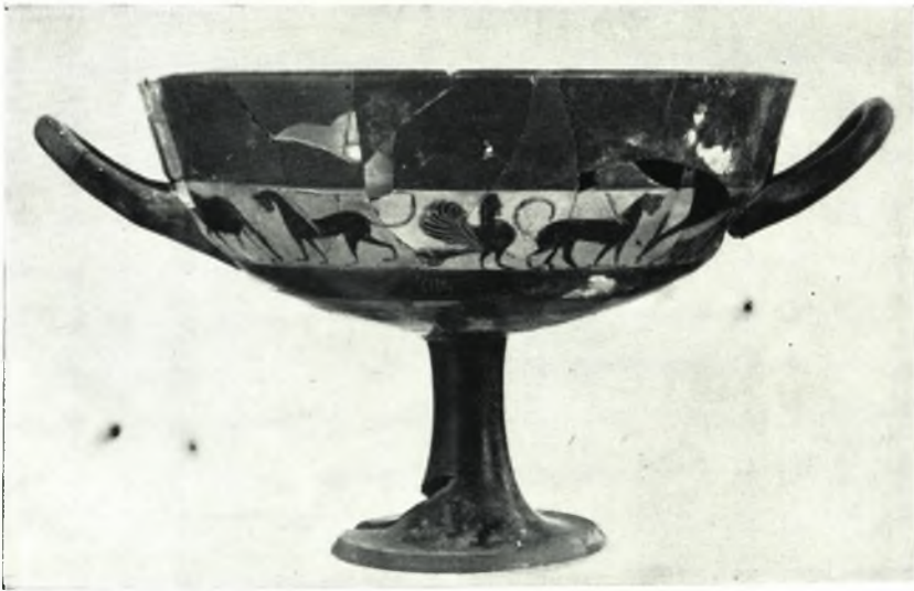
β. Κύλιξ μικρῶν καλλιτεχνῶν.