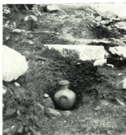
γ. Ταφὴ τοῦ 5ου αἰῶνος.