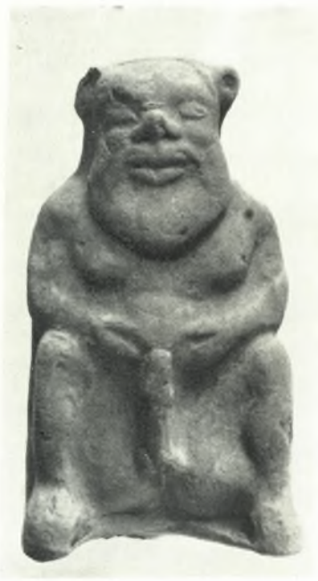
β. Πήλινον ειδώλιον Σιληνού.