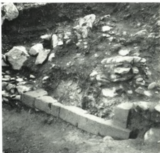
β. Ἀρχαϊκὴ ταφικὴ κατασκευή.