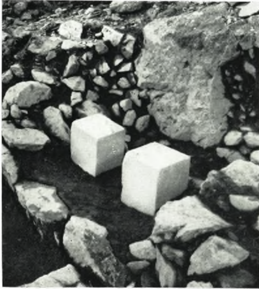
α. Τάφος του 4ου αιώνας.