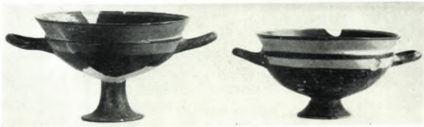
γ. Ἴωνικαὶ κύλικες.