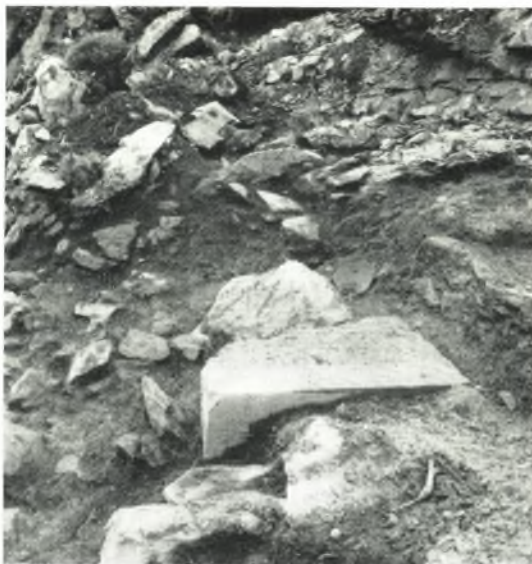
α. Ταφή του 5ου αιώνας.