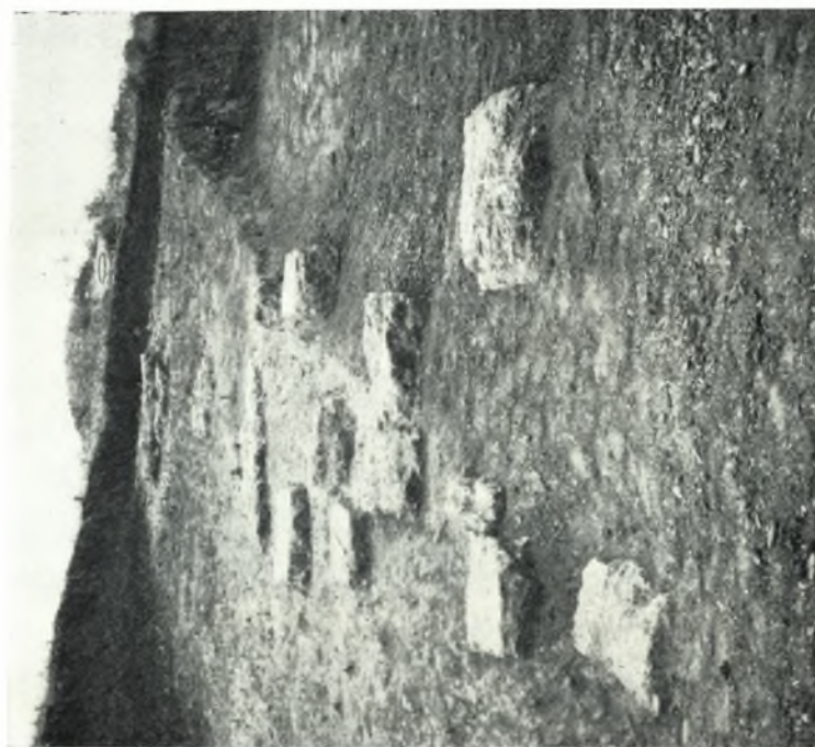
α. Λείψανα τῶν λιθίνων βαθμίδων τοῦ δυτικοῦ τιμήματος τοῦ κοίλου τοῦ θεάτρου τῆς Ἡλίδος.