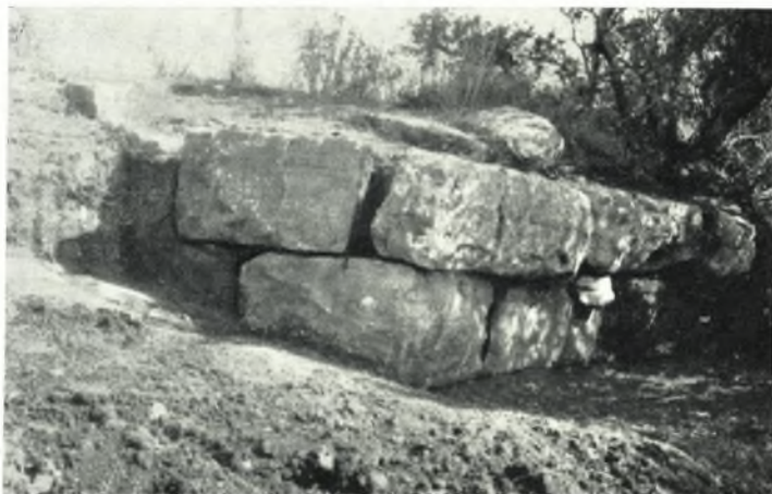
α. Λείψανα ιεροῦ παρὰ τὴν Μονὴν τῆς Κλειβωκάς.