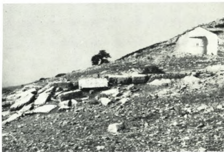
β. Λείψανα ιεροῦ Ἀφροδισίου δρυμοῦ.