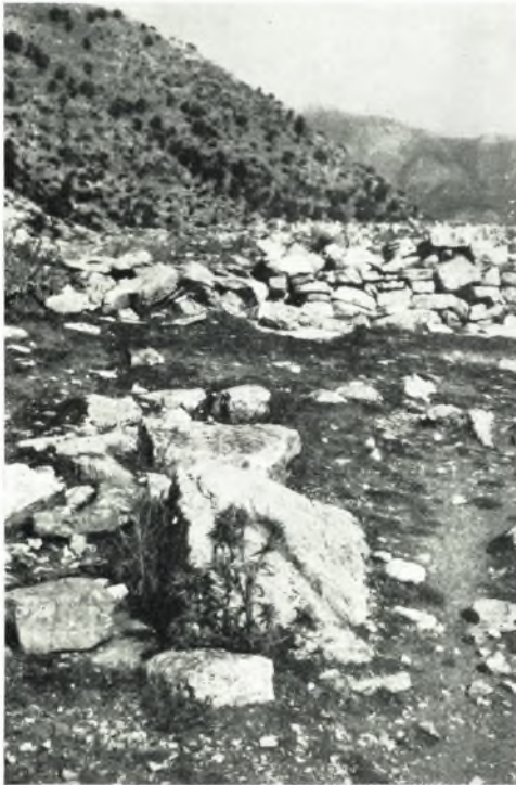
α. Βάσις στήλης τοῦ ἱεροῦ τοῦ Ἀφροδισίου δομοῦ.