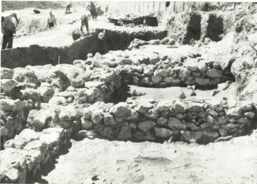
β. Ἡ οἰκία τῆς ἀνωτέρω εἰκόνας δρωμένη ἀπὸ Β.