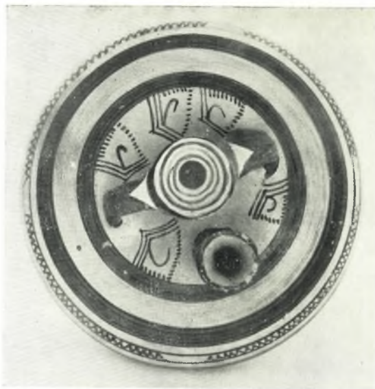
α. Διακόσμησης ὄμου τοῦ ψευδοστόμου ἀμφορέως τῆς εἰκόνας τοῦ πίν. 121γ δεξιά.