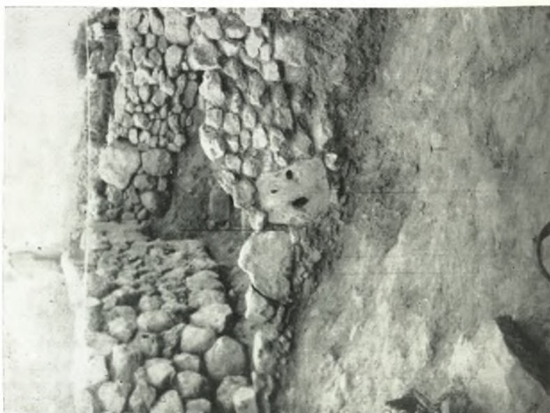
α. Νότια όψις της οικίας.