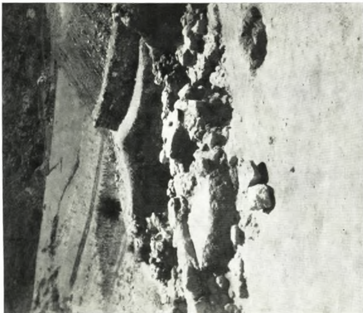
β. Τμήμα δαπέδου και παραπλεύρως φρεάτ ης νοτιωτέρας έλληυστικής οίκιας.