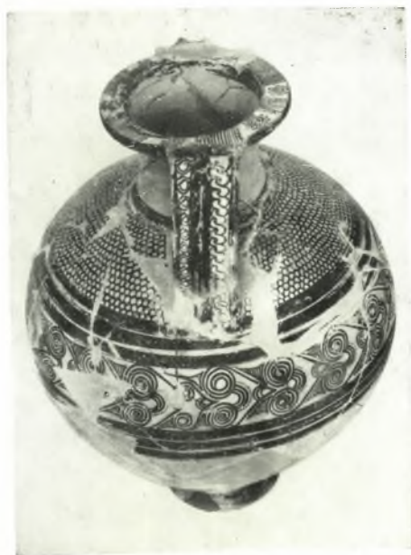
γ. Λεπτομέρεια διακοσμῆσεως τοῦ παραπλεύρως ἀμφορέως.