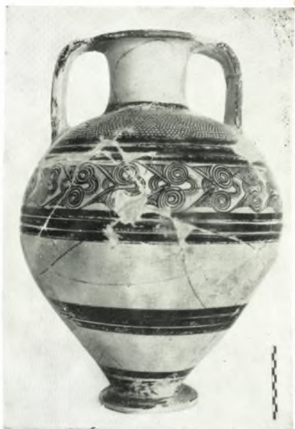
β. Ἀμφορεύς ἐκ τοῦ βόθρου ἀπορριμμάτων.