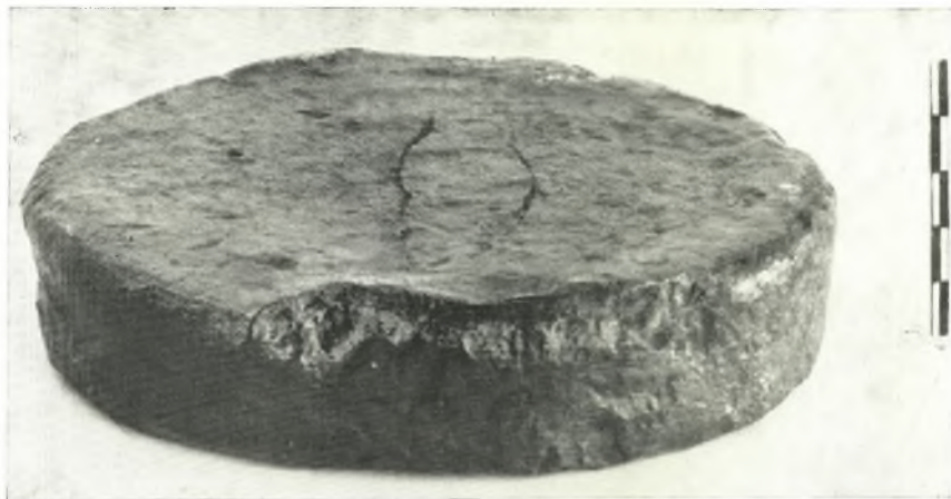
α. Μολύβδινος δίσκος ἐκ τοῦ βόθρου ἀπορριμμάτων βορείως τῆς Δυτικῆς οἰκίας.