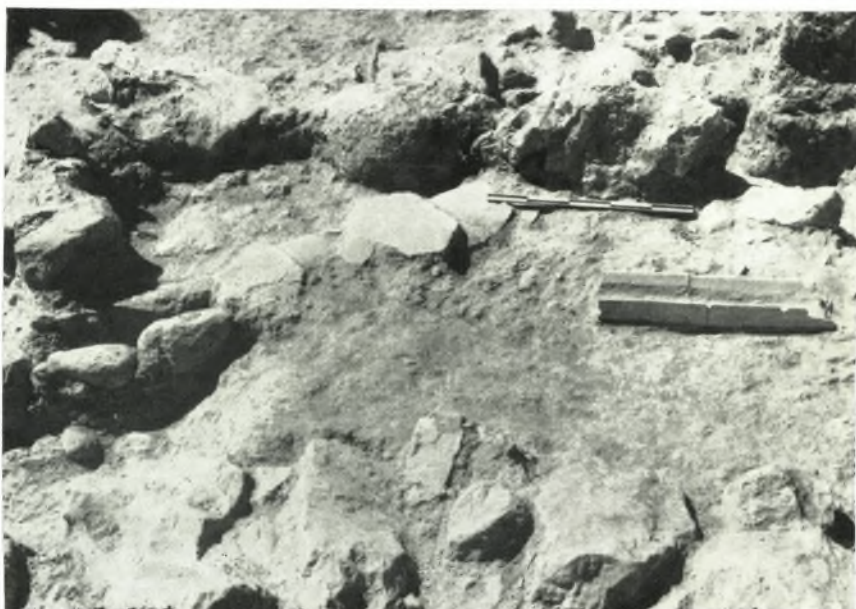
β. Σύστημα μικρῶν ἀγωγῶν (κτιστοῦ καὶ πηλίνου) τῶν ἑλληνιστικῶν χρόνων εἰς τὸ νοτιώτερον τμήμα τῆς μεσοελλαδικῆς οἰκίας.