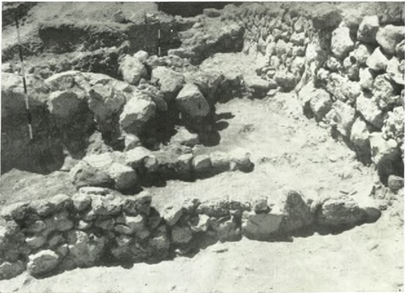
β. Ὀγκόλιθος καὶ κεραμικὰ θραύσματα ὡς «γέμισμα» τοῦ ὑπογείου τῆς ἐλληνιστικῆς οἰκίας.