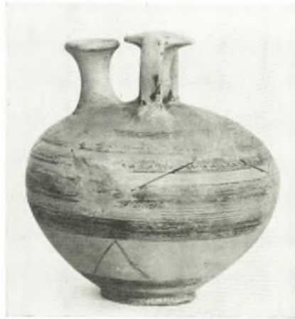
α-β. Ψευδόστομοι ἀμφορείς ἐκ τοῦ βόθρου ἀπορριμμάτων.