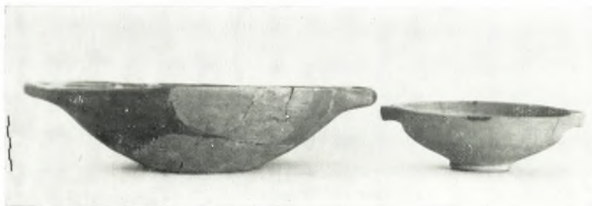
β. Δεκανίδες ἐκ τοῦ βόθρου ἀπορριμμάτων.