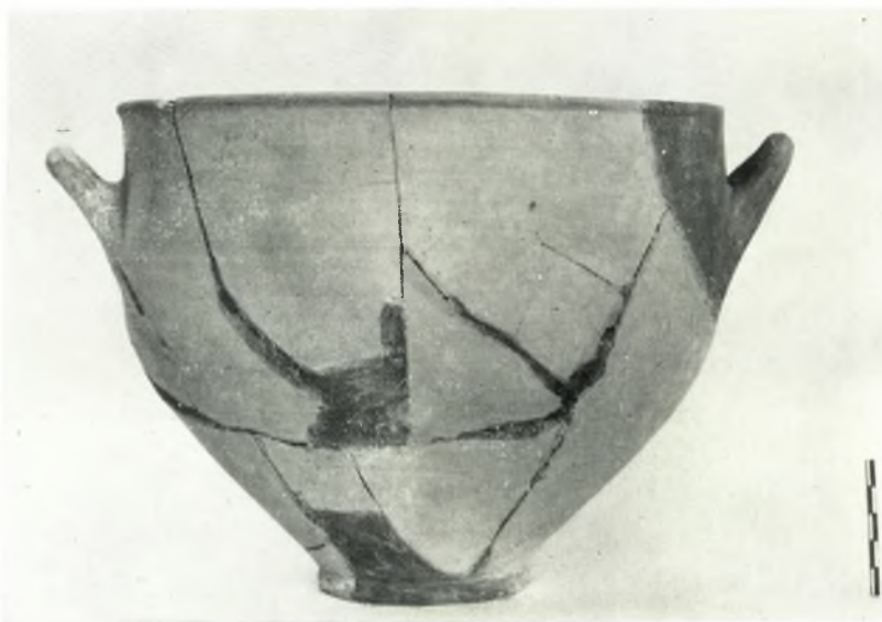
β. Σκύφος ἐκ τοῦ βόθρου ἀπορριμμάτων.