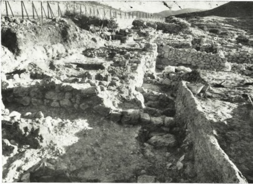
Ἡ ΝΔ, τῆς Λυτικῆς οἰκίας παλαιότερα οἰκία, δρωμένη ἀπὸ Ν. (ἀριστερὸν ἄκρον τῆς εἰκ).