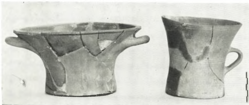
α. Ποτήρια ἐκ τοῦ βόθρου ἀπορριμμάτων.