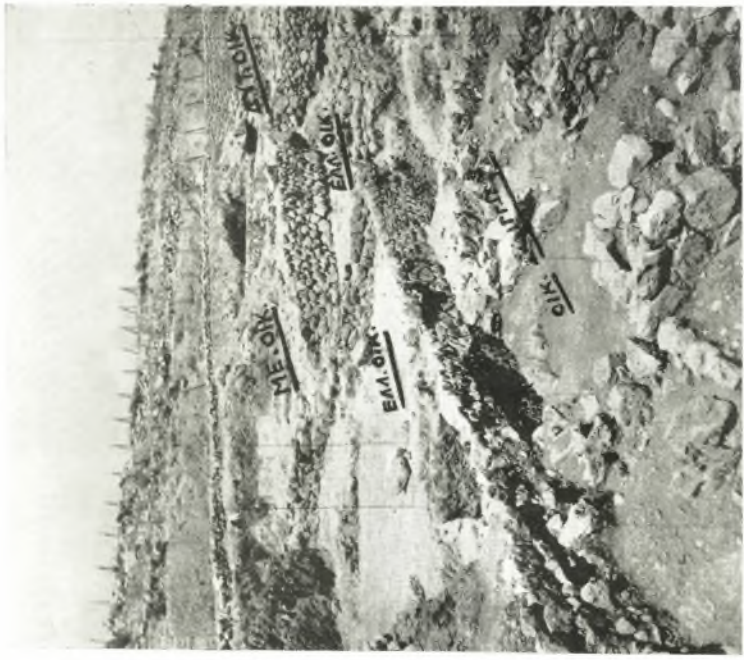
β. Γενική άποψη των αποκαλυφθέντων κτισμάτων: Δυτ. ΟΙΚ(τα), ΜΕ. ΟΙΚ(τα), ΕΛΛ(ηνιστικά) ΟΙΚ(τα): ΟΙΚΙΑ ΣΦΙΓΓΩΝ.