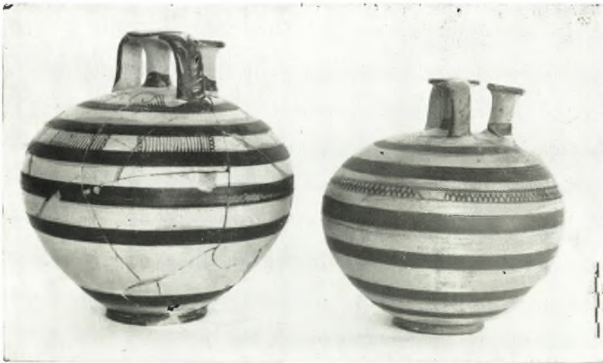
γ. Ψευδόστομοι ἀμφορείς ἐκ τοῦ βόθρου ἀπορριμμάτων.