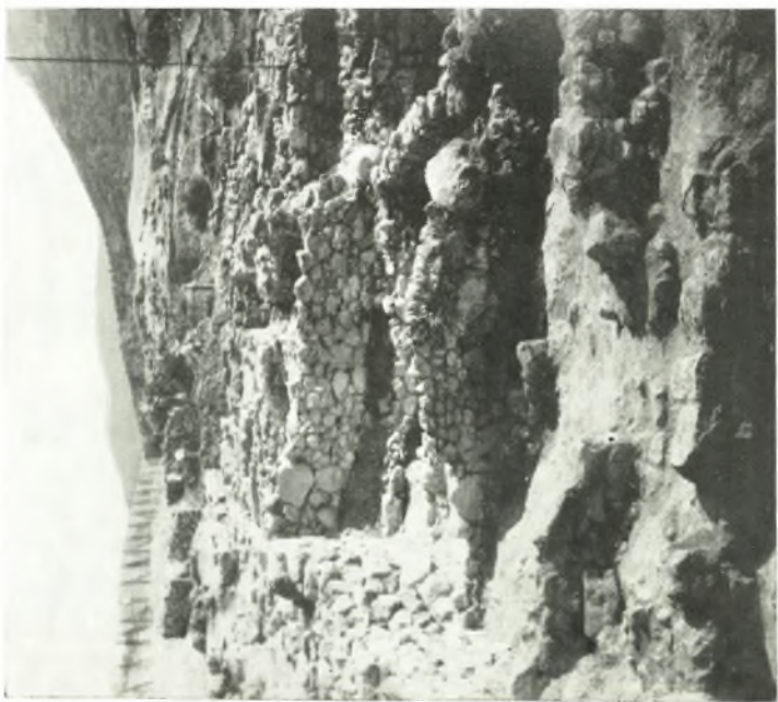
α. Έλληνιστικά οίκια ανατολικάς της μεσοελλαδικής και νοτίως της Δυτικής οίκίας.