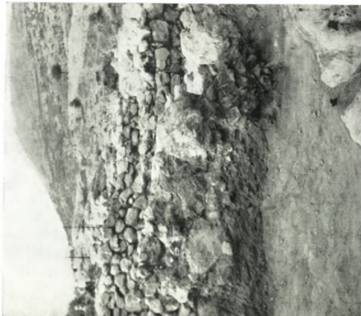
α. Όγκοίλοι και κεραιμεινά θραύσματα εις «γέμισμα» του ύπογειου τής οίκιας.