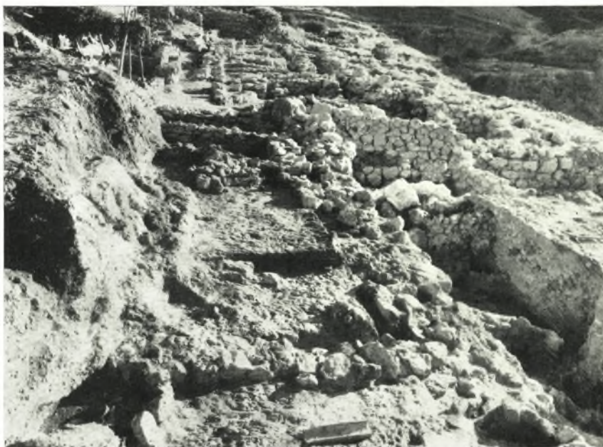
α. Ἡ οἰκία τῶν δύο προηγουμένων εἰκόνων ἀπὸ Ν. Ἐμπροσθεν ἀριστερὰ ἢ ἐντὸς τοῦ βράχου κοιλότης, ἔνθα εὐρέθησαν τὰ χρονολογούντα τὴν οἰκίαν τεμάχια ἀγγείων.