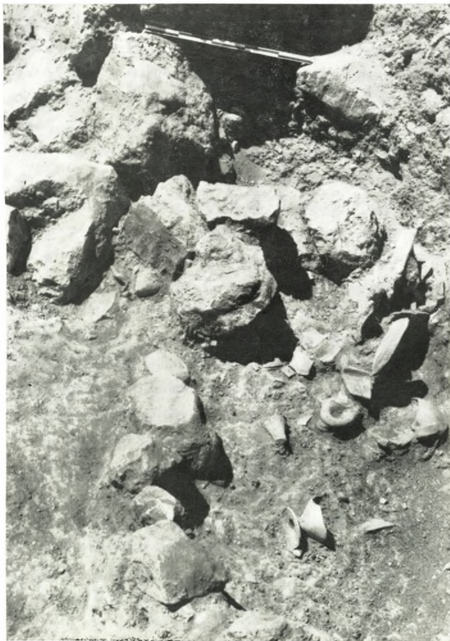
*Η εις τὸ ΝΔ. ἄκρον τῆς οἰκίας κοιλότης μετὰ τὰ εὐρεθέντα ἐν αὐτῇ τεμάχια ἀγγείων.