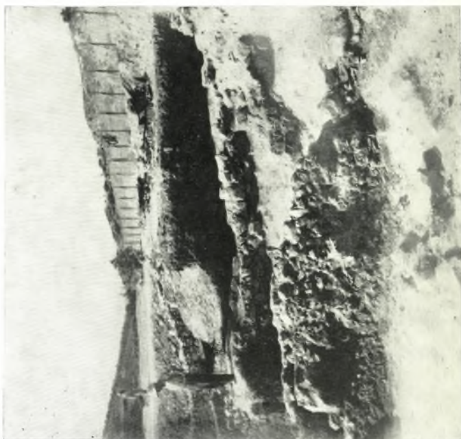
β. Τρόπος θεμελιώσεως των εγκαταστάσεων τοίχων της οικίας.