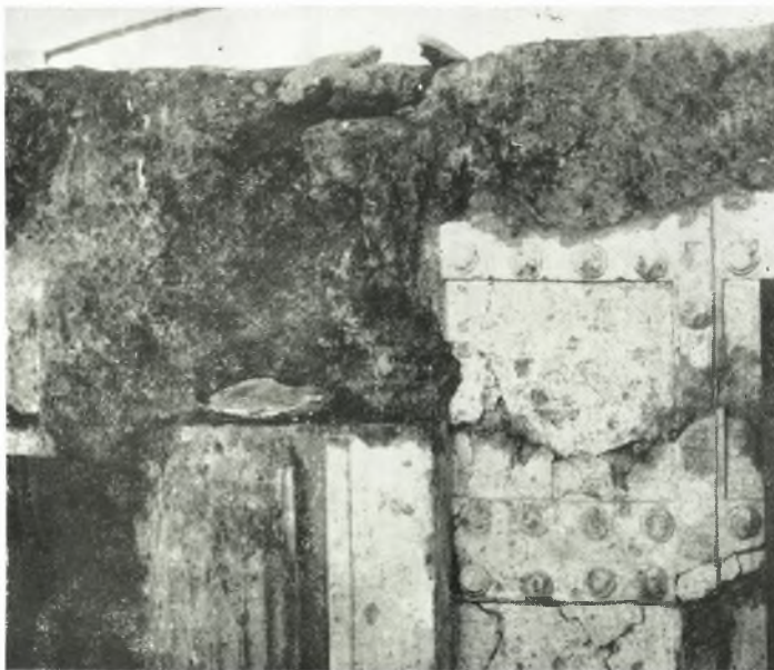
β. Τὸ ἀνώτερον μέρος τῆς αὐτῆς θύρας καὶ τοῦ αὐτοῦ ἡμικίονος μετὰ τὸν καθαρισμὸν.