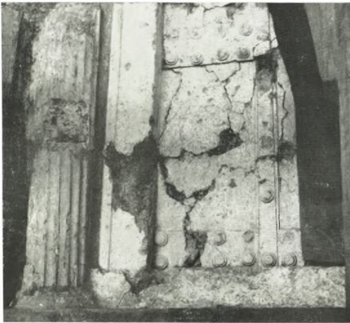
α Μέρος της πέμπτης ἐξ ἀριστερῶν θύρας τοῦ ἄνω ὀρόφου μετὰ μέρους τοῦ πρὸς ἀριστερὰ ἡμικίονος, μετὰ τὸν καθαρισμὸν.