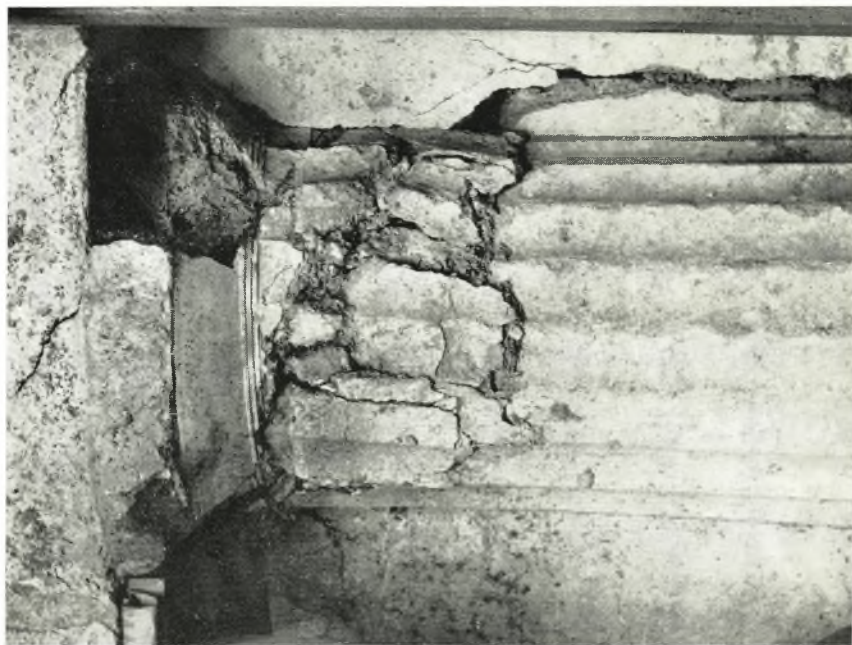
β. *Ο μεταξύ των γραπτών μορφών Λιακού και Ραδαμάνθους ήμικίων.