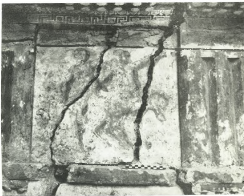
β. Ἡ πρώτη ἐξ ἀριστερῶν μετόπη.