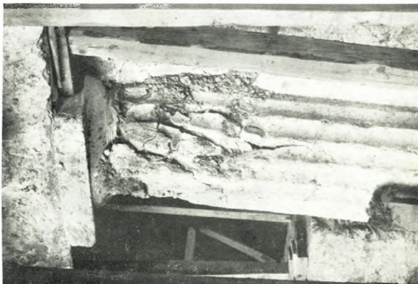
α. *Ο δεξιή της εισόδου ήμικίων.