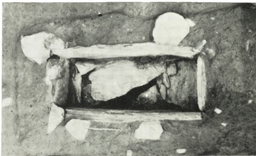
α. Πρωτογεωμετρικός παιδικός τάφος XLVI.