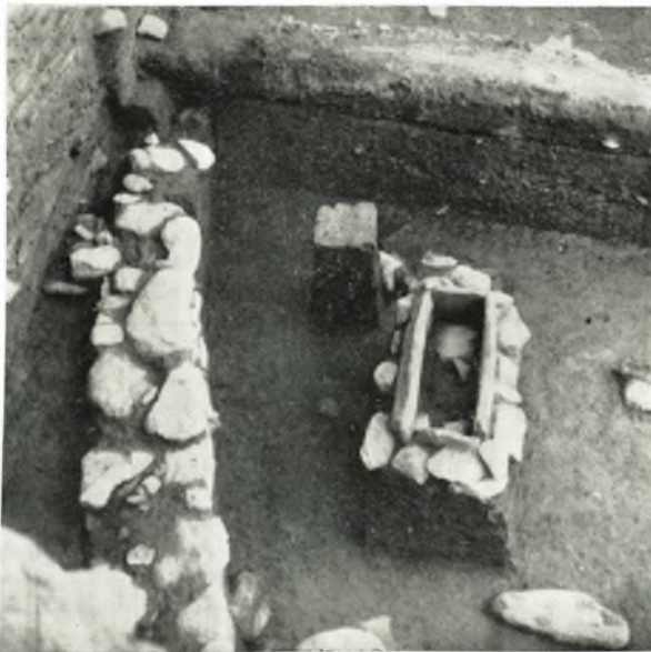
β. Πρωτογεωμετρικὸς τάφος πλησίον τοῦ τοίχου μυκηναϊκοῦ οἰκήματος.