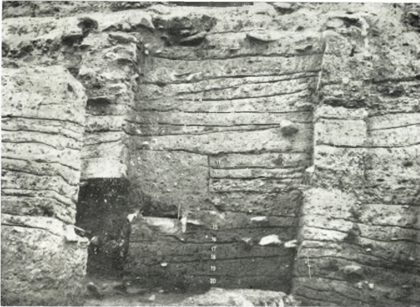
α. Όψις τμήματος τῆς στρωματογραφίας.