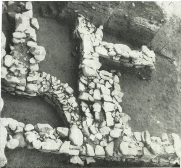
β. Οἰκήματα τῶν τελευταίων μυκηναϊκῶν φάσεων.