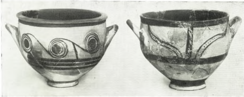
α. Γραπτά μυκηναϊκά άγγεία έκ του συνοικισμού (συμπληρωθέντα).