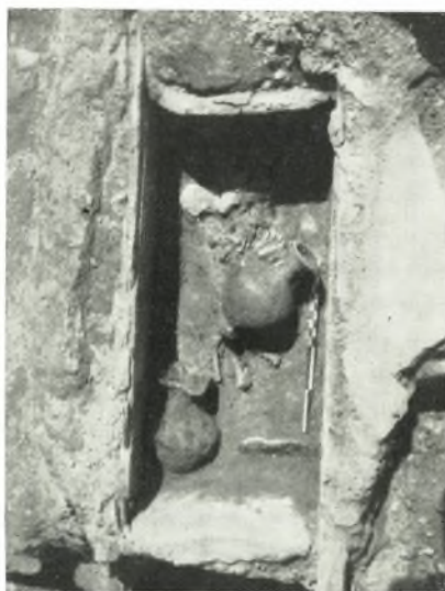
β. Πρωτογεωμετρικός τάφος XXV.