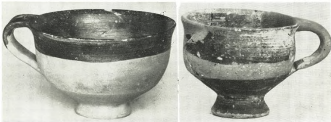
Πρωτογεωμετρικά κύπελλα α. ὕψ. 0.056 μ. β. ὕψ. 0.045 μ. ἐκ τοῦ συνοικισμοῦ Ἰωλκοῦ.