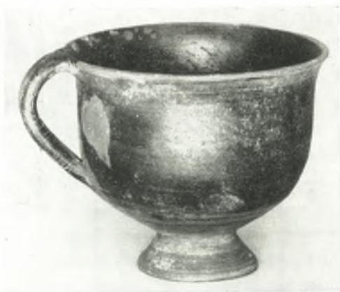
γ. Κύπελλον τάφου XXVII (ὑψ. 0.072 μ.).