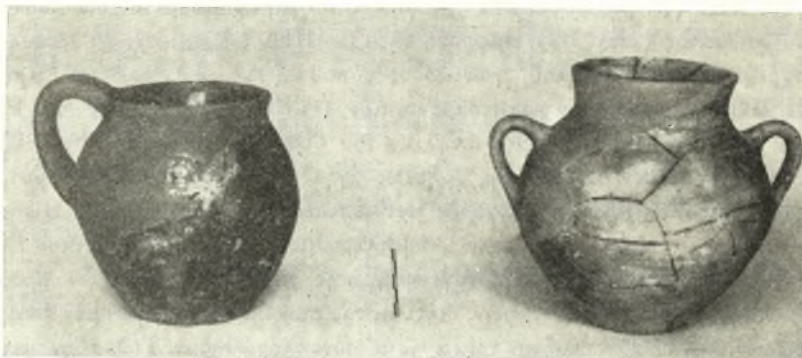
Εἰκ. 3. Οἰκιακῆς χρήσεως ἄγγεϊα ἐκ τοῦ μυκηναϊκοῦ συνοικισμοῦ α. ὕψος 0.147 μ. β. ὕψος 0.174 μ.

χονται καὶ ραβδία ἀμόρφου χαλκοῦ, ὡς καὶ σκωρίαι χαλκοῦ, τὰ λείψανα δὲ ταῦτα ἐν συνδυασμῶ μετὰ τὴν εὐρεσιν τμήματος χαλκουργικῆς χοάνης καὶ λιθίνης μήτρας δι' ἔγχυσιν κοσμημάτων, μαρτυροῦν περὶ ἐντοπίου κατεργασίας τῶν μετάλλων κατὰ τὴν περίοδον αὐτὴν.