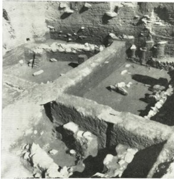
α. Ἐποψὶς τοῦ ΒΑ. τμήματος τῆς ἀνασκαφῆς.