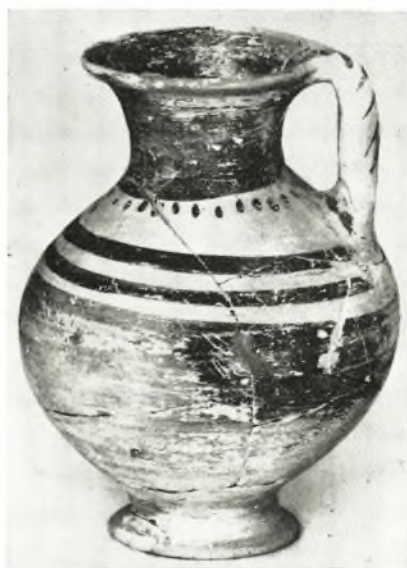
δ. Πρόχους τάφου XXXVIII (ὑψ. 0.12 μ.).