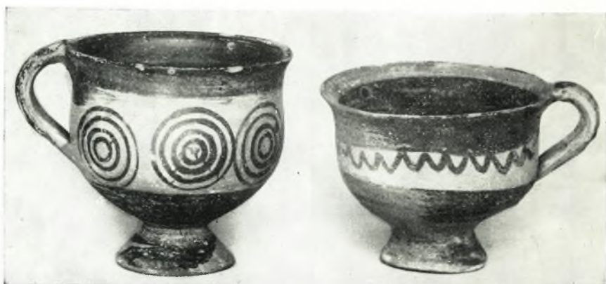
β. Πρωτογεωμετρικά άγγεϊα : 1 τάφου XXXI και 2 τάφου XXXVI.