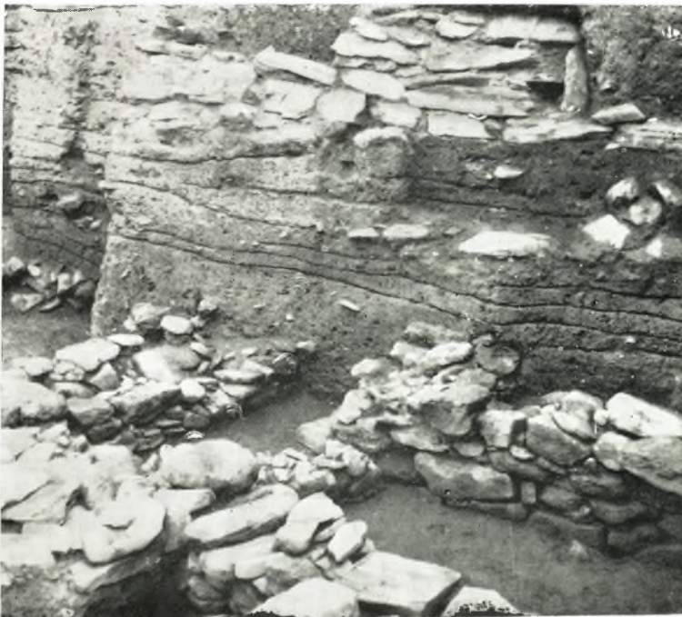
β. Ἐπάλληλοι οἰκοδομικαὶ φάσεις τῆς πρωτογεωμετρικῆς (ἄνω) καὶ τῆς τρίτης μυκηναϊκῆς περιόδου (κάτω).