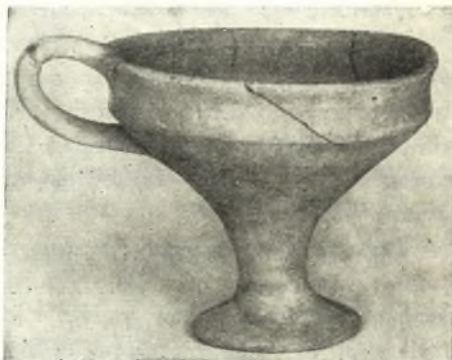
Εἰκ. 2. Μυκηναϊκὴ μονόχρωμος κύλιξ.

Διάφορα εὐρήματα. Τὰ σπουδαιότερα ἐξ αὐτῶν εἶναι τὰ μετὰλλινα, μεταξὺ αὐτῶν δὲ πάλιν μοναδικὸν εἶναι μολύβδινον ἄγγεϊον , διαμέτρου 0.44 μ., εὐρεθὲν ἰσχυρῶς συμπεπιεσμένον εἰς στρῶμα τῆς ΥΕ ΠΙΒ . Δυστυχῶς ἡ κατάστασις τοῦ μολύβδου δὲν ἐπέτρεψε τὴν ἀνέλιξιν τοῦ ἄγγεϊου, τοῦ ὁποίου τὸ ἀκριβὲς σχῆμα παραμένει ἄγνωστον. Σημειοῦμεν ἐπίσης χαλκοῦν μαχαίριδιον μετὰ τριῶν ἕλων κατὰ τὴν λαβὴν ( ΥΕ ΠΙΒ ) καὶ μικρὰν λεπίδα ἑτέρου ( ΥΕ ΠΙΓΓ Πρῶμι.). Ἀπὸ τὸ τελευταῖον μυκηναϊκὸν στρῶμα προέρ-