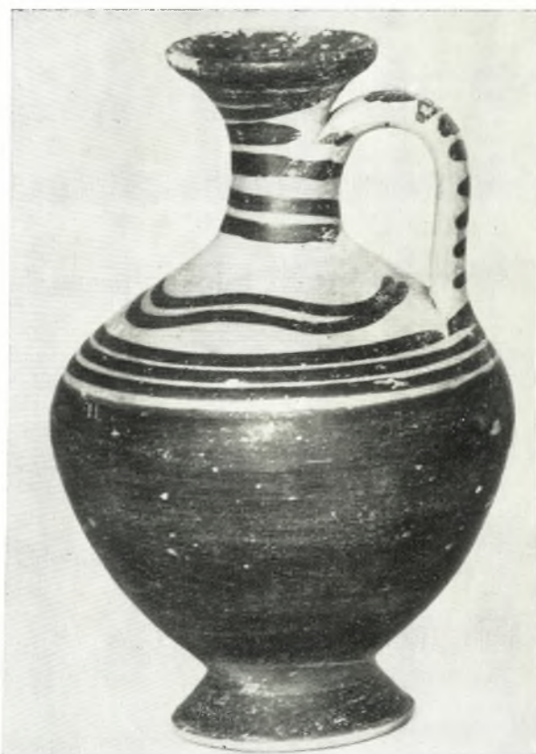
α. Πρόχους τάφου XXV (ύψ. 0.12 μ).