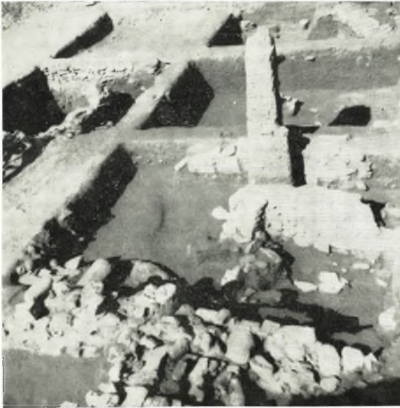
α. Άποψις τοῦ κεντρικοῦ τμήματος τῆς ἀνασκαφῆς.