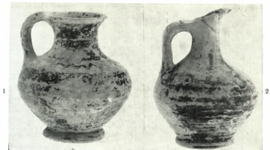
α. Οίνοχοισκai. 1. Έκ τοῦ τάφου 3. — 2. Έκ τοῦ τάφου 2.