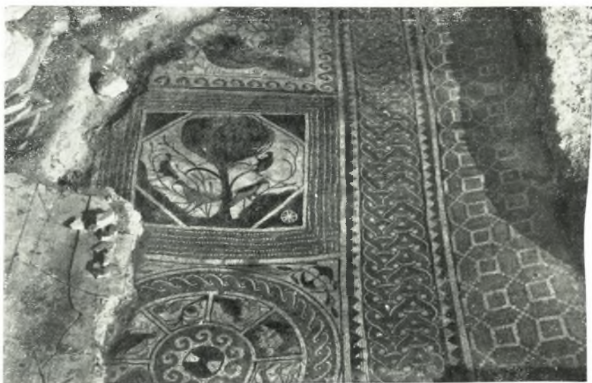
β. Τμήμα ψηφιδωτοῦ δαπέδου ἀναφανεῖντος ὑπὸ τὴν πλακόστρωσιν τοῦ Ὀκταγώνου καὶ ἀνήκον εἰς τὸν ἀρχαιότερον ναόν.