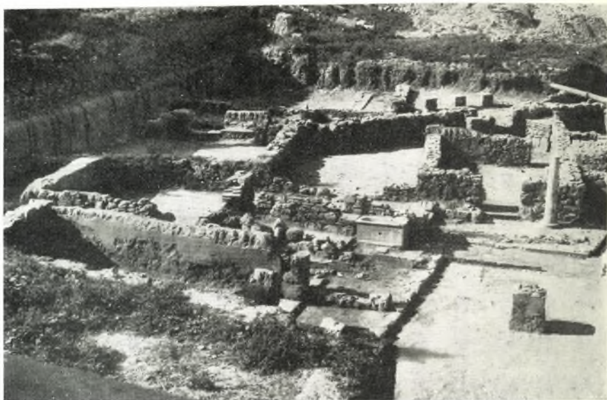
α. Ἀποψις τοῦ Ρωμαϊκοῦ οἰκοδομήματος ἀπὸ Ἀνατολῶν.