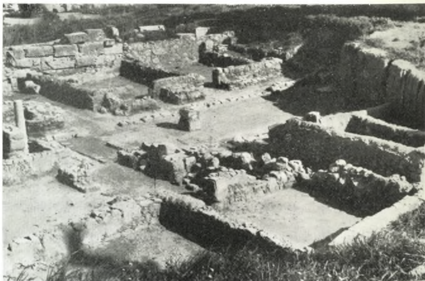
β. Ἀποψις τοῦ Ρωμαϊκοῦ οἰκοδομήματος ἀπὸ Δυσμῶν.