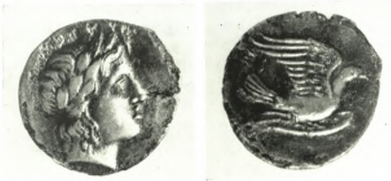
β. γ. Νόμισμα Σικυῶνος.