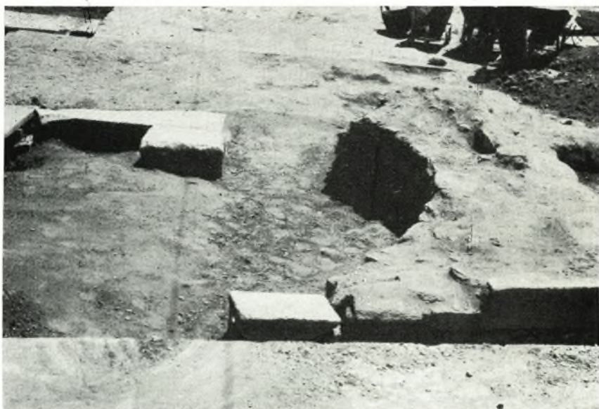
β. Τὸ κατὰ τὴν δυτικὴν πλευρὰν τοῦ αἵθρου ἀποκαλυφθὲν νότιον ἥμισυ τοῦ προπύλου. Ὅψις ἀπὸ Δυσμῶν.