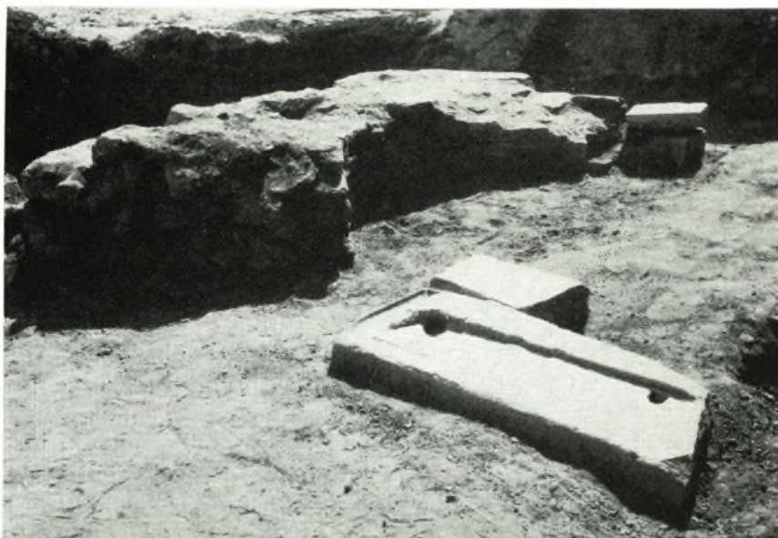
α. Τὸ κατὰ τὴν ἐξωτερικὴν πλευρὰν τοῦ αἵθρου ἀποκαλυφθὲν τμήμα τοῦ προπύλου. Ὅψις ἀπ' Ἀνατολῶν.