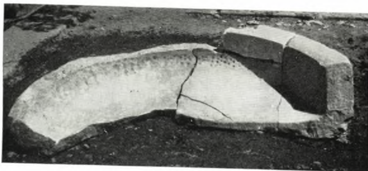
α. Τὰ εὐρεθέντα τεμάχια τῆς φιάλης τοῦ αἰθρίου.