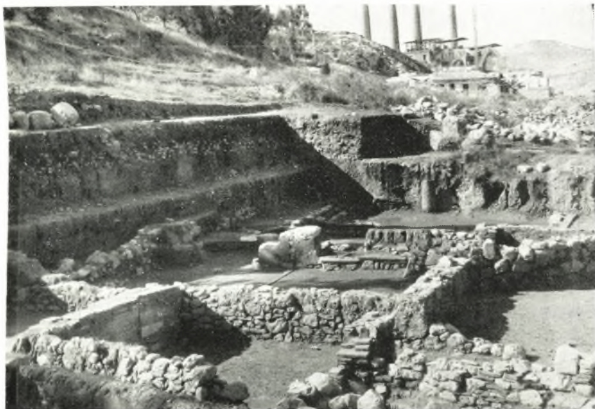
α. Τὰ ἀποκαλυφθέντα τὸ 1964 ἐρείπια τῆς οἰκίας Β.