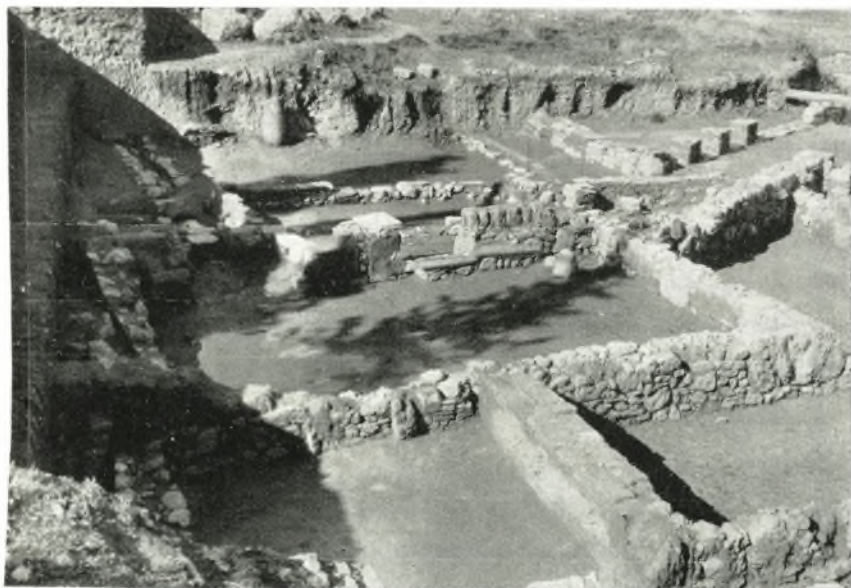
β. Τὰ ἀποκαλυφθέντα τὸ 1964 ἐρείπια τῆς οἰκίας Β.