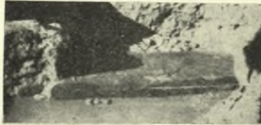
Εἰκ. 5. Τὸ κατώφλιον τῆς οἰκίας B .

0,60 μ. καὶ ὕψους 0,25 μ. Μολονότι δὲν ἀνεσκάφη εἰς ἅπαν τὸ μῆκος ὁ τοῖχος οὗτος, ὅμως ἡ ὀπωσδήποτε μικρὰ ἀπόστασις τοῦ κατώφλιου ἀπὸ τοῦ δυτικοῦ ἄκρου τοῦ τοίχου δεικνύει ὅτι τὸ κατώφλιον δὲν εὑρίσκεται εἰς τὸ μέσον τοῦ τοίχου· ὁμοίαν τοποθέτησιν ἔχομεν καὶ εἰς τὸ κατώφλιον τοῦ A (πρβ.