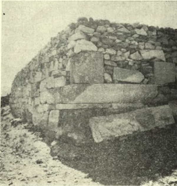
Εἰκ. 10. Ἀρχαῖον οἰκοδόμημα μετὰ συγχρόνου τοίχου ἐπικαθημένον ἐπ' αὐτοῦ εἰς Σαγγρι Νάξου.

Ἐξακολουθήσας καὶ ἐφέτος τὴν ἔρευναν τῆς νοτιῶς τοῦ χωρίου Σαγγρι ἐκτεινομένης κοιλάδος, ἐνδιαφερούσης ἕνεκα τοῦ πλήθους τῶν βυζαντινῶν ναῶν, οἱ ὅποιοι ὁ εἶς μετὰ τὸν ἄλλον ἀναφαίνονται ἐπὶ λοφίσκων ἢ ἐντὸς