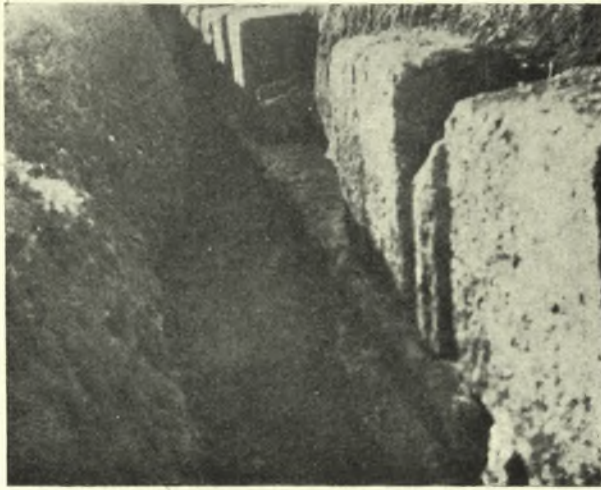
Εἰκ. 2. Ὁ πρὸς νότον τῆς μακρᾶς στοᾶς μεταγενέστερος τοῖχος.

Δεύτερον στόχον σκαφικῆς ἐρευνῆς ἀπετέλεσεν ἡ εὐθὺς πρὸς ἀνατολὰς