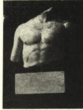
Εἰκ. 3. Κορμὸς νεανίου.

1) Μαρμάρινος κορμὸς νεανίου μὲ ἀποκεκρουμένην τὴν κεφαλὴν καὶ τοὺς βραχίονας (εἰκ. 3) ὀλικοῦ σωζομένου ὕψους 0,26 μ. Ὡς ἐκ τοῦ σωζομένου τμήματος τοῦ λαιμοῦ ἐμφαίνεται, ἡ κεφαλὴ ἦτο ἐστραμμένη ζωηρῶς πρὸς τὰ δεξιὰ. Ἡ λίαν ἐπιμελής ἐργασία, καὶ ἡ ἀρίστη ἀπόδοσις τῆς μυολογίας τοῦ κορμοῦ μὲ πολλὴν πλαστικὴν εὐαισθησίαν ἀνάγουσι τὸ ἔργον εἰς τὰς ἀρχὰς τοῦ Δ' π.Χ. αἰῶνος. Εὐρέθη εἰς τὴν αὐλὴν τῆς ἐν Βασιλικῷ οἰκίας Εὐαγ. Μιχαλοπούλου.