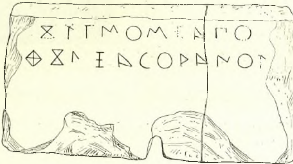
Εἰκ. 4. Ἐπιγραφὴ βάρθρου εἰς σικυώνιον ἀλφάβητον.

2) Βάσις μελανογράφου ληκύθου, διαμέτρου 0,08, προερχομένη προη ἀνωῶς