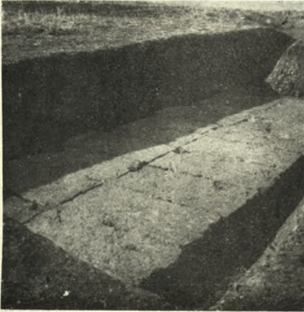
Εἰκ. 1. Τὸ ἀποκαλυφθὲν θεμέλιον τῆς πρὸ τοῦ Βουλευτηρίου στοᾶς.