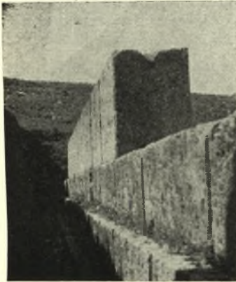
Εἰκ. 6. Ἀποψὶς τῆς ἀναστηλωθείσης νοτίας πλευρᾶς τοῦ Βουλευτηρίου ἀπ' Ἀνατολῶν.

Ὅσον ἀφορᾷ τὸ μετὰ τὴν λέξιν Μηνόδοτος σημεῖον εἰς τοῦτο, ὡς ἔξ